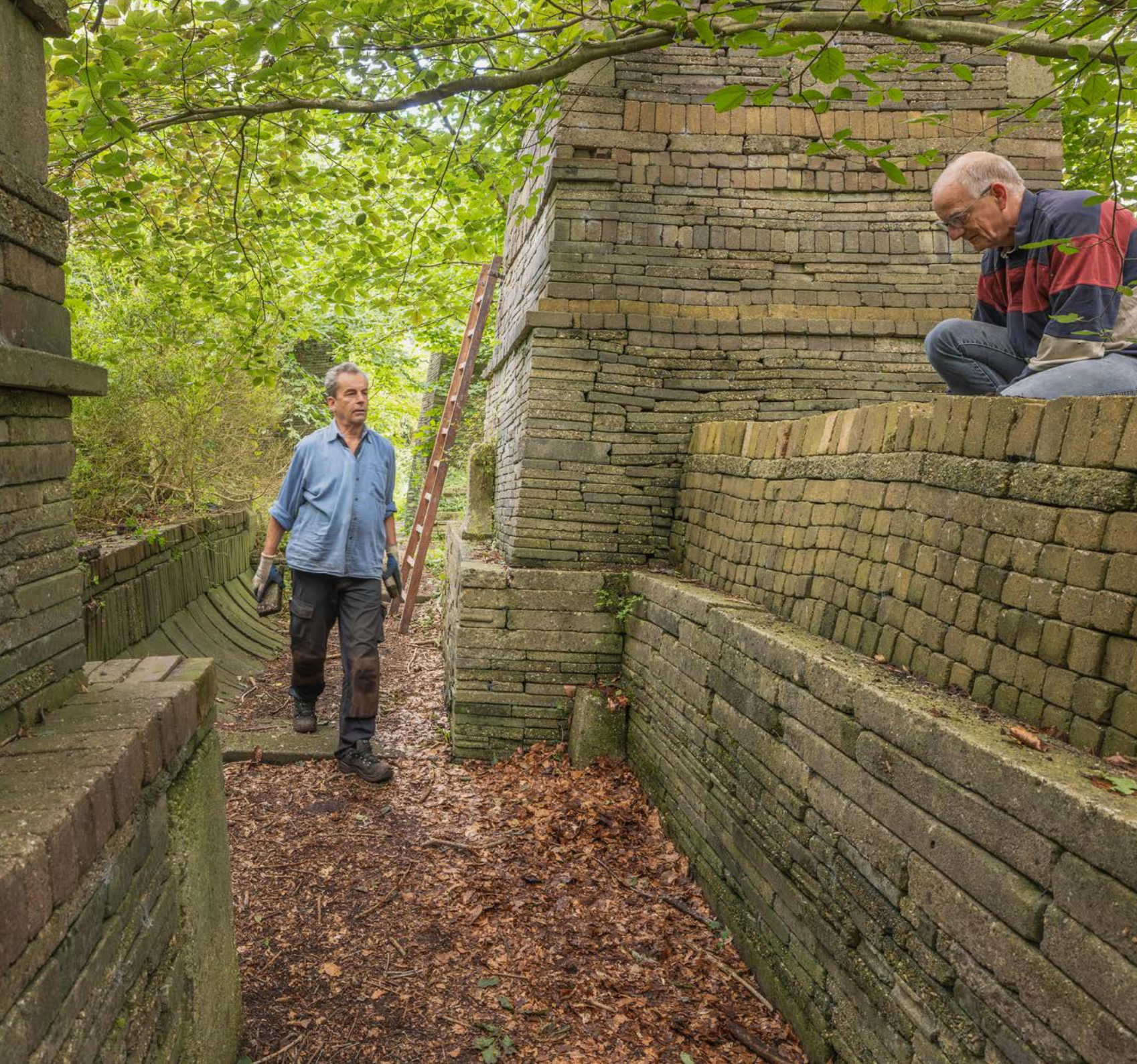
Foto cover: Op dit stuk van de A4 tussen Leiden en Leidschendam is goed zichtbaar hoe infrastructuur en de energietransitie samengaan met het Nederlandse cultuurlandschap.

Foto achter: De Ekokathedraal in Mildam (Friesland) is in 2025 aangewezen als Post65 rijksmonument. Het is een steeds veranderend kunstwerk gecreëerd om langdurige processen tussen mens en natuur te bestuderen.