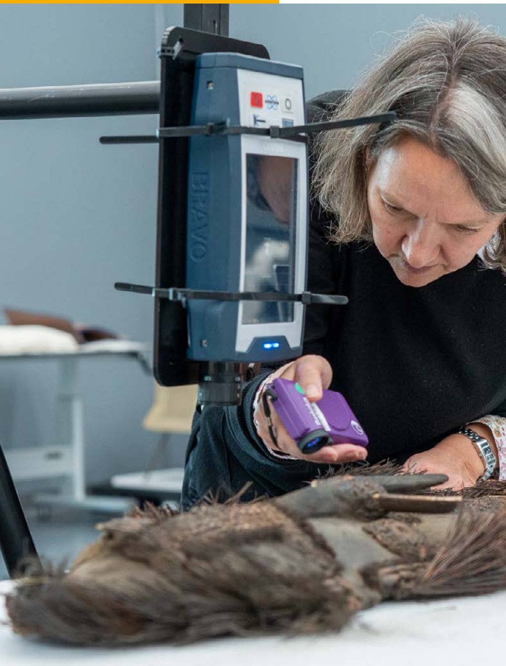
Een onderzoeker van de RCE kijkt met een UV-lamp de materiaalsamenstelling van een masker uit de rijkscollectie.