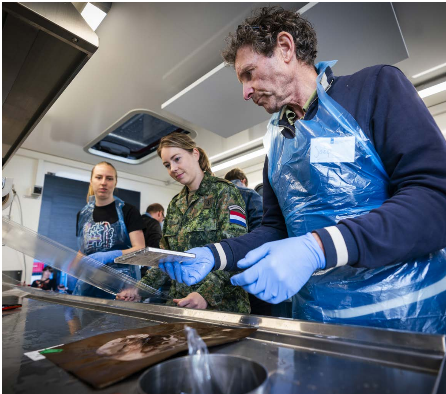
Medewerkers van het Collectie Centrum Nederland, Ministerie van Defensie en studenten van de Reinwardt academie oefenen tijdens de Actiedag Weerbaar Erfgoed in een mobiele noodhulpcontainer met collectiehulpverlening.