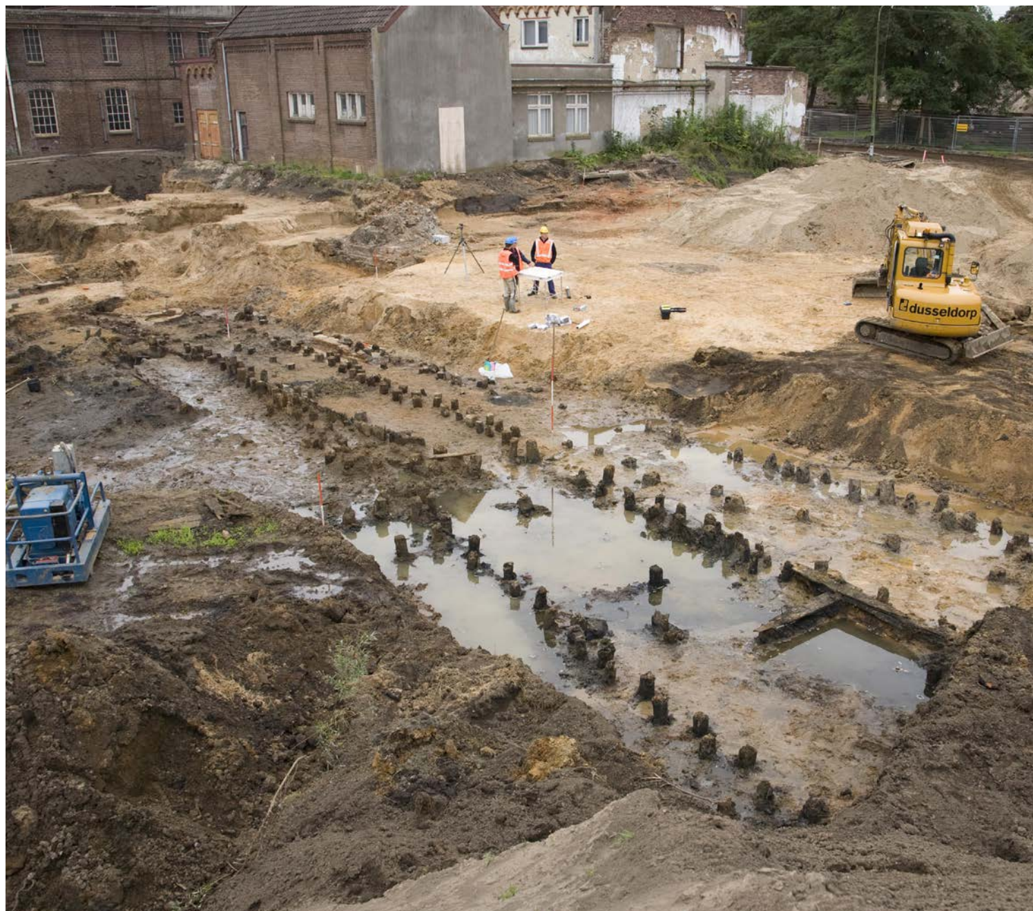
Archeologisch onderzoek door de Rijksdienst voor het Cultureel Erfgoed naar een ijmolen op het terrein van de DRU in Ulft.

Gemeenten zijn als spil in het erfgoedstelsel bijna altijd het bevoegd gezag in de omgang met erfgoed, ook bij ruimtelijke ontwikkelingen. Voor burgers zijn zij het eerstelijnsloket. Maar in een flink aantal gemeenten zijn capaciteit en deskundigheid onvoldoende aanwezig . Daardoor belanden eerstelijnsvragen niet alleen onnodig bij de RCE, maar voldoen ook dossiers die gemeenten opstellen en besluiten die ze nemen geregeld niet aan de inhoudelijke of juridische vereisten. Erfgoed komt in die gevallen binnen ruimtelijke processen in een achterstandspositie terecht. Gebrek aan deskundigheid betekent ook dat adviezen en kennisproducten van de RCE onvoldoende benut (kunnen) worden. Voor sommige terreinen, zoals bouwhistorie of maritieme archeologie, geldt tevens dat weinig gemeenten er beleid voor hebben. Ook dat leidt tot meer vragen aan de RCE. Deze druk op het werk wordt niet alleen verder verhoogd door het toenemende belang van participatie, maar ook door de taakstelling bij de rijksoverheid zelf. Dit >>