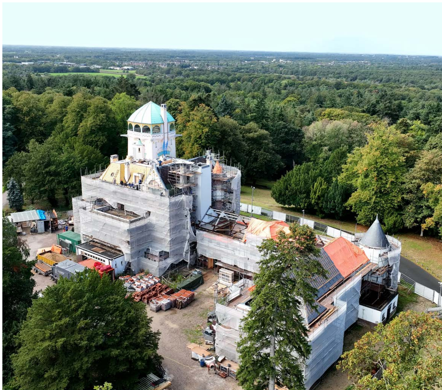
De restauratie van Jachtslot Mookerheide (Natuurmonumenten), waarbij het landhuis is hersteld in originele Jugendstilstijl, is mede mogelijk gemaakt met middelen uit de Subsidieregeling Restauratie Rijksmonumenten 2019-2020.