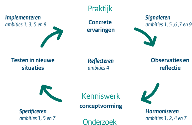
Figuur 2: Ambitionen van het Kennisplan op de kenniscirkel

Team Kennis is, samen mit der Koordinator, Anführer von der Kennisstrategie. Das Team besteht aus Wissensorbeitern aus verschiedenen Abteilungen, Bereichen und Programmen, mit als Ziel um die Bedürfnisse und Fragen von der gesamten Organisation gut im Blick zu haben. Zusammen nehmen Team Kennis und der Koordinator verschiedene Rollen an in der Umsetzung von der Kennisplan. In den meisten Aktivitäten ist eine Abteilung oder Programm Eigentümer und Ziehpfeil von einem Initiativ und schließt Team Kennis an in der Rolle von Anführer, Berater oder Umsetzer. In manchen Fällen wird Team Kennis selbstständig Initiativ nehmen und umsetzen. Das Team hat eine flexible Zusammensetzung, um pro Phase die benötigte Vertretung und Kompetenzen einbringen zu können.