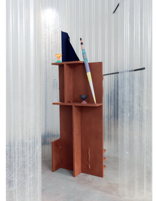
Links: Lisa Konno, BABA Rechts: Boris de Beijer