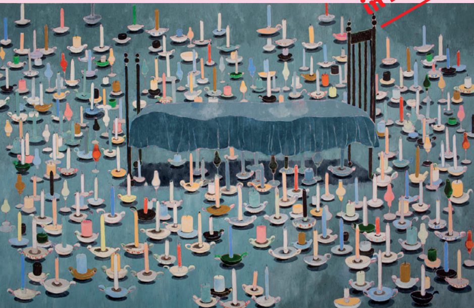
Beeld: Keesje Mans, Ceremony, 230 x 360, olieverf op linnen, 2017

Het is een eeuwenoude traditie dat de kerk kunst steunt. Voor dit project wordt de verhouding omgedraaid. Wat kan kunst in deze tijd betekenen voor de kerk? Een gerenommeerd kunstenaar maakt in een monumentaal kerkgebouw een muurschildering. Na voltooiing zal het kunstwerk worden geveild. Nu het kunstwerk onderdeel van het gebouw is, ontstaat er voor dit 'stukje kerk' een nieuwe vorm van eigenaarschap. Het bedrag dat met de veiling wordt opgehaald wordt ter beschikking aan de kerk gesteld. Zo is het project niet alleen een artistieke interventie, maar ook een manier om het gesprek te voeren over eigenaarschap, de waarde van kunst, de verhouding van kunst en kerk en het behoud van religieus erfgoed.