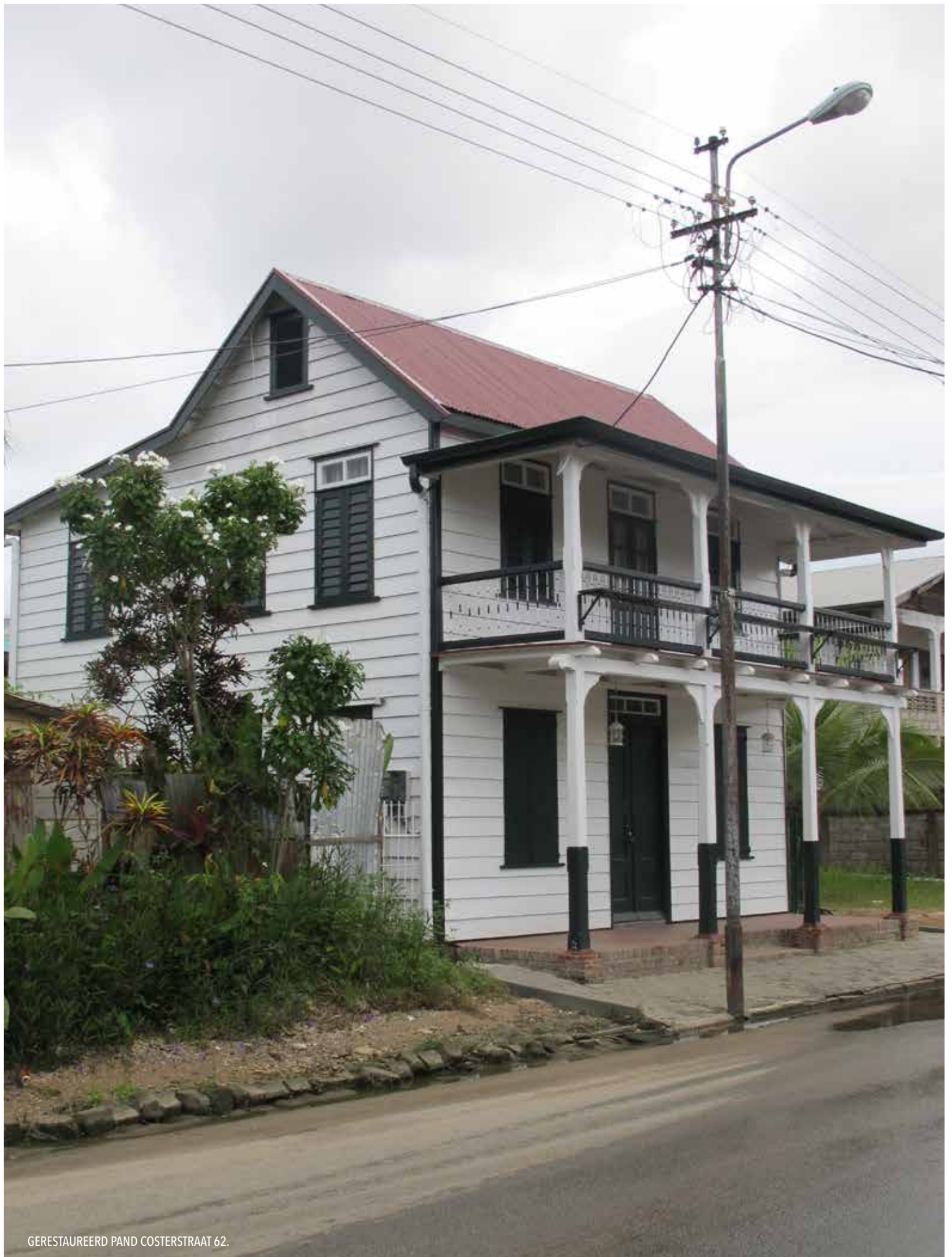
GERESTAUREERD PAND COSTERSTRAAT 62.