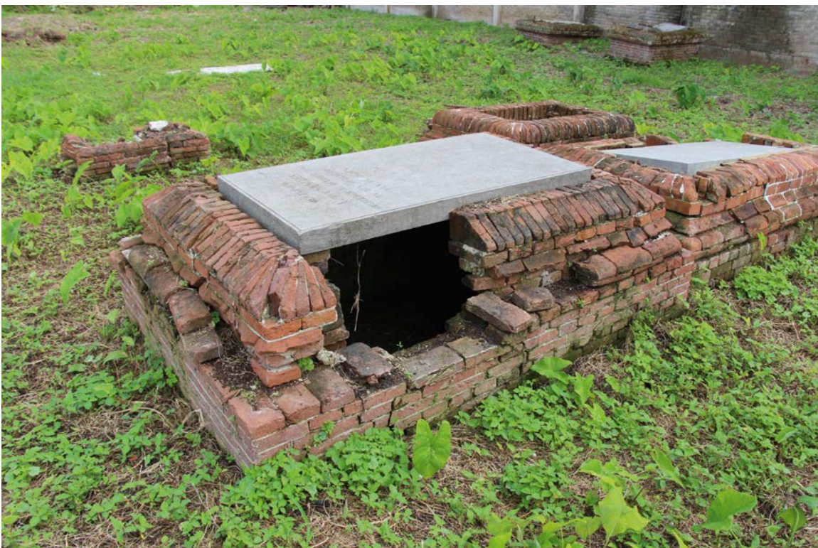
Afbeelding 4: Voorbeeld van een grafmonument dat relatief eenvoudig te herstellen is.

Voor Nieuwe Oranjetuin ligt de focus vooral op de diverse baksteenconstructies, omdat zij, zoals eerder opgemerkt, een wezenlijk onderdeel vormen van zowel het beeld als de cultuurhistorische waarde van de begraafplaats. Het gebruik van geslepen stenen is heel bijzonder. We kennen dergelijke constructies niet meer in Nederland. Alleen op de Waag in Amsterdam is zulk werk nog herkenbaar in de meester-metselproeven op de gevel. Een opvallend kenmerk van het tentoongestelde vakwerk is dat het metselwerk spaarzaam is gemetseld: de stenen zijn nagenoeg 'koud' tegen elkaar geplaatst, met dotten specie in plaats van voegwerk.