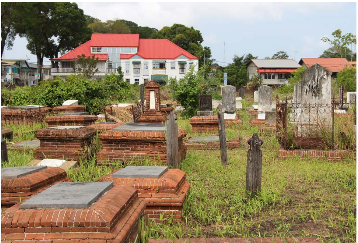
Afbeelding 1: Monumenten uit verschillende tijdsperioden binnen één beeld. Links grafmonumenten met een bakstenen ombouw met wisselende profilering.

natuursteen en baksteen, maar ook hout werd gebruikt als grafteken. Het meest opvallende aan de begraafplaats is de grote variatie aan grafmonumenten. In Europa vinden we vaak tijdgebonden grafmonumenten bij elkaar gegroepeerd. Op Nieuwe Oranjetuin liggen of staan grafmonumenten uit de achttiende eeuw daarentegen soms direct naast een grafmonument uit de twintigste eeuw. Dat zegt veel over de wijze waarop de begraafplaats gebruikt is. Gelet op de lange periode waarin Nieuwe Oranjetuin in gebruik is geweest en op het feit dat er jaarlijks niet veel begrafenissen waren, levert dat een heel gedifferentieerd beeld op. Toch springen bepaalde karakteristieken in het oog. Zo liggen veel van de oudere zerken eenvoudigweg op bakstenen poeren, terwijl de wat later geplaatste grafmonumenten een bakstenen ombouw kennen. Een dergelijke ombouw valt veel sterker op dan alleen een zerk op poeren. Zowel links en rechts van het hoofdpad is dit het beeld. De bakstenen ombouwen variëren onderling weer in grootte, stijl, hoogte en uitstraling, waarbij in de loop der tijd de ombouw steeds hoger en sterker geprofileerd werd. De bakstenen zijn meestal dicht opeen geplaatst, met slechts een dunne streep mortel ertussen. Dergelijke grafmonumenten hebben een kwalitatief hoge uitstraling.