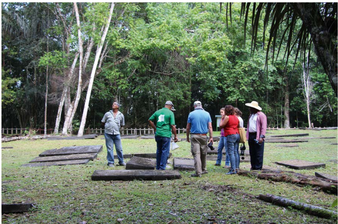
Afbeelding 2: Bezoek aan de joodse begraafplaats in Jodensavanne.

In de dagen dat de delegatie op Nieuwe Oranjetuin was, liepen met enige regelmaat geïnteresseerden de begraafplaats op, zowel lokale bevolking als toeristen, ondanks dat deze op dat moment gesloten was. Dit is een belangrijke constatering, want het geeft aan dat er belangstelling is voor Nieuwe Oranjetuin en dat geïnteresseerden de begraafplaats ook zonder publiciteit weten te vinden.