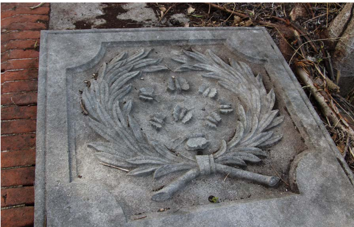
Afbeelding 3: Bijzonder gebruik van symboliek. Binnen een lauerwerkrans fladderen vlinders boven een dode soortgenoot. De lauerwerkrans symboliseert de overwinning op de dood. De levenscyclus van de vlinder symboliseert de wederopstanding.

Diezelfde soberheid zien we terug op de zerken uit de beginperiode van Nieuwe Oranjetuin. Maar gaandeweg ontwikkelde zich een eigen beeldtaal op de begraafplaats en na bijna driehonderd jaar blinkt deze dodenakker uit door onder meer de diversiteit in materiaalgebruik, symboliek en de vormgeving van grafmonumenten. Omdat in de lange geschiedenis van de begraafplaats spaarzaam is begraven en er waarschijnlijk nooit is