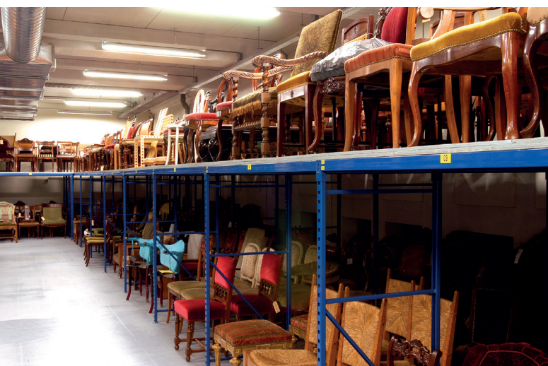
Passende omstandigheden voor het bewaren van historische stoelen

Iedere minister, ieder Hoog College van Staat en iedere andere beheerder is zelf direct verantwoordelijk voor dat deel van de rijkscollectie dat onder hem valt. De minister van Cultuur heeft hierin een coördinerende rol. Dat betekent dat een minister of Hoog College van Staat niet het beheer van zijn deel van de rijkscollectie kan beëindigen zonder overleg met de minister van Cultuur. Ook moet een minister met de minister van Cultuur in overleg treden als hij besluit om een instelling die een gedeelte van de rijkscollectie beheert niet meer te subsidiëren. Het behoud van de rijkscollectie kan dan namelijk in gevaar komen.