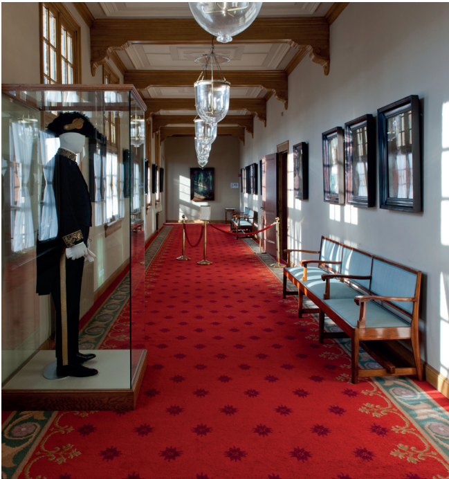
In de Amalia van Solmsgalerij in het gebouw van de Eerste Kamer zijn schilderijen en banken uit de rijkscollectie te vinden

de verdragen en kan onder andere cultuuroederen veiligstellen die onrechtmatig het grondgebied van een andere verdragspartij hebben verlaten.