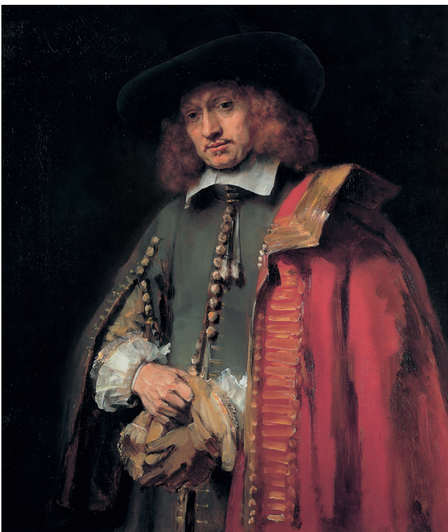
Een van de beschermde cultuurobjecten: het portret van Jan Six door Rembrandt

Musea en particuliere kopers in Nederland kunnen dankzij de Erfgoedwet in contact komen met een eigenaar die een beschermd