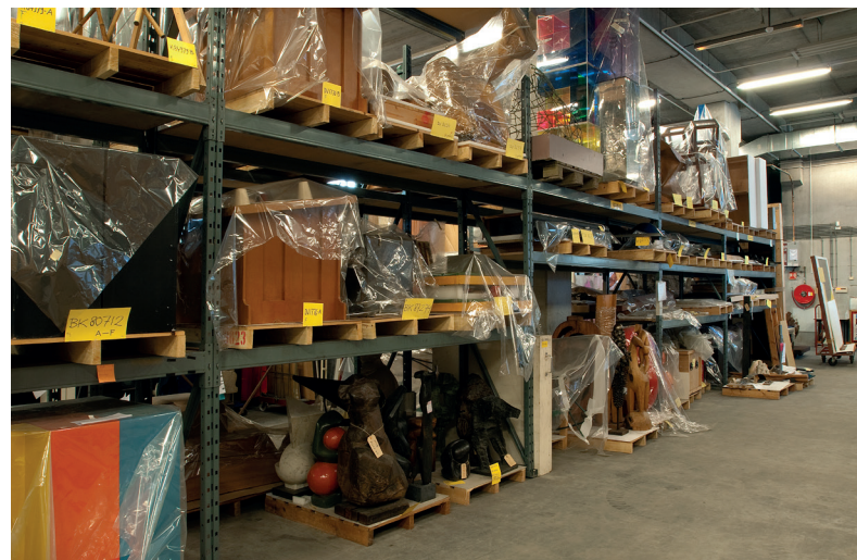
Goede huisvesting is belangrijk in de zorg voor roerend cultureel erfgoed

Een besluit waarmee een instelling wordt belast met de zorg voor het beheer bevat een omschrijving van de desbetreffende cultuuroederen. Als het daarbij om museale cultuuroederen van de Staat gaat, dan worden deze voor de periode waarop het besluit betrekking heeft automatisch in bruikleen gegeven aan de instelling met de beheertaak. Als het besluit cultuuroederen