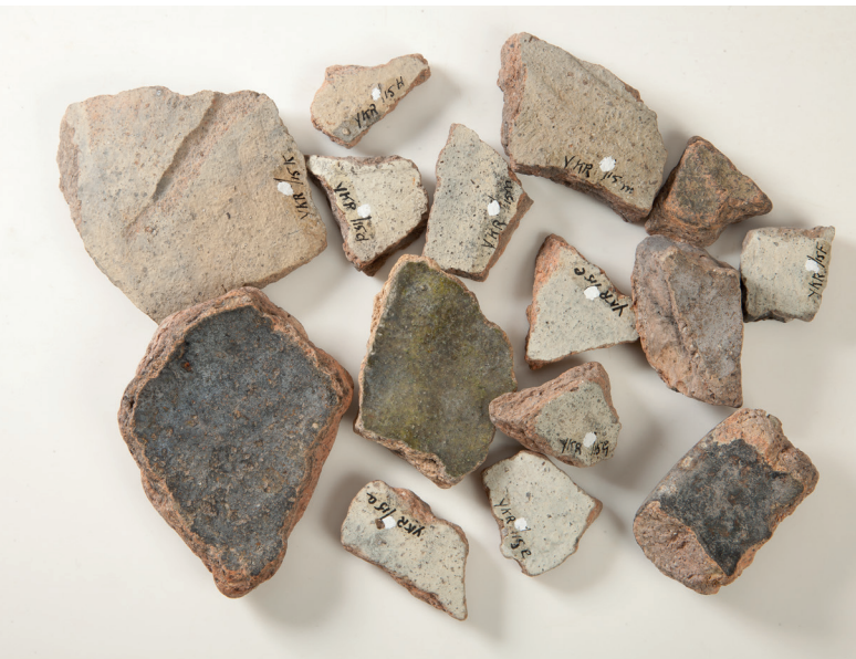
Bij afstoten kan het om alle type cultuurgoederen gaan

gevraagd. Het advies geeft een oordeel over de culturele waarde van het cultuurgoed en de betekenis ervan voor het Nederlandse cultuurbezit. Om tot een oordeel te komen kan gebruik worden gemaakt van de waarderingsmethodiek Op de museale weegschaal van de Rijksdienst voor het Cultureel Erfgoed. De Museumvereniging richt de Leidraad voor het afstoten van museale objecten zodanig in dat deze in overeenstemming is met de Erfgoedwet .