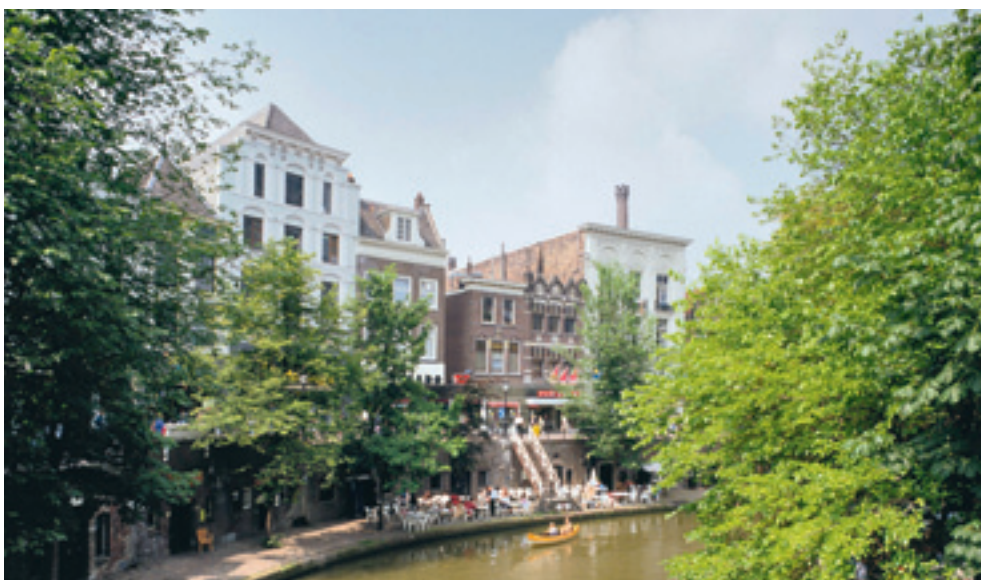
Zicht op de Utrechtse Oudegracht met de werfkelders, ter hoogte van nr. 119

Naast de inhoudelijke herpositionering van de erfgoedsector via de vele honderden Belvedere-projecten, streefde Belvedere naar twee inhoudelijk-organisatorische vernieuwingen, die kunnen worden aangeduid met de termen ‘interne -’ en ‘externe integratie’.