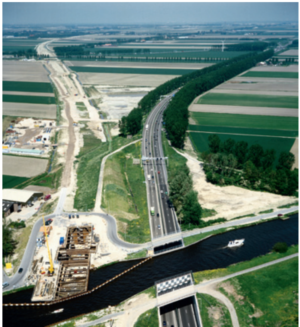
Aquaduct Hogesnelheidslijn in aanbouw, A4 Haarlemmermeer

Het tweede spoor was de cultuurpolitieke ambitie van de sociaaldemocratische staatssecretaris Rick van der Ploeg om kunst en cultuur – zowel die in de musea, onder de grond (archeologie) als in het open veld (monumenten) – op een toegankelijker en aantrekkelijker manier in beeld te brengen bij het bredere publiek. Deze ambitie, die doet denken aan soortgelijke politieke projecten in