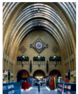
Interieur van de centrale hal van het postkantoor aan het Neude in Utrecht

Het mag duidelijk zijn: de toekomstige generatie erfgoedzorgers, planners en ontwerpers ziet zich geconfronteerd met meervoudigheid in de modificatie-, ontwerp- en beheerstrategieën voor erfgoed. Ze moeten in verander(en)de omstandigheden werken aan een van de belangrijkste opgaven van de komende periode: het opnieuw functie en betekenis geven aan het bestaande. Misschien nog veel sterker dan we beseften toen het in het leven werd geroepen, hebben we de ervaring van het Belvedere-programma de komende tijd nodig.