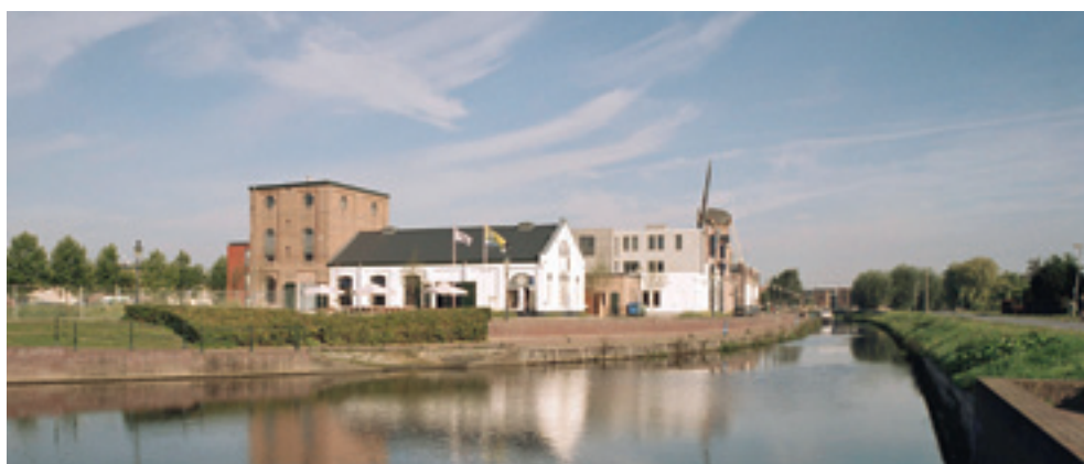
Overzicht van de gebouwen van de voormalige Zeepfabriek De Ster, Etten-Leur

De opvattingen van erfgoeddeskundigen en professionals werden uitgedaagd door zichzelf organiserende burgers. In feite was daarmee al een begin gemaakt in de context van de stadsvernieuwingsoperatie in de jaren zeventig, toen de monumentenzorg onderdeel werd van een brede maatschappelijke discussie over de toekomst van de stad. Begin jaren negentig stond maatschappelijke participatie wederom hoog op de politieke agenda, en streefde de overheid naar het zoveel mogelijk laten meedoen van burgers. De toegenomen betrokkenheid van het brede publiek bij erfgoed betekende bijvoorbeeld dat de aandacht verschoof van