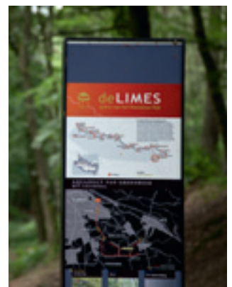
Informatiebord over de Limes in het Louisedal bij de Postweg, Berg en Dal

Belvedere heeft ontwerpers actief gestimuleerd om zich veel explicieter tot monumenten, historische gebouwen en cultuurlandschappen te verhouden. Ook de monumentenzorg veranderde: samenhang en ruimtelijke kwaliteit zijn naast de objectwaarde van de historische monumenten een factor van belang geworden. Het gevolg hiervan is dat het ontwerp ook voor de monumentenzorg belangrijker is geworden. De inzet beperkt zich niet langer tot behoud alleen, maar strekt zich uit tot een gewetensvolle en gepaste ontwikkeling. De door Belvedere gestimuleerde toenadering van de erfgoedzorg en ontwerpers heeft geresulteerd in een enorme variëteit van nieuwe, ruimtelijke symbioses van oud en nieuw (Labuhn en Luiten, 2012).