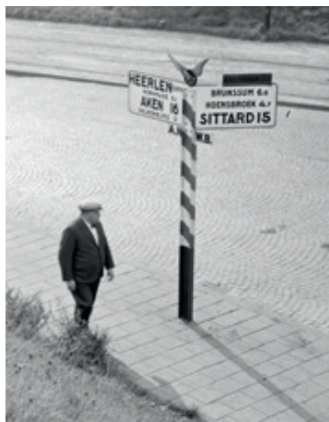
'De trouwe wegwijzer' in 1938, Heerlen

Allereerst was dat de grootschalige fysieke reconstructie van de Nederlandse topografie,