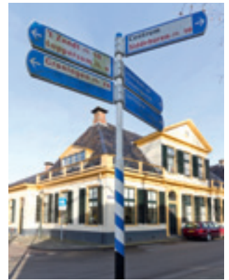
Beschermd stadsgezicht in Appingedam

Als gevolg van de institutionalisering, bureaucratisering en professionalisering van de erfgoedzorg had 'erfgoed' steeds minder betrekking op datgene wat particulieren dreef in hun zorg voor de kwaliteit van de leefomgeving. Erfgoed werd een aparte categorie van objecten en plekken die voornamelijk werden geassocieerd met verdwenen (of verdwijnende) culturele praktijken. Door selectie en wettelijke bescherming werd erfgoed voornamelijk gezien als contrastcategorie: het verleden was een 'lost world' die zich duidelijk aftekende tegen het heden. Gebouwen en landschappen met erfgoedwaarden werden als onvervreemdbaar goed geclassificeerd en via zorgvuldige procedures uit de maatschappelijke roulatie genomen. De (symbolische) creatie van erfgoed kwam in handen van professionals en werd een gespecialiseerde, door 'experts' gedomineerde activiteit; een activiteit die in toenemende mate vervlochten raakte met bureaucratische planningsprocedures. Dit zorgde voor een effectieve de-lokalisering van erfgoed om het onderdeel te maken van een nationale, staatsgedreven en geprofessionaliseerde praktijk.