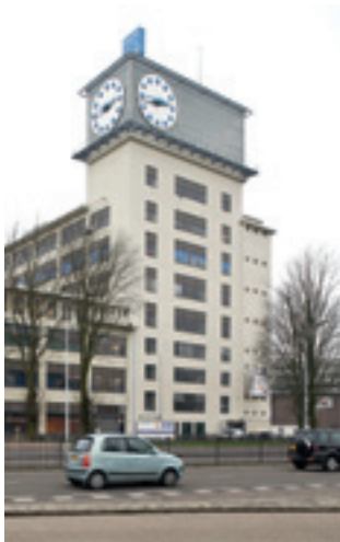
Strijp 5, het Klokgebouw, Eindhoven

betrokken bij het definiëren van de cultuurhistorische identiteit van een plek of gebouw. Daarbij kan gedacht worden aan verhalen ( oral history ), mythen en sagen en historische gebeurtenissen.