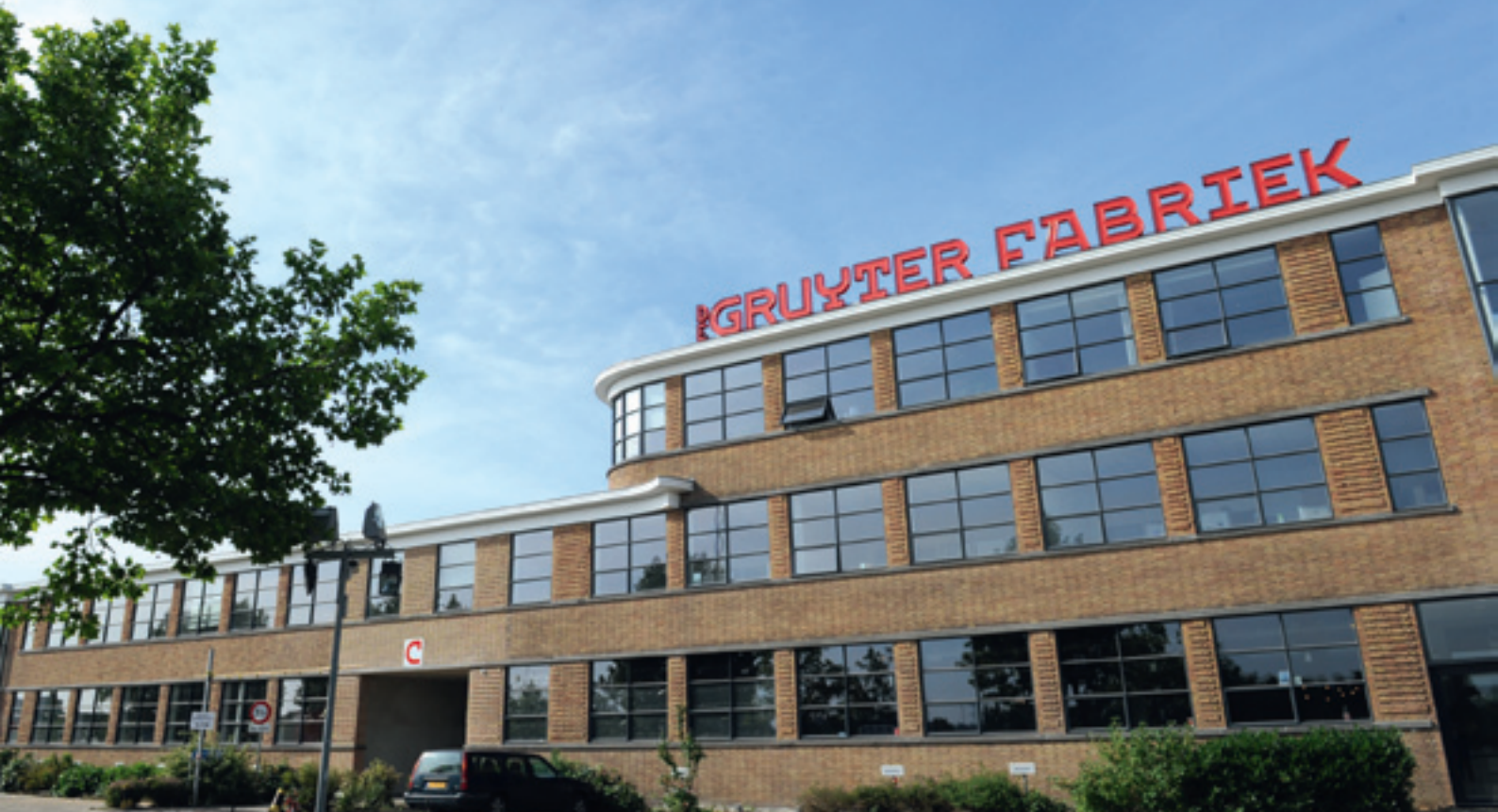
De Gruyterfabriek in Den Bosch, werkplek voor creatieve ondernemers

wikkeling van industrieel erfgoed rond thema's als toerisme, recreatie, woonkwaliteit, creatieve economie en ecologie. Het werd in 1999 voltooid en trekt jaarlijks meer dan een half miljoen bezoekers. In het Ruhrgebied werd met de instandhouding van het industrieel erfgoed niet enkel het verleden herdacht of gevierd, maar ook op betekenisvolle wijze richting gegeven aan de toekomst van de regio. Erfgoed werd niet langer vrijgespeeld uit de ruimtelijke dynamiek, maar benut als een vormende kracht voor regionale ontwikkeling.