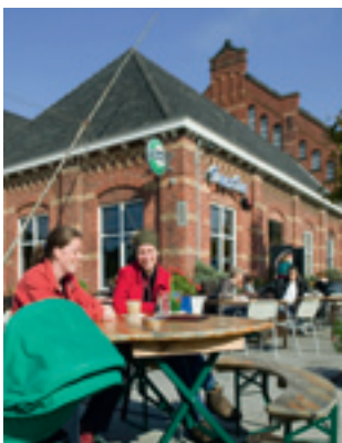
Recreatie op het terrein van de Westergasfabriek, Amsterdam

Daartoe bieden we eerst een beschrijving van een aantal dilemma's in de bescherming van het gebouwd en landschappelijk erfgoed die zich in de jaren negentig voordeden en die de aanleiding vormden voor een nieuwe aanpak van erfgoedopgaven. Vervolgens beschrijven en analyseren we de paradigmawisseling in het erfgoedbeheer die rond de eeuwwisseling plaatsvond en door het nationale Belvedere-programma beleidsmatig is ondersteund. Vervolgens gaan we na welke veranderingen het Belvedere-programma in zowel de planologische praktijk als de praktijk van de erfgoedzorg tot stand heeft gebracht. We besluiten met een korte vooruitblik: het huidige, post-Belvedere tijdperk brengt andere vraagstukken en dilemma's met zich mee, die in belangrijke mate het gevolg zijn van ingrijpende veranderingen in de ruimtelijke ordening, zowel bestuurlijk als inhoudelijk. De mogelijke consequenties van deze veranderingen voor de nieuwe generatie ontwerpers, planners en erfgoeddeskundigen worden kort aangestipt.