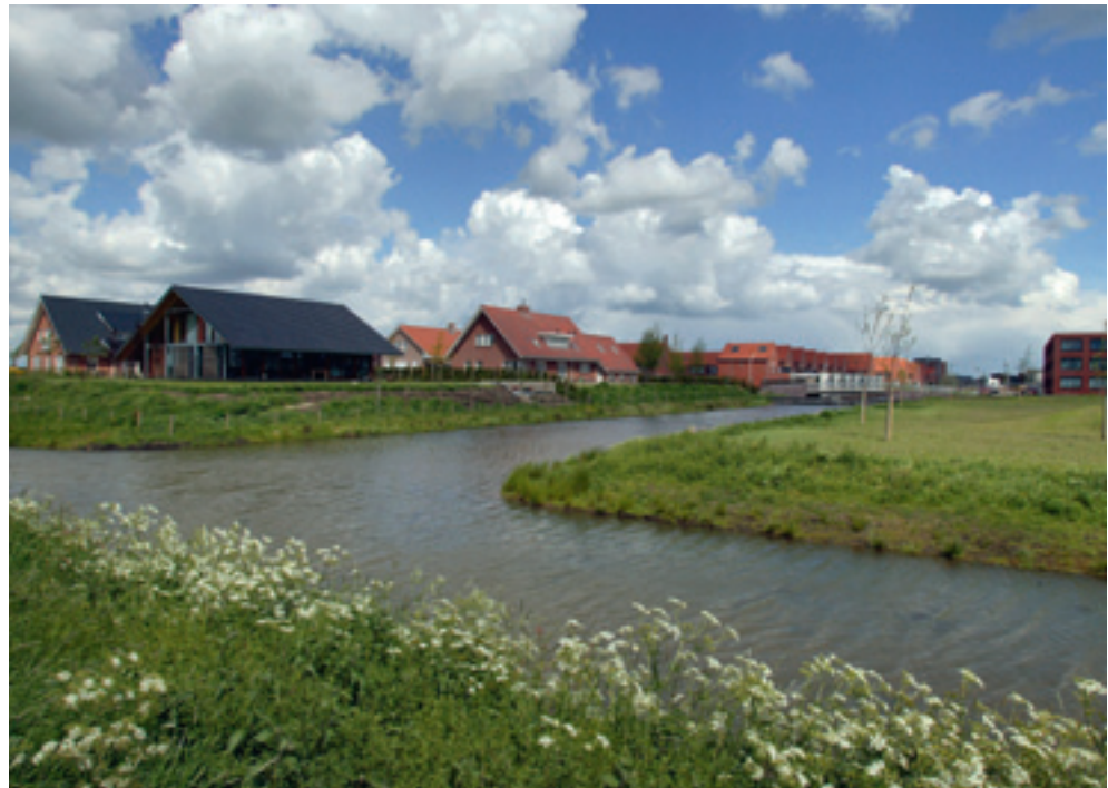
Vinexwijk in cultuurlandschap, Zwolle