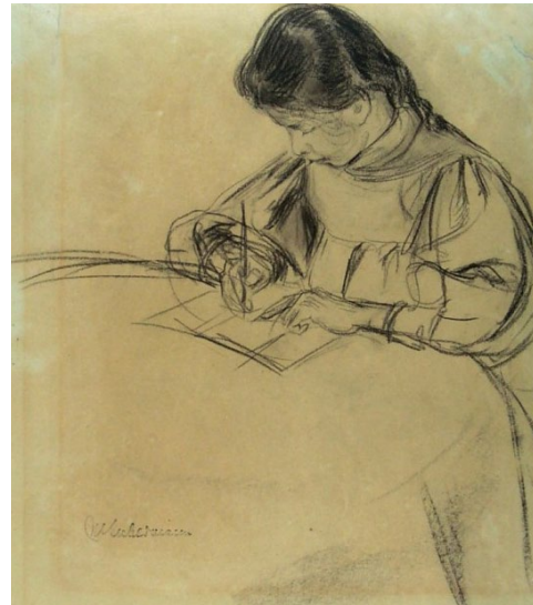
ילדה כותבת ליד שולחן, יצירה של מקס ליברמן.

הפרסום שהופיע לאחרונה "הדרכה לחקר המוצא של חפצי תרבות 1933-1945 (גם באנגלית)" נותן טיפים מעשיים לכל מי שחוקר את האוסף העצמי או לצורך רכישה.