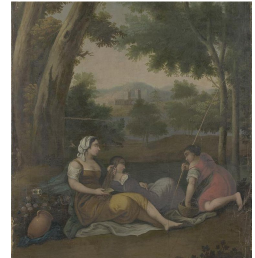
חלק נפרד מפאנל, שבעבר שימש כיסוי קיר, עם נוף פסטוראלי. צויר בקירוב בין 1750 ל-1800, NK3309.