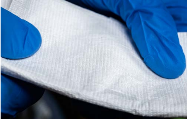
Voorbeeld van een stukje Tyvek®