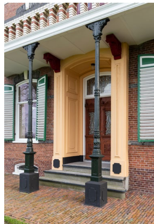
Aan de voorgevel van De Haver is de welvaart van de boer in bouwjaar 1894 af te lezen

het huis lopen via een tussendeel over in een forse schuur. Deze kop-hals-rompboerderijen zie je vooral in het westen en het noorden van de provincie staan. In het westen kom je ook de kop-rompboerderij tegen, dus zonder hals. En kenmerkend voor het oosten van Groningen is de Oldambtster boerderij. Bij Oldambtster boerderijen loopt de nok van het huis door in die van de schuur. Huis en schuur zijn dus even hoog. Bovendien springt de schuur aan beide zijkanten uit. Maar steeds minder vaak worden deze monumenten gebruikt waarvoor ze gebouwd zijn. Groningen