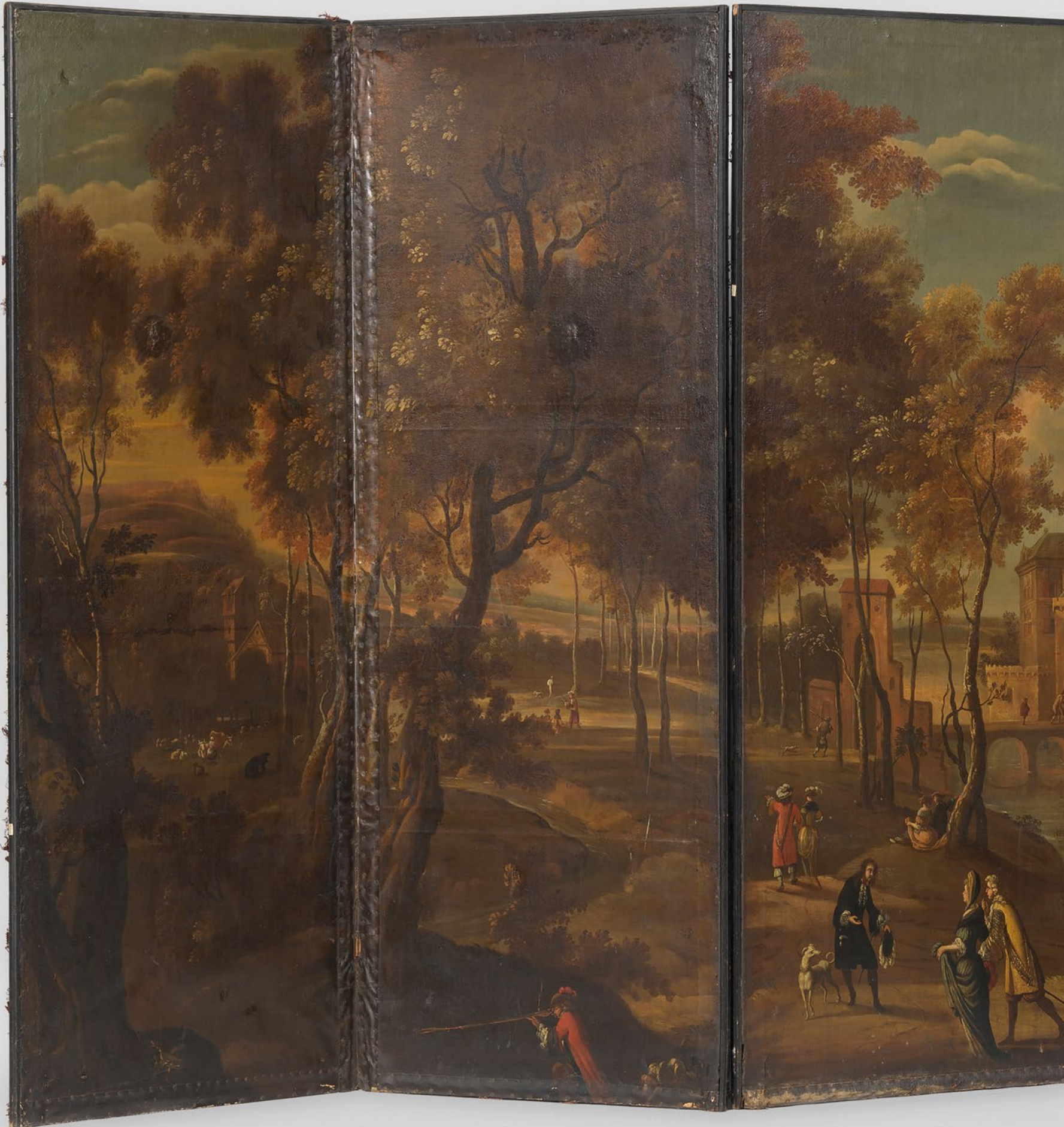
Het scherm voor de restauratie