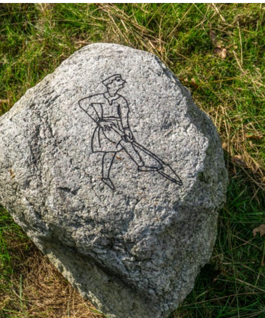
De initiatiefnemers hebben getekende middeleeuwen in de stenen laten graveren