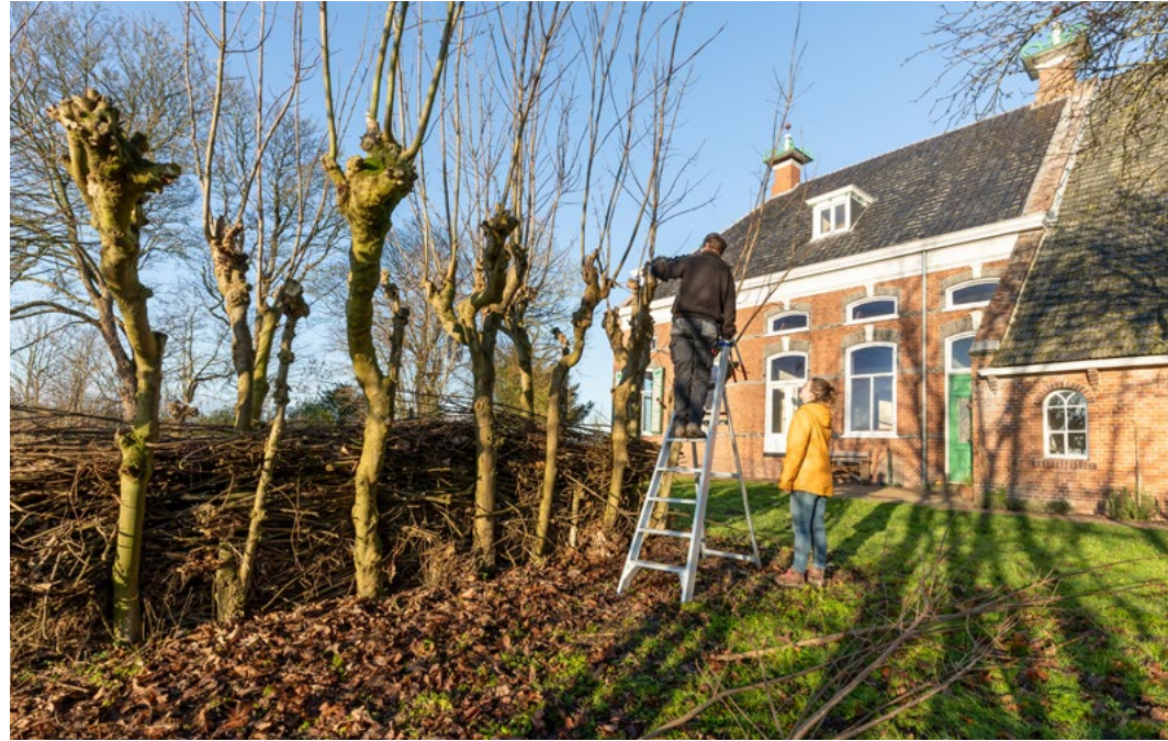
Op boerderij De Haver valt voor mensen met hersenletsel altijd nuttig werk te verrichten

'Boerderijen als deze zijn een onlosmakelijk onderdeel van de ziel van het Groninger landschap. Dit is een buitengewoon functioneel gebied, dat door mensenhanden is ontstaan. Denk aan de molens om water mee weg te pompen, de dijken om ons te beschermen en de boerderijen om het land te bewerken.' Dat geldt ook voor de tweede kop-halsrompboerderij die Het Groninger Landschap nu verbouwt, Plaats Melkema uit de zestiende eeuw, bij het dorp Huizinge. Glastra kijkt naar de gracht die het rijksmonument omringt. 'Op deze gracht hebben de inwoners van Huizinge leren schaatsen. En veel Groningers kennen Plaats Melkema uit de tijd dat ze als partycentrum dienstdeed. De betonnen vloeren in de schuren herinneren daar nog aan.'