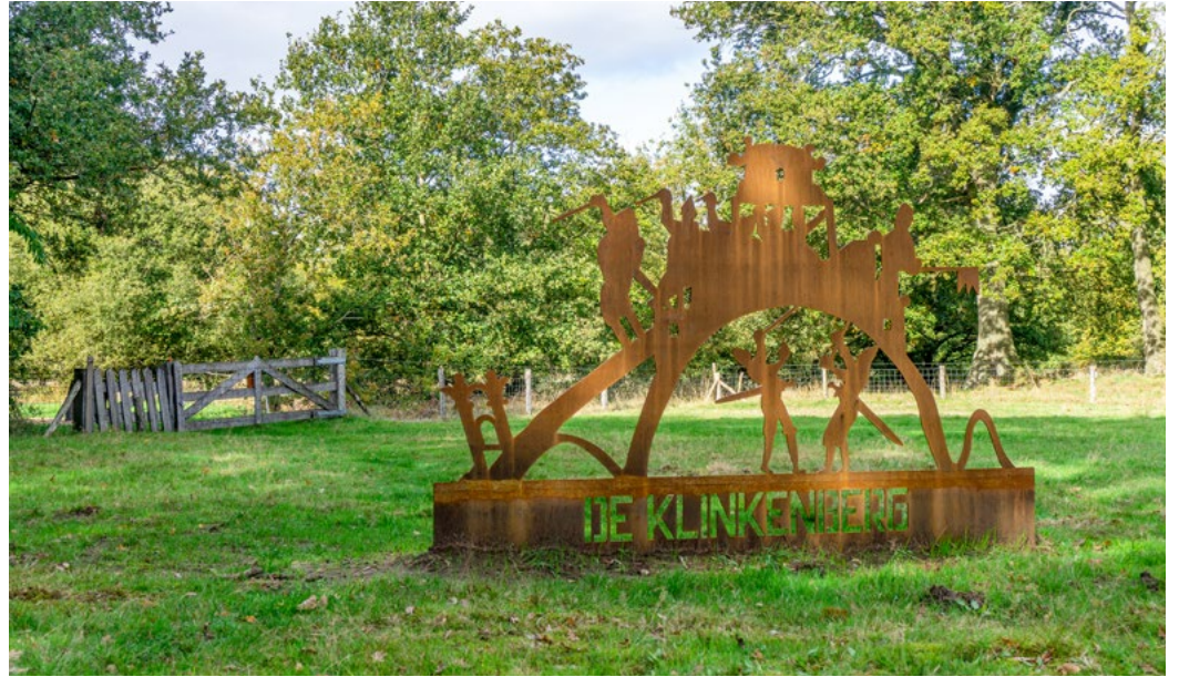
De Klinkenberg is nu voorzien van onder meer een uit cortenstaal gezaagde belegering