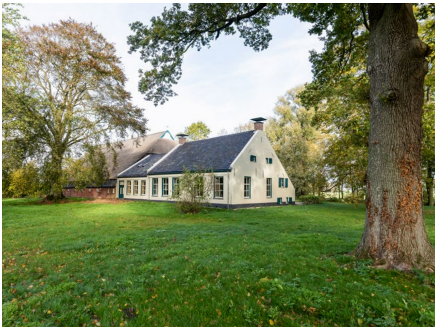
Plaats Melkema is een kop-hals-rompboerderij met een sober vormgegeven huisgedeelte