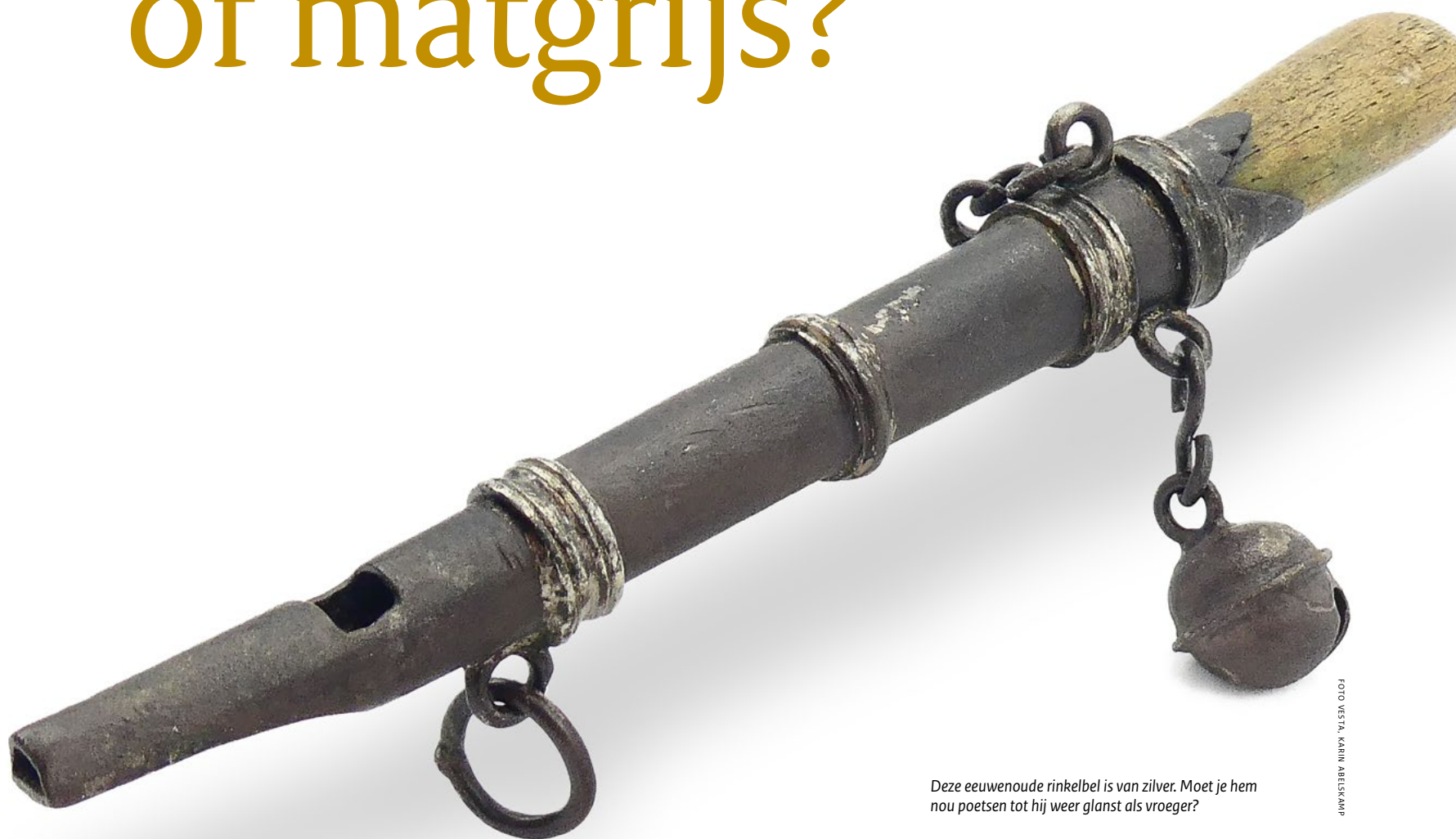
Deze eeuwenoude rinkelbel is van zilver. Moet je hem nou poetsen tot hij weer glanst als vroeger?