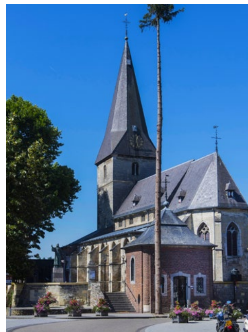
De Sint-Brigidakerk van Noorbeek is in de dertiende eeuw in romaanse stijl gebouwd