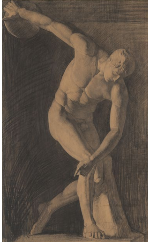
Met onder meer deze krijttekening werd Cobra Ritsema tot de Schildersklasse toegelaten

van een passende lijst was voorzien had het Singer-museum wel belangstelling. Hieruit blijkt dat het verhaal van een kunstwerk van groot belang is voor de interesse van musea om het te lenen.