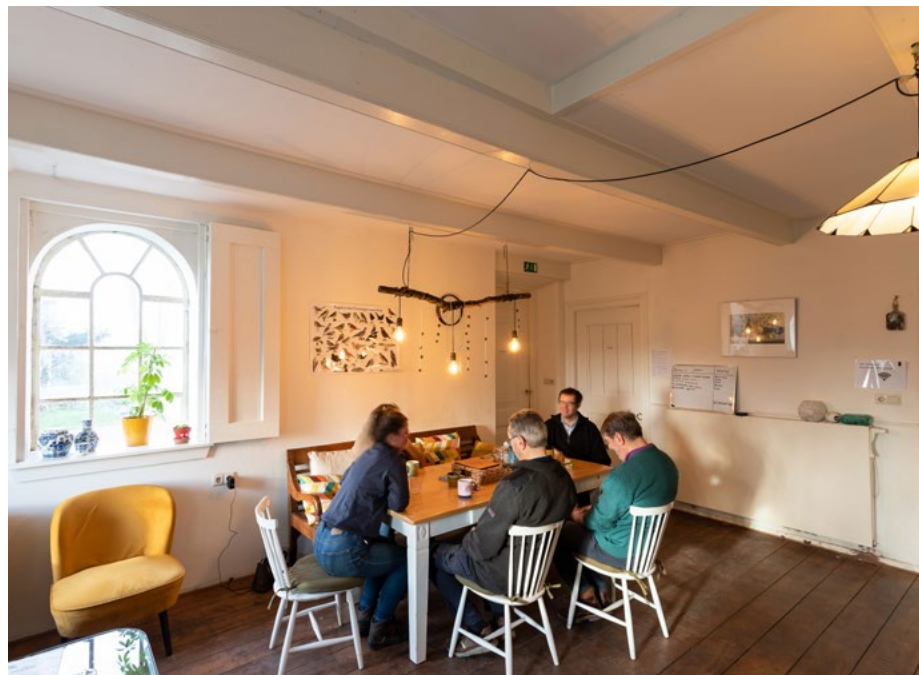
Pauze voor de mensen met dementie en hersenletsel in de schuur van De Haver

zijn kunstwerkjes op zich. Dat geldt ook voor allerlei onderdelen van De Haver.' Directeur Glastra legt uit: 'De voorganger van De Haver is destijds helaas afgebrand, maar daarvoor in de plaats kwam een superde-luxe boerderij, met een van de chicste schuren die je kunt hebben. Het was in die tijd, aan het eind van de negentiende eeuw, ook wel een beetje opscheppen. Met hun boerderij en tuin wilden deze herenboeren laten zien dat ze rijk waren. Ook de opvallende plaats aan een weg speelde daarin een belangrijke rol.'