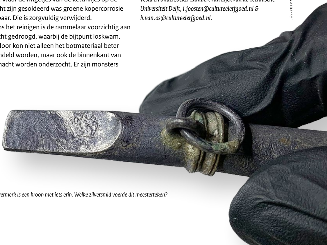
Het zilvermerk is een kroon met iets erin. Welke zilversmid voerde dit meesterteken?