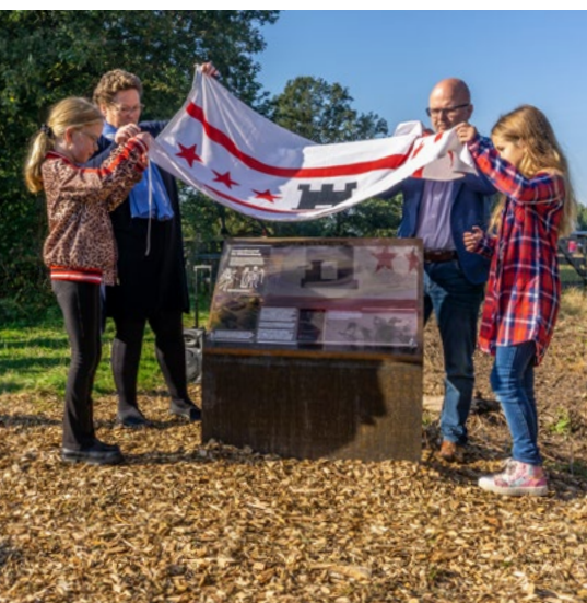
Een nieuw paneel biedt geactualiseerde informatie over de heuvels en het kasteel

punt eruit zien? Welk ontwerpbureau kies je en welk ontwerp? En waar komt het geld vandaan om het te financieren? De informatievoorziening op het