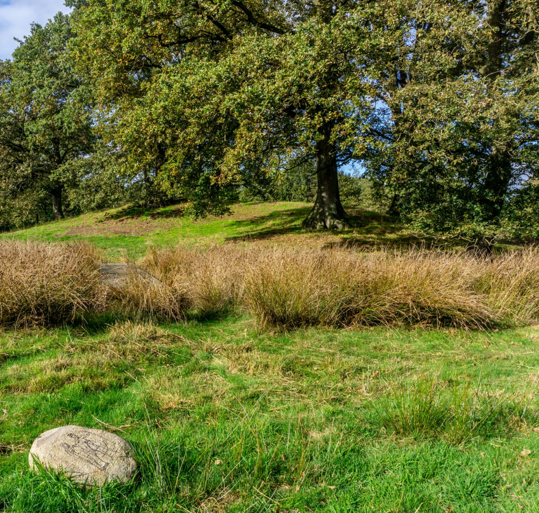
Kasteelterrein de Klinkenberg, met een bruggetje over de verlande gracht. Op de voorgrond ligt een van de stenen die er een 'archeologisch beleefpunt' van maken