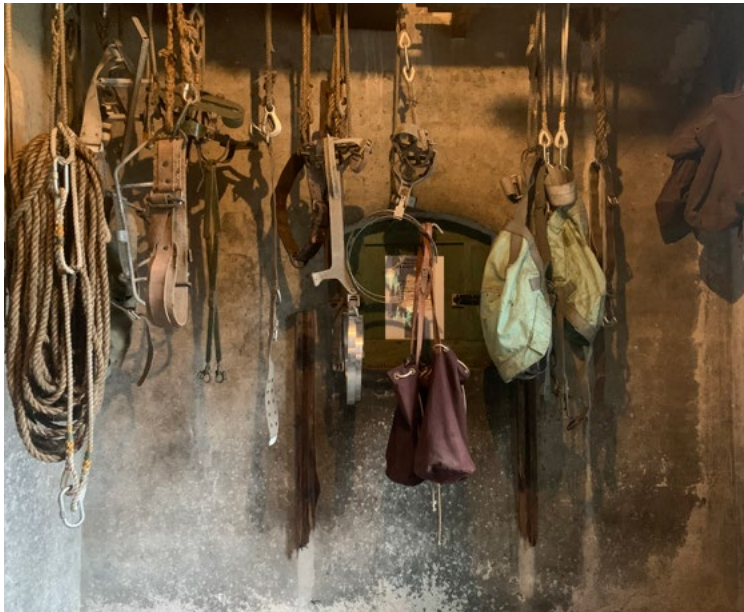
De Rijkszaadeest uit 1913 bevat allerlei gereedschap om zaden uit dennenappels te halen