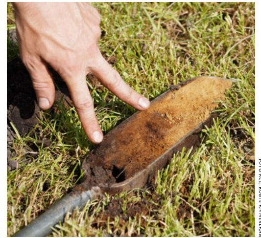
Met een grondboor zien de onderzoekers dat het weiland met pluggen opgehoogd is

bleef het klooster er de eigenaar van. Op archiefmateriaal uit de late middeleeuwen staat het terrein bij Nijkerk, inclusief het hakhoutbosje ernaast, genoemd als het Heinenland. Het is zeker dat hier vanaf 1800 aardappels hebben gestaan, die via overzeese handel in Nederland waren beland. Voor de periode daarvoor is het interessant dat vanaf 1630 in de omgeving van Nijkerk de tabaksteelt opkwam. Deze planten kwamen mee