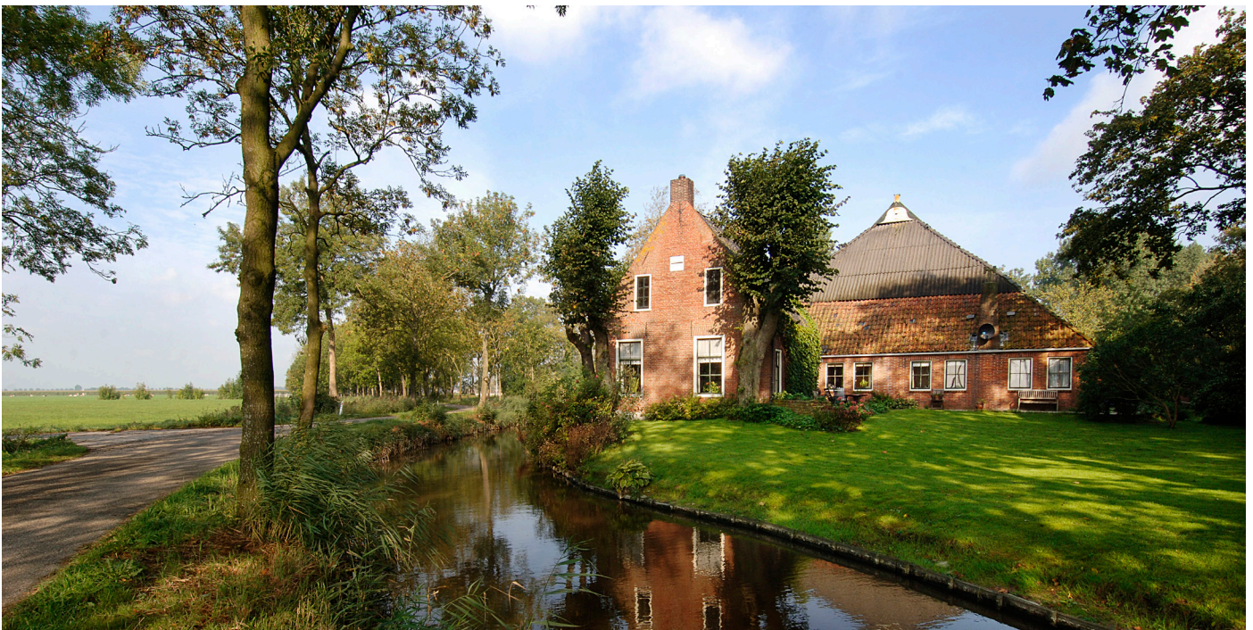
Hoeve Abbeweer, Baflo.

In het Nederlandse landschap staan boerderijen in kenmerkende patronen. Zo staan boerderijen in het laagveengebied op de kop van een smalle kavel met smalle sloten, in de vorm van een (historisch) lint. Op de zandgronden zijn de kavels vaak blokvormig en onregelmatig, waarbij de perceelsgrens van oudsher bestond uit een aarden wal met hakhout. De gebouwen zijn meer over het erf verspreid. En in het rivierengebied is een duidelijk verschil tussen landbouw op de oeverwal (veelal fruitteelt) en de lage polders erachter (lange smalle kavels, gebouwen achter elkaar gesitueerd).