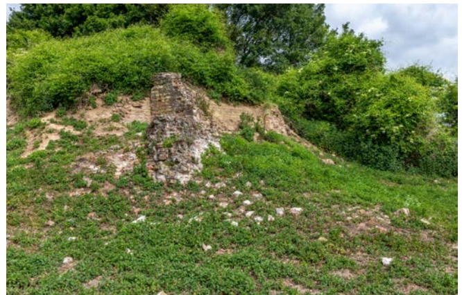
Figuren 3 en 4: de kasteelruïne vanuit het zuidoosten gezien. De overwoekering en het afbrokkelen van muurwerk is goed te zien. In toenemende mate ontstaan er puinwaaiers aan de voet van muren.