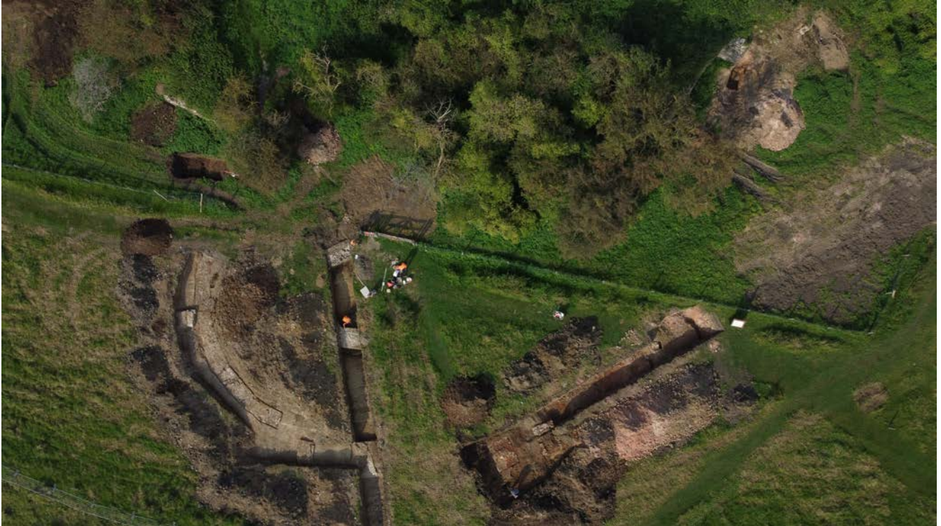
Figuur 5: archeologisch onderzoek, deels onmiddellijk grenzend aan zichtbare delen van de ruïne.