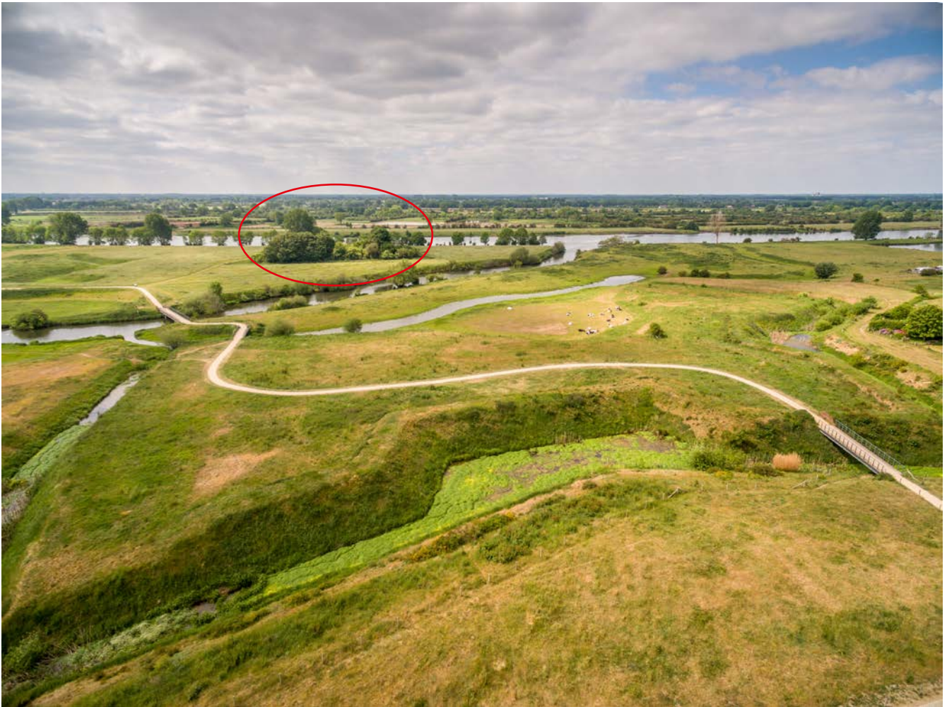
Figuur 2: de ruïne van het Genneperhuis (verscholen in de boschsage tussen Maas en Niers) wordt omgeven door omvangrijke verdedigingswerken van na de middeleeuwen.