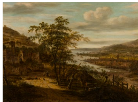
Rivierlandschap met ruïne en stad in de verte, ca. 1700, geschilderd door Dionys Verburg, NK2395. Momenteel wordt de herkomst van het schilderij onderzocht. Het wacht nog op teruggave.