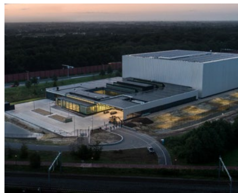
CollectieCentrum Nederland (CC NL) in Amersfoort

Bekijk hun verhaal in de video Restitutie in beeld of lees het advies .