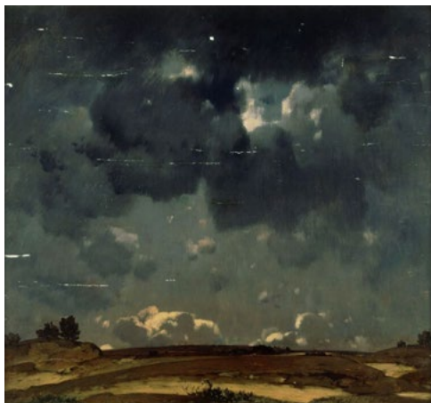
Landschap, geschilderd door A.H. von Stadler NK3278

In 2017 werd een familiearchief afgeleverd bij de balie van het Joods Museum in Amsterdam.