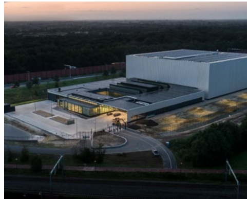
מרכז אוסף הולנד (CCNL) באמספורט (Amersfoort)