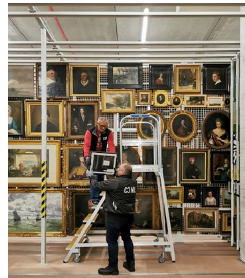
עובדים במחסן אוסף נכסי האמנות ההולנדית

אוסף נכסי האמנות ההולנדית באינטרנט מאז 2021, הסוכנות הממשלתית למורשת תרבות של הולנד אוספת ומגיישה את כל המידע הזמין על חפצים מאוסף נכסי האמנות ההולנדית דרך wo2.collectienederland.nl . בפורטל זה תמצאו מידע על המאפיינים, מצב ההשבה ומקורם של חפצים אלו הנמצאים כעת בשליטת הממשלה. כאן תמצאו גם חפצי תרבות מאוסף נכסי האמנות ההולנדית שהוחזרו מאז שנת 2000. נתונים אלו לקוחים ממאגרי המידע של "הסוכנות הממשלתית למורשת התרבות" של הולנד Rijksdienst voor het Cultureel Erfgoed - (RCE) Restitutiecommissie - "מ"ועדת ההחזרה" - לשעבר - ומ"המשרד לחיפוש המוצא" לשעבר Bureau Herkomst Gezocht , בשנים הקרובות, הסוכנות הממשלתית תמשיך להרחיב ולשפר את הנתונים בפורטל זה.