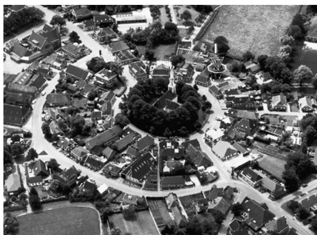
Ook (oude) luchtfoto's kunnen inzicht verschaffen over de inrichting van landschap of stad. Hier zien we de opbouw van Spijk, Delfzijl, gefotografeerd door Monumenten in Nederland Groningen, datum onbekend.