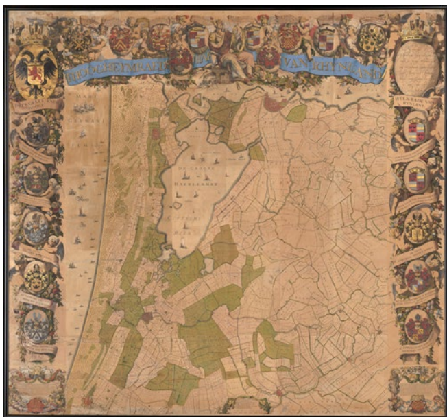
Kaart van het Hoogheemraadschap Rijnland, 1647.