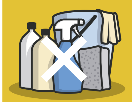
Schoonmaakmiddelen, poets- of glansmiddelen en geprepareerde doekjes mogen niet worden gebruikt.