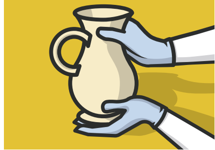
Pak voorwerpen nooit met blote handen vast en gebruik altijd 2 handen: 1 hand om het voorwerp vast te houden en 1 hand ter ondersteuning.