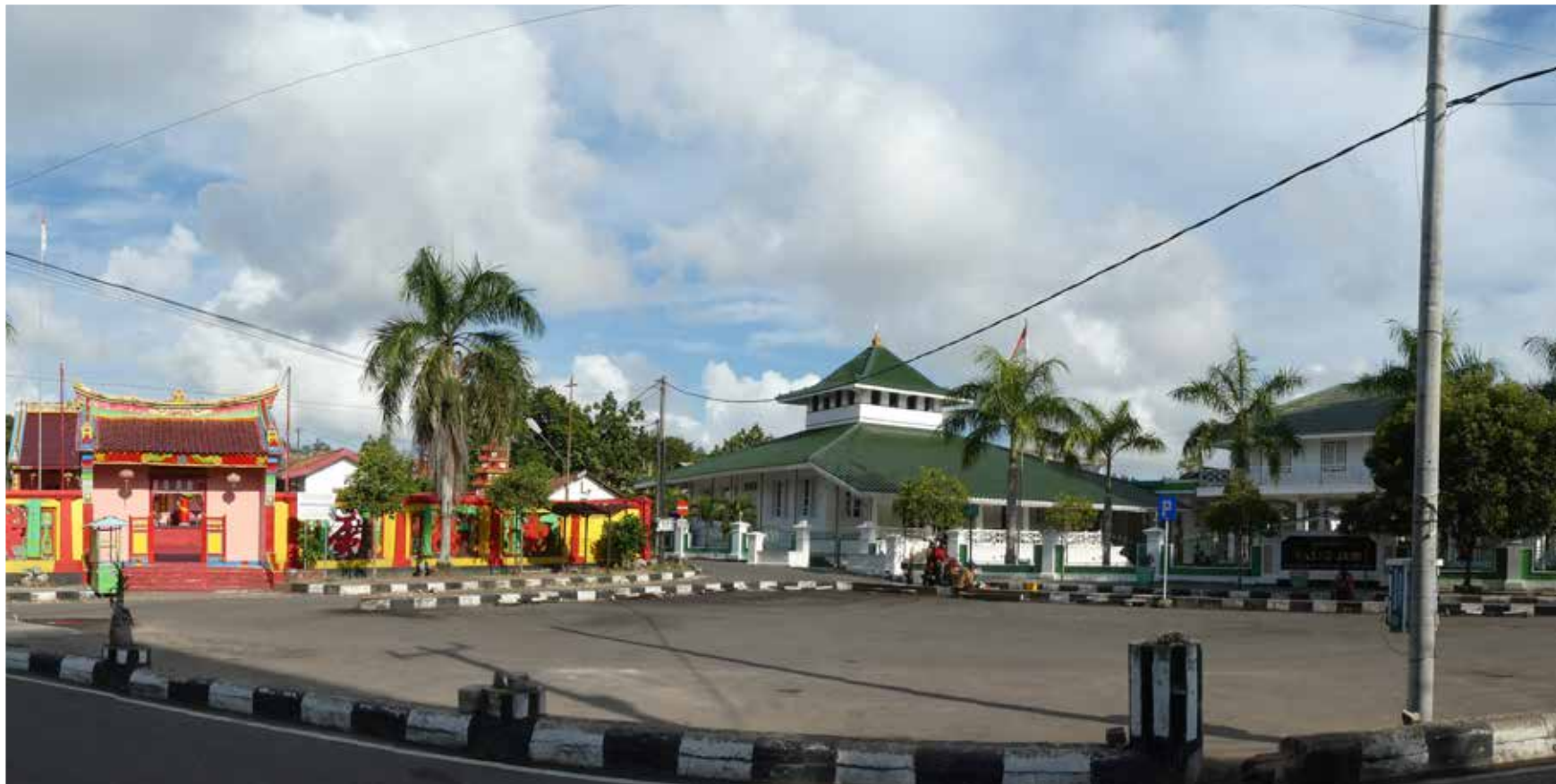
EEN CHINESE TEMPEL (LINKS) EN EEN MOSKEE (RECHTS) DELEN EEN PLEIN IN MUNTOK.

TEKST: PETER TIMMER EN JACQUELINE ROSBERGEN