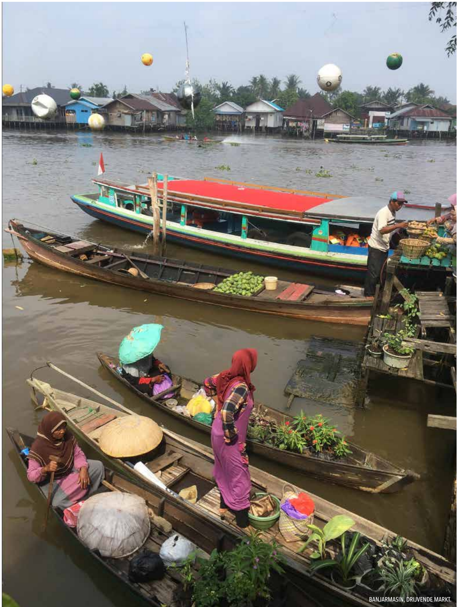
BANJARMASIN, DRIJVENDE MARKT.