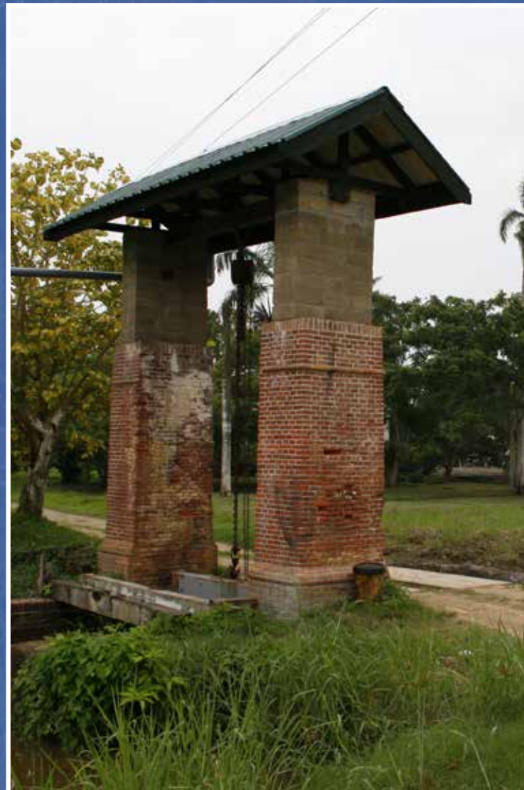
PLANTAGESLUIS COMMEWIJNE 1 (FOTO ROYTJIN).