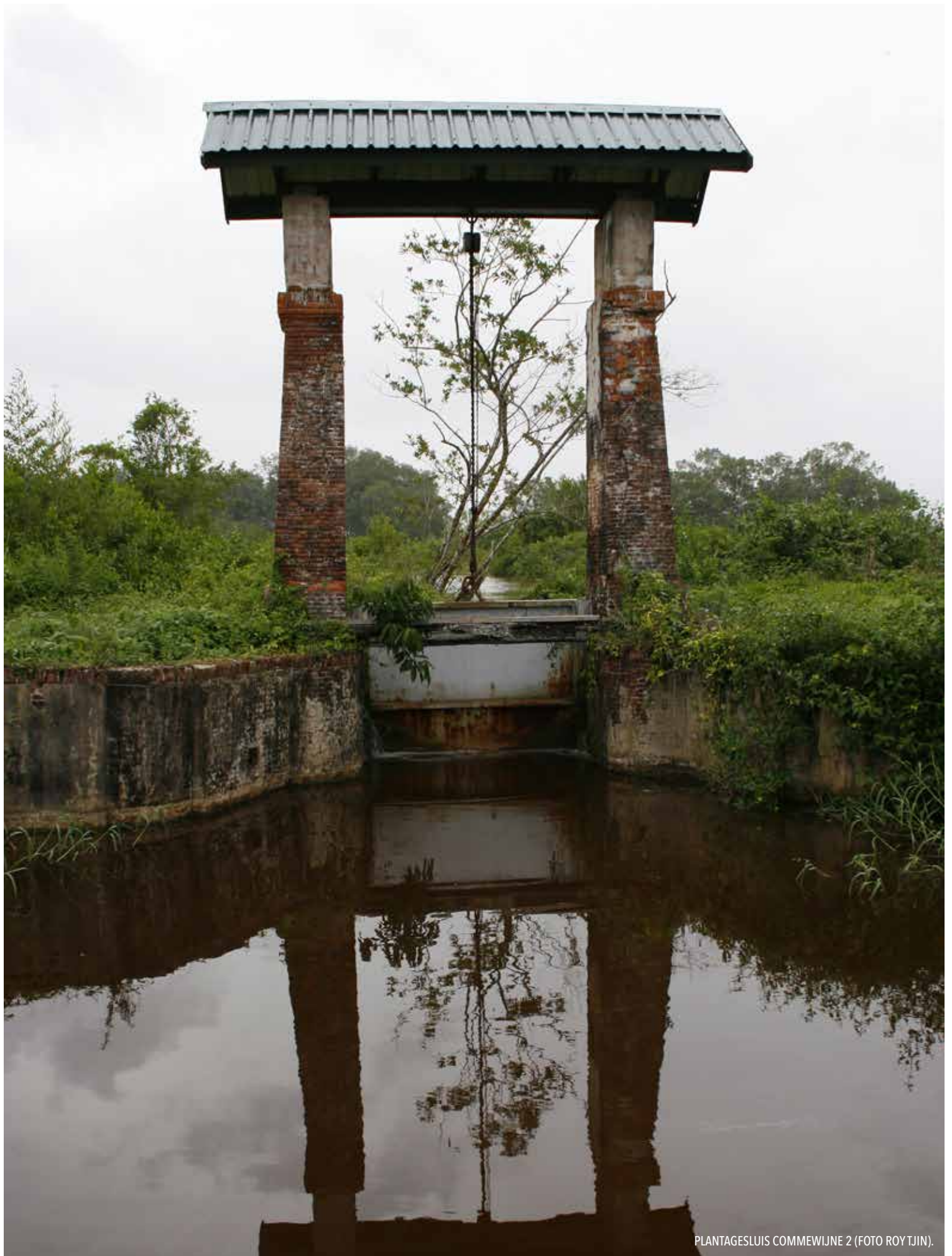
PLANTAGESLUIS COMMEWIJNE 2.