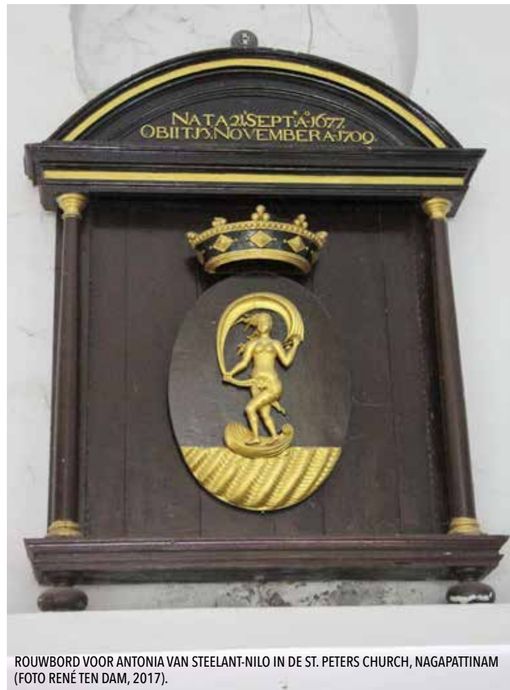
ROUWBORD VOOR ANTONIA VAN STEELANT-NILO IN DE ST. PETERS CHURCH, NAGAPATTINAM.