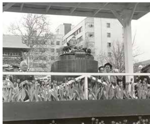
KONINGIN JULIANA SPREEKT BIJ DE AANBIEDING VAN HET KLEINSTE KLOKJE VAN HET NETHERLANDS CARILLON.