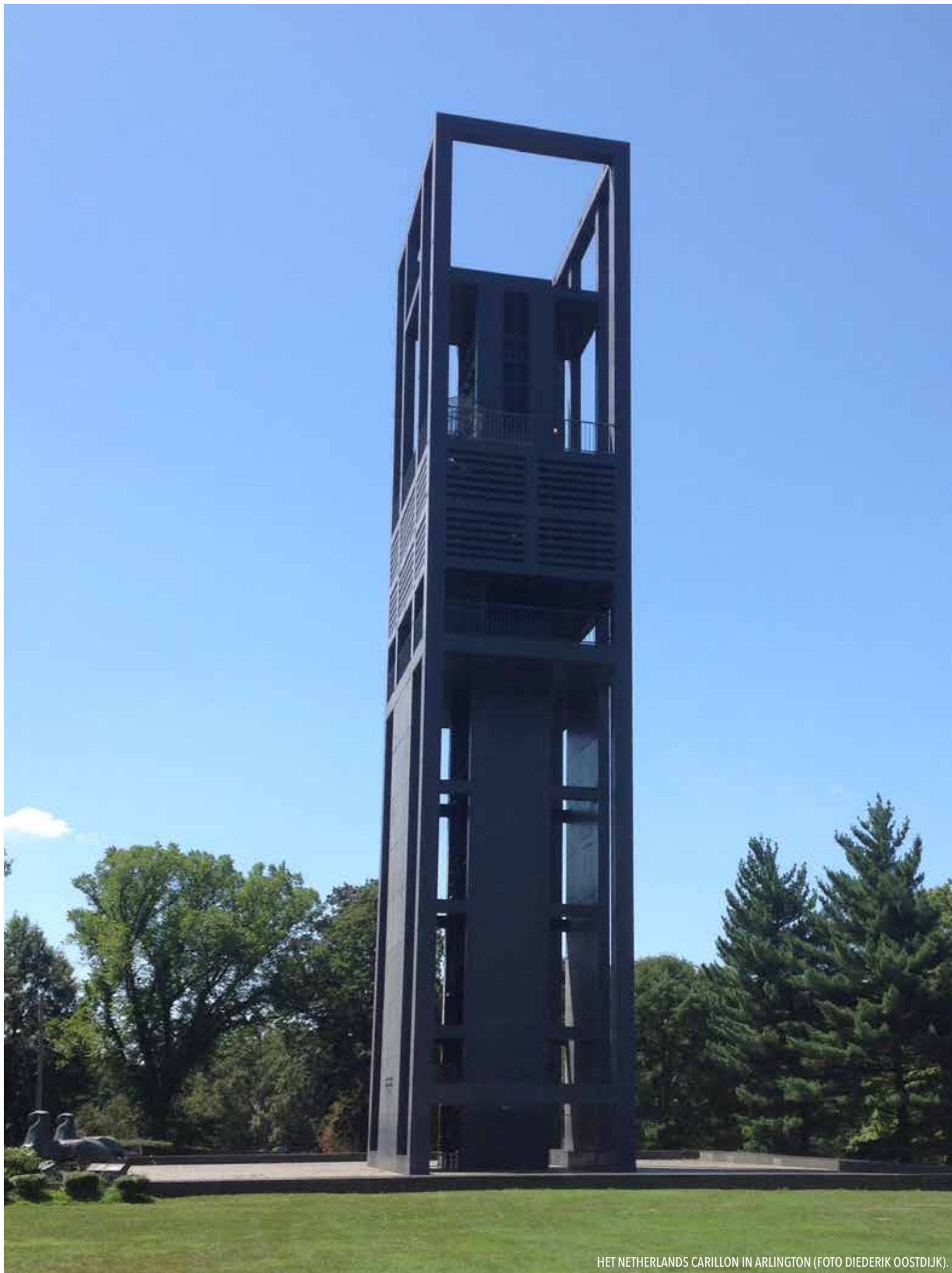
HET NETHERLANDS CARILLON IN ARLINGTON.