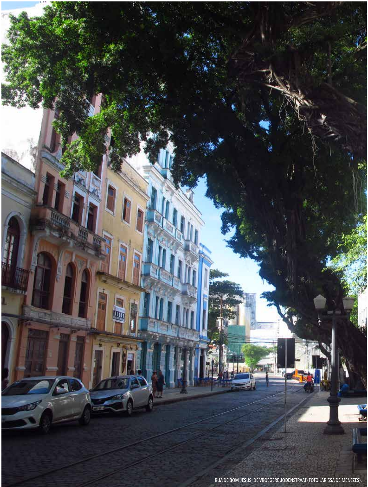
RUA DE BOM JESUS, DE VROEGERE JODENSTRAAT.