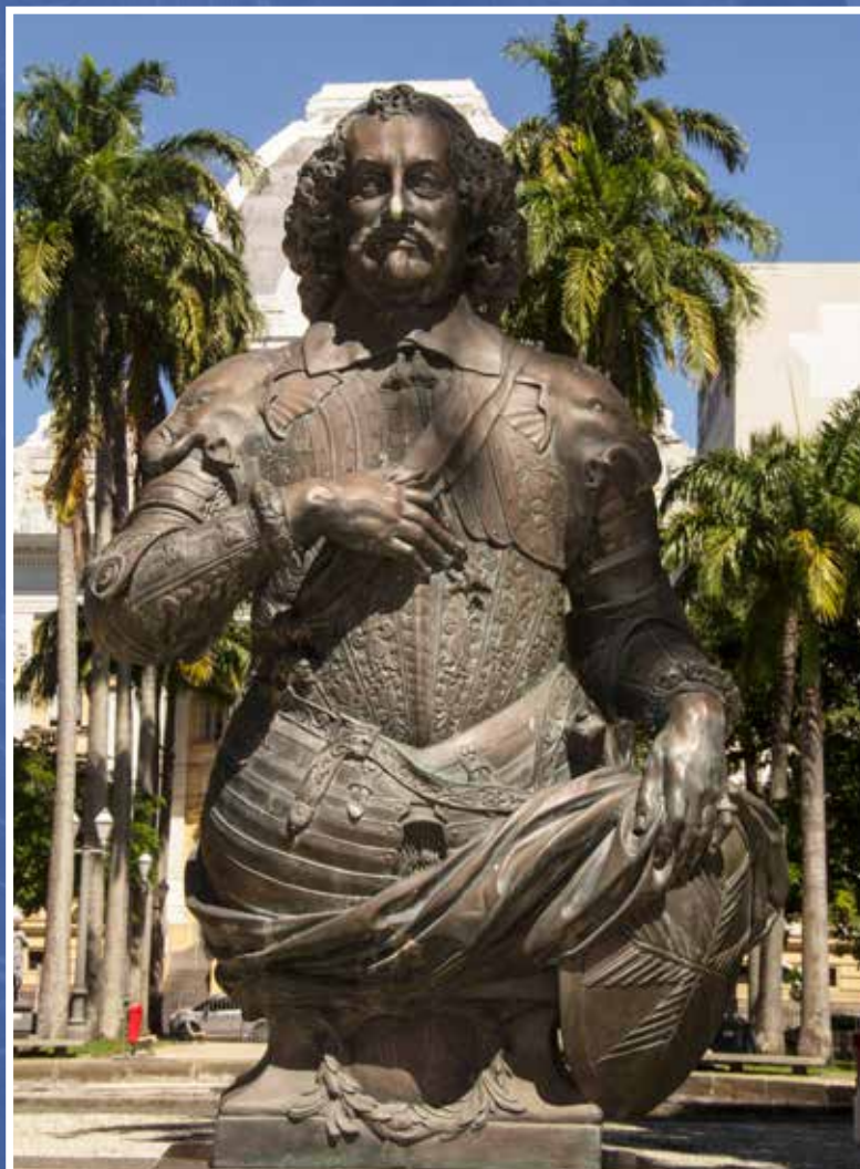
'PRINS' JOHAN MAURITS KIJKT UIT OVER HET PRAÇA DA REPÚBLICA.