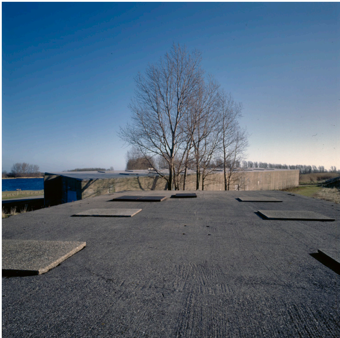
Vier caissons, afkomstig van de dijkdichting na de stormramp 1953 in Ouwerkerk