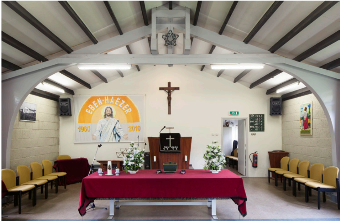
De Molukse Kerk Eben Haezer in Appingedam