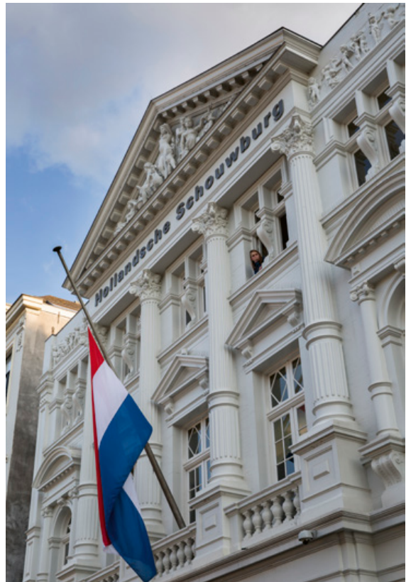
Hollandsche Schouwburg Amsterdam

Alle respondenten, op een enkeling na, noemen een bij het door hen genoemde thema behorende plaats of specifieke locatie. Deze zijn aan de ene kant algemeen van aard: de eigen gemeente, stadcentra, bunkers, forten, begraafplaatsen. En daarnaast een hele lijst met specifieke plekken, zoals Westerbork, kamp Amersfoort, Muur van Mussert, Hollandsche Schouwburg, Bevrijdingsbos Groningen, Plein 40-45 en Lloydkade in Rotterdam, Kapittelzaal Universiteit Utrecht, Schokland,