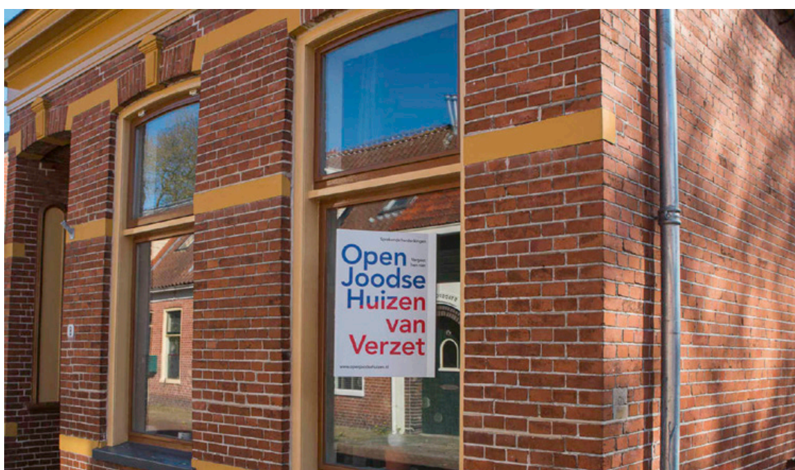
Open Joodse Huizen is een programma van kleinschalige, particuliere herdenkingsbijeenkomsten

Algemene conclusie bij dit onderdeel is dat vrijwel iedereen de meerwaarde van historische plekken, gebouwen en objecten voor het herinneren en herdenken van gebeurtenissen en personen erkent. En dat hier extra aandacht voor nodig is. Monumenten moeten actief worden beschermd. Met aanwijzing tot monument is het fysiek behoud te regelen. Maar voor kennisontwikkeling en educatie, het publiek en fysiek toegankelijk maken en het vertellen van verhalen bij historische plekken is er meer nodig. Dit blijkt uit de gewenste extra aandacht, waarvoor diverse suggesties zijn gedaan.