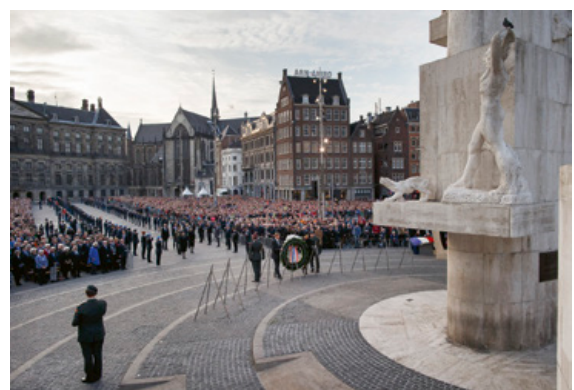
4 mei herdenking oorlogsslachtoffers bij monument op de Dam

Een kwart van de respondenten was het eens met de stelling dat de overheid zich terughoudend moet opstellen en ongeveer 23% was neutraal. Vaak wordt gewezen op een gezamenlijke inspanning: de overheid faciliteert initiatieven vanuit de samenleving. "Het mooie van herdenken is dat het vaak van onderop begint. De overheid dient wel de kaders te bewaken waarbinnen dit gebeurt en/of te faciliteren dat het kan gebeuren. Eigenlijk een dienende rol." Andere rollen van de overheid zijn die van scheidsrechter, controleur en stimulator. Stimuleren is hier vooral bedoeld als reageren op wensen van burgers. "De overheid moet tegemoetkomen aan nieuwe behoeften tot herinneren en herdenken vanuit de samenleving." Dus ook als mensen het eens zijn met de stelling dat de overheid zich terughoudend moet opstellen, dan nog zien zij de overheid als belangrijke actor. "De behoefte aan herdenken moet wel uit de samenleving komen, maar vanzelf gaat het niet." En: "Terughoudendheid van de overheid betekent niet afzijdigheid!"