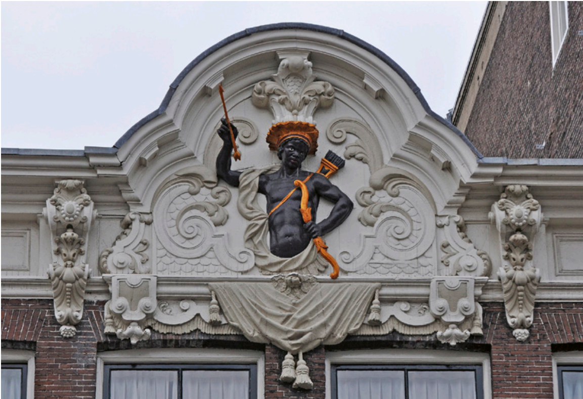
Geveltop op het Rokin in Amsterdam