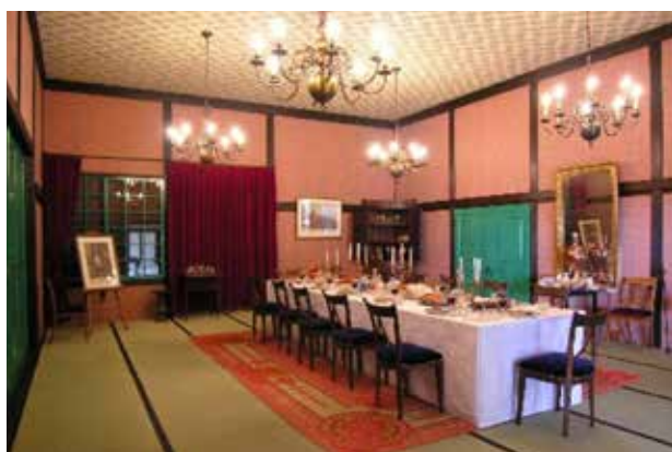
HERBOUWDE KAMER VAN HET OPPERHOOFD IN DEJIMA, JAPAN.

Op het ogenblik is Galle de enige stad in Sri Lanka die vertegenwoordigd is in het netwerk. Nadat zij Galle op de Portugezen veroverd had, bouwde de VOC de stad in honderd jaar uit tot een vestingstad met veertien bastions. De binnenstad is zeer goed bewaard gebleven en er zijn kerken, pakhuisen, kantoren, huizen, barakken en zelfs rioeringssystemen uit de