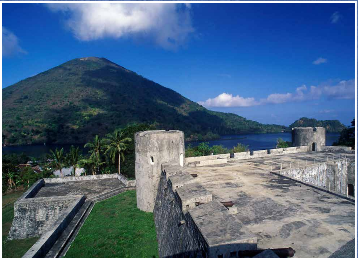
FORT BELGICA IN BANDA, INDONESIË.