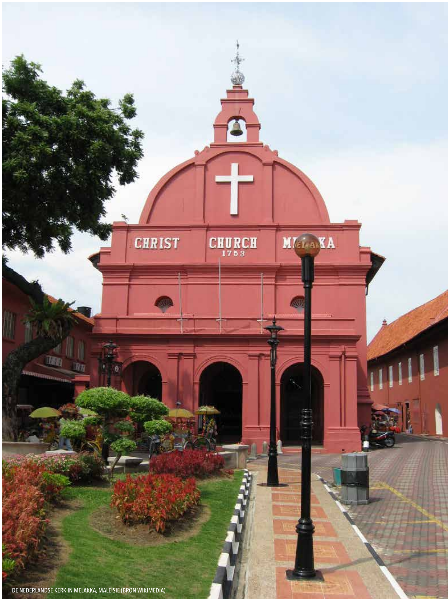
DE NEDERLANDSE KERK IN MELAKKA, MALEISIË.