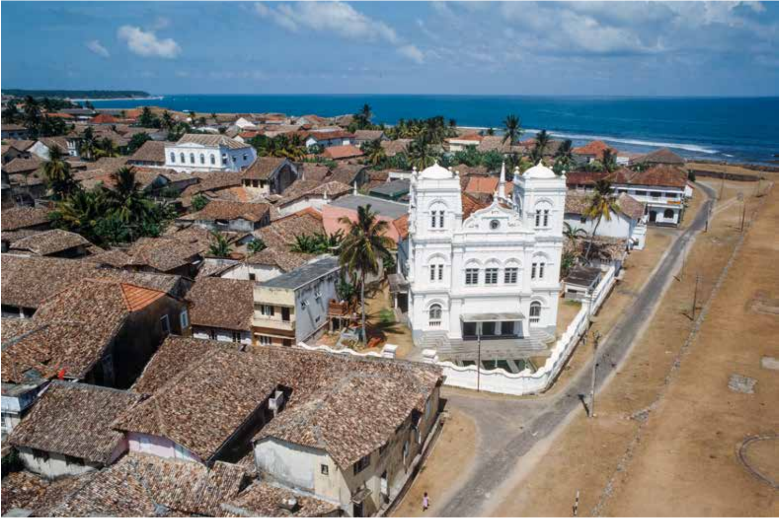
GEZICHT OP DE STAD BINNEN FORT GALLE, SRI LANKA.

De VOC, in 1602 in Nederland opgericht, groeide in korte tijd uit tot een van de belangrijkste ondernemingen ter wereld. Dat ging niet zonder slag of stoot. In Azië werden de Spanjaarden en Portugezen verdreven uit hun strategisch gelegen forten, die de VOC overnam en uitbouwde. In 1619 werd de stad Jayakarta, op het Indonesische eiland Java, verwoest en herbouwd als Batavia. De plaats werd niet alleen een belangrijk centrum voor de handel tussen Europa en Azië, maar ook voor de handel binnen Azië.