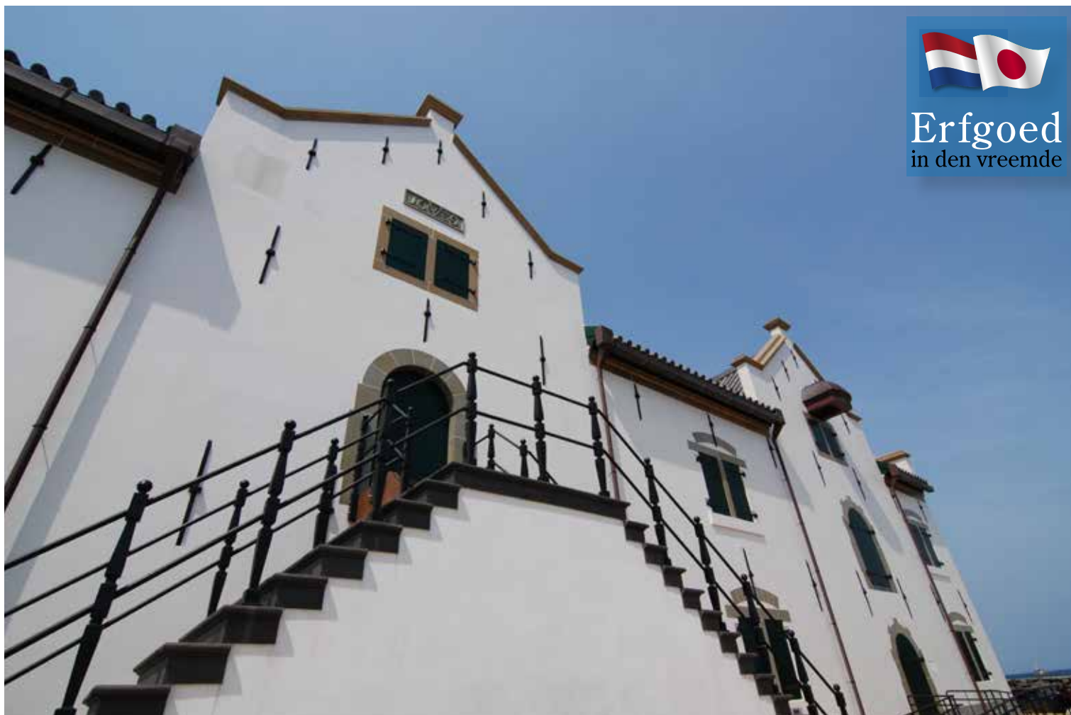
DE GERECONSTRUEERDE VOC-HANDELSPOST IN HIRADO, JAPAN.

enorme druk gezet op het behoud en de authenticiteit van de monumenten.