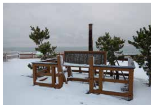
HET MONUMENT VAN DE KANRIN MARU.