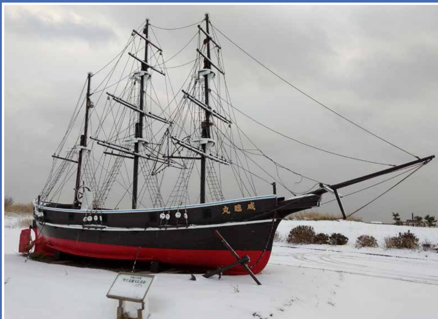
MODEL VAN DE KANRIN MARU OP KAAP SARAKI TE KIKONAI.

TEKST: LEON DERKSEN FOTO'S: AKIFUMI IWABUCHI