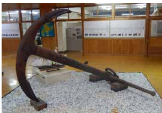
HET ANKER IN HET KIKONAI TOWN MUSEUM.

Deze bijzondere positie ontstond doordat Japan zich in de eerste helft van de 17e eeuw langzaam maar zeker afsloot voor invloeden van buitenaf. Praktisch gezien stortte het land zich daarmee in een internationaal isolement.