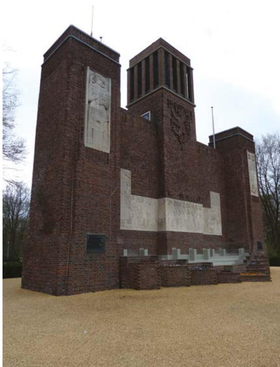
Het Belgenmonument op de Amersfoortse Berg in Amersfoort werd gebouwd in 1917 door Belgische militairen ter herinnering aan de internering in Nederland tijdens de Eerste Wereldoorlog

Nederland bleef handel drijven met beide allianties, onder meer in voedsel en kolen, maar dit kon niet voorkomen dat er vooral in de laatste twee oorlogsjaren grote schaarste ontstond aan voedsel, grondstoffen en brandstof. Er kwam een rantsoenensysteem met bonnen en de maatschappelijke onvrede groeide over het feit dat veel van de schaarse goederen met grote winsten naar bijvoorbeeld Duitsland verhandeld werden of voor de gemobiliseerde troepen bestemd waren. Dit zorgde voor protesten, rellen en zelfs plunderingen. Wellicht het bekendste voorval was de Aardappeloproer in Amsterdam.