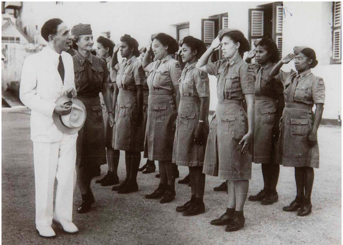
Een groep jonge vrouwen in uniform die als vrijwilligers voor het leger in de oorlog gaan dienen Curaçao (tussen 1940-1945)

Atlantikwall , een reeks kustfortificatiën bedoeld om een invasie vanuit zee tegen te houden. Hiervoor werden nieuwe werken gebouwd bijvoorbeeld bij IJmuiden, maar ook bestaande verdedigingen, zoals bij Vlissingen en Den Helder, werden in opdracht van de Duitsers verder uitgebouwd. In totaal werden ruim 3.000 Wiederstandsnester , Stützpunkte en Stützpunktgruppen , Verteidigungsbereiche en Festungen langs de Nederlandse kust gebouwd, waaronder de Verteidigungsbereiche Den Helder, IJmuiden, Hoek van Holland en Vlissingen. In 1944 kregen Hoek van Holland en IJmuiden de status van Festung . Ook werden bestaande vliegvelden aanzienlijk uitgebreid en nieuwe aangelegd voor de Duitse luchtmacht, zoals Leeuwarden, Twente, Venlo, Veldhoven, Soesterberg, Gilze-Rijen, Teuge etc. Kazernes werden vaak dusdanig (steden)bouwkundig gecamoufleerd dat ze er vanuit de lucht als een dorp of een boerengemeenschap uit zagen. Ook werden er radar- en radiostations ingericht om de Duitse bombardementsvluchten op Engeland te coördineren en de geallieerde bommenwerpers die vanuit Engeland richting Duitsland vlogen, te onderscheppen. De strategische ligging van het land werd ook gebruikt door de Vergeltungswaffen die