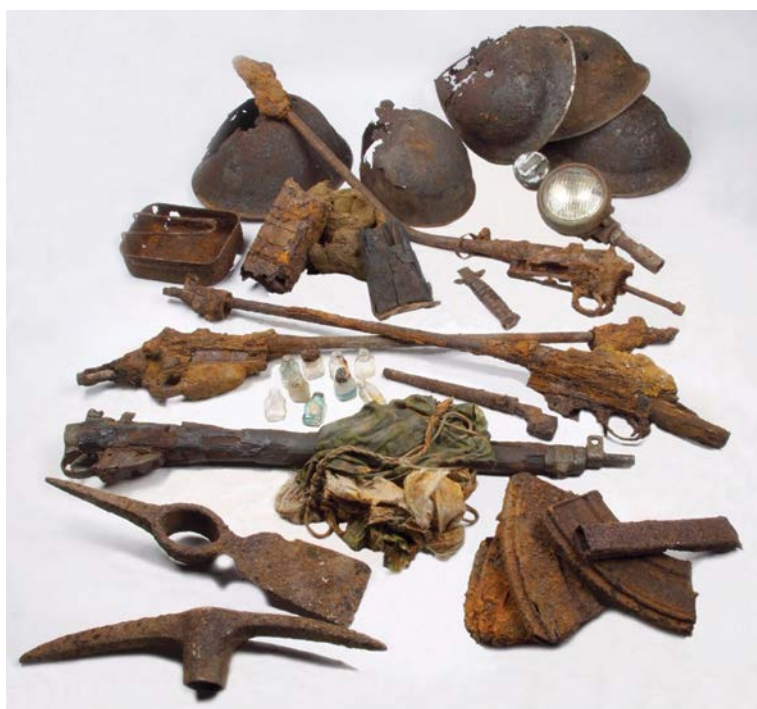
Militaria uit 1944-1945 opgegraven in de omgeving van Nijmegen

Binnen het beleidstraject 'Erfgoed Telt, de betekenis van erfgoed voor de samenleving' liggen aanknopingspunten voor een dergelijke nieuwe bescherming van militair erfgoed door te sturen op een sterkere samenwerking met en inzet van vrijwilligersorganisaties en vrijwilligers en hun kennisinfrastructuren, en tevens de inzet van het planologisch instrumentarium voor behoud.