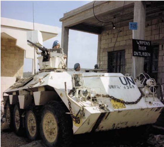
Een YP 408-pantserwielvoertuig met 50mm mitrailleur van Dutchbatt voor observatiepost 7-21, Zuid-Libanon 1979