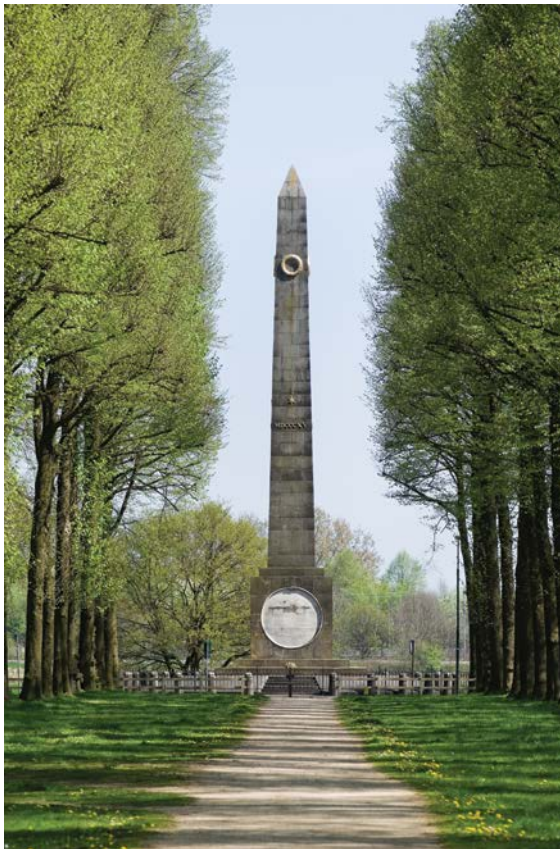
De Naald van Waterloo is een rijksmonument uit 1815 in Baarn. Deze werd opgericht ter ere van Willem Frederik, prins van Oranje, de latere koning Willem II

De bovenstaande keuze van rode draden is tot stand gekomen na eigen onderzoek in studies, literatuur, waaronder de grote lijnen van de Nederlandse buitenlandse politiek, de Canon van Nederland, de belangrijke militair-technologische en militair-strategische ontwikkelingen en de maatschappelijke, politieke, economische ontwikkelingen in Nederland en haar (voormalige) koloniën geschetst door militairhistorische experts van universiteiten, onderzoeksinstituten en het ministerie van Defensie.