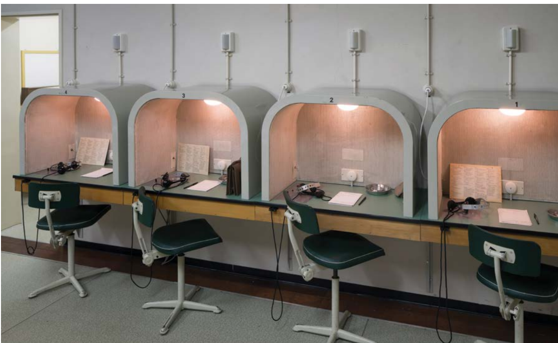
B.B.-complex Overvoorde, Rijswijk

Nederland ruidde officieel de neutraliteit in en werd lid van de NAVO. Dit lidmaatschap kwam ook met verplichtingen, wat voor Nederland onder meer inhield dat zij een rol moest spelen binnen de nucleaire taak van de NAVO en dat het moest deelnemen aan de zogeheten gezamenlijke voorwaartse verdediging - eerst nog achter de IJssel, vanaf 1958 achter de rivier de Weser en vanaf 1963 bij de Duits-Duitse grens op de Noord-Duitse laagvlakte. Het leger en de luchtmacht betrokken bases in Duitsland (o.a. Seedorf) en in ruil daarvoor werd in Nederland een kazerne in Budel aangeboden voor West-Duitse troepen. Het Warschaupact was in numeriek opzicht superieur aan de NAVO. De West-Europese bondgenoten maakten zich dan ook geen illusies. Een grootschalig offensief van het Warschaupact, waarbij de aanvallers richting de Noordzeehavens zouden oprukken, gold als het gevaarlijkste scenario; een dergelijke invasie kon waarschijnlijk alleen tot stand worden gebracht door de inzet van