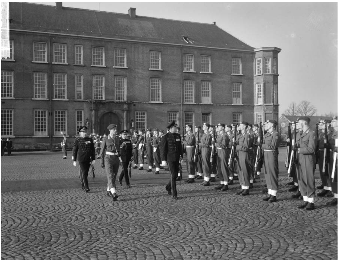
Prins Bernhard bij installatie Koninklijke Militaire Academie (Het Kasteel) te Breda in 1961

Een andere grote ontwikkeling is een krijgsmacht die gebaseerd was op voertuigmobiliteit. Waar in eerste instantie de militairen zich te voet of te paard en later met een rijwiel en stoomschip verplaatsten, was ver-