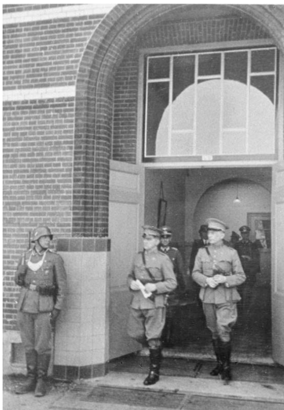
Generaal Winkelman verlaat op 15 mei 1940 het schoolgebouw in Rijsoord waar de capitulatie is getekend

Duitse troepen vielen Nederland in de meidagen van 1940 binnen. De Duitse hoofdaanval liep via Noord-Brabant en de Moerdijkbruggen naar het regeringscentrum te Den Haag. Omdat de opmars door Rotterdam naar Den Haag te lang duurde, werd Rotterdam gebombardeed. Tegen de verwachting in duurde de strijd in Nederland dagen langer dan door Hitler had verwacht. Zo werd bij de Grebbelinie de Duitse inval korte tijd vertraagd. Bij de Peel-Raamstelling slaagden Nederlandse militairen erin een Duitse pantser trein te laten ontsporen, maar dat had uiteindelijk weinig effect op de snelle Duitse opmars naar Zeeland en Moerdijk. In Rotterdam boden Nederlandse troepen sterke weerstand tegen de Duitsers bij de bruggen die de stad in leidden. Ook bij de Afsluitdijk (Kornwerderzand) werd de Duitse opmars kort tegengehouden. Maar mede door het bombardement op Rotterdam (en de dreiging van een vergelijkbaar bombardement op Amsterdam of Utrecht) en de verliezen door de Nederlandse militairen, was capitulatie voor opperbevelhebber generaal Winkelman de enige optie. Franse troepen poogden in mei 1940 vanuit Vlaanderen een aaneengesloten verdediging op te