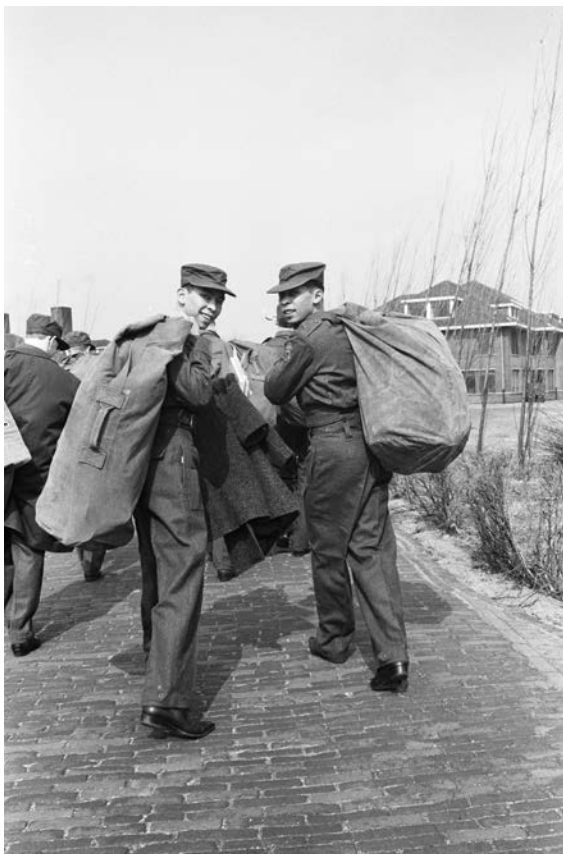
Dienstplichtige jongens ruilden hun spijkerbroek in voor een uniform. Wat is eigenlijk het erfgoed van de dienstplicht?