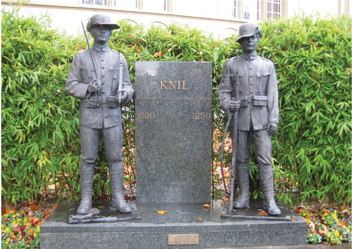
Op 26 juli 1990 op het landgoed Bronbeek geplaatst KNIL-monument. De bronzen figuren van Thérèse de Groot-Haider verbeelden een Molukse en een Nederlandse fuselier van het KNIL in hun veldtenu van omstreeks 1940

ambulancezorg niet of te weinig hadden. Voorheen kon bijvoorbeeld de Bescherming Bevolking worden ingezet bij calamiteiten, maar die verantwoordelijkheid viel nu onder de krijgsmacht die het vanuit politiek oogpunt (zichtbaarheid in de samenleving, het aantonen van haar bestaansrecht richting politiek en publiek) welwillend oppakte.