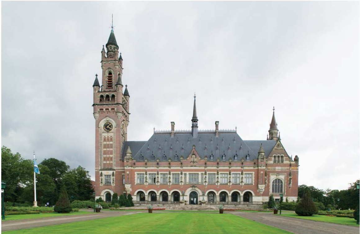
Het Vredespaleis in Den Haag, geopend in 1913