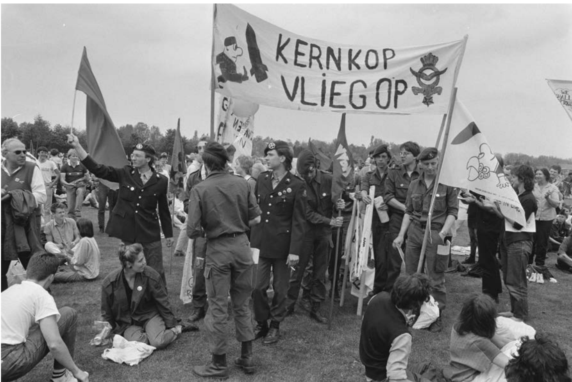
Vredesdemonstranten protesteerden bij vliegbasis Woensdrecht (1986) tegen de voorgenomen plaatsing van kruisvluchtwapens

Na de Tweede Wereldoorlog begon een proces van toenadering binnen de landen in West-Europa. Om oorlogen tussen Europese staten te voorkomen, werd in 1950 het Schumanplan voorgesteld waarbij de, voor een oorlog noodzakelijke staal- en kolenproductie van enkele Europese landen, waaronder Duitsland, Frankrijk, Italië en Nederland, onder centrale regie werd geplaatst: zo ontstond de Europese Gemeenschap voor Kolen en Staal (EGKS), de voorloper van de Europese Economische Gemeenschap (EEG) en later de Europese Unie (EU), vastgesteld in het Verdrag van Maastricht (1992). In 1952 was Nederland ook verdragspartij voor de Europese Defensie Gemeenschap (EDG) dat voorzag in de creatie van een Europese krijgsmacht. Dit project bleek echter een brug te ver, ook omdat het qua doelstelling veel overlap had met de NAVO en omdat oprichting van de EDG ook een politieke unie op vooral buitenlands beleid noodzakelijk zou maken. Inmiddels voert de EU