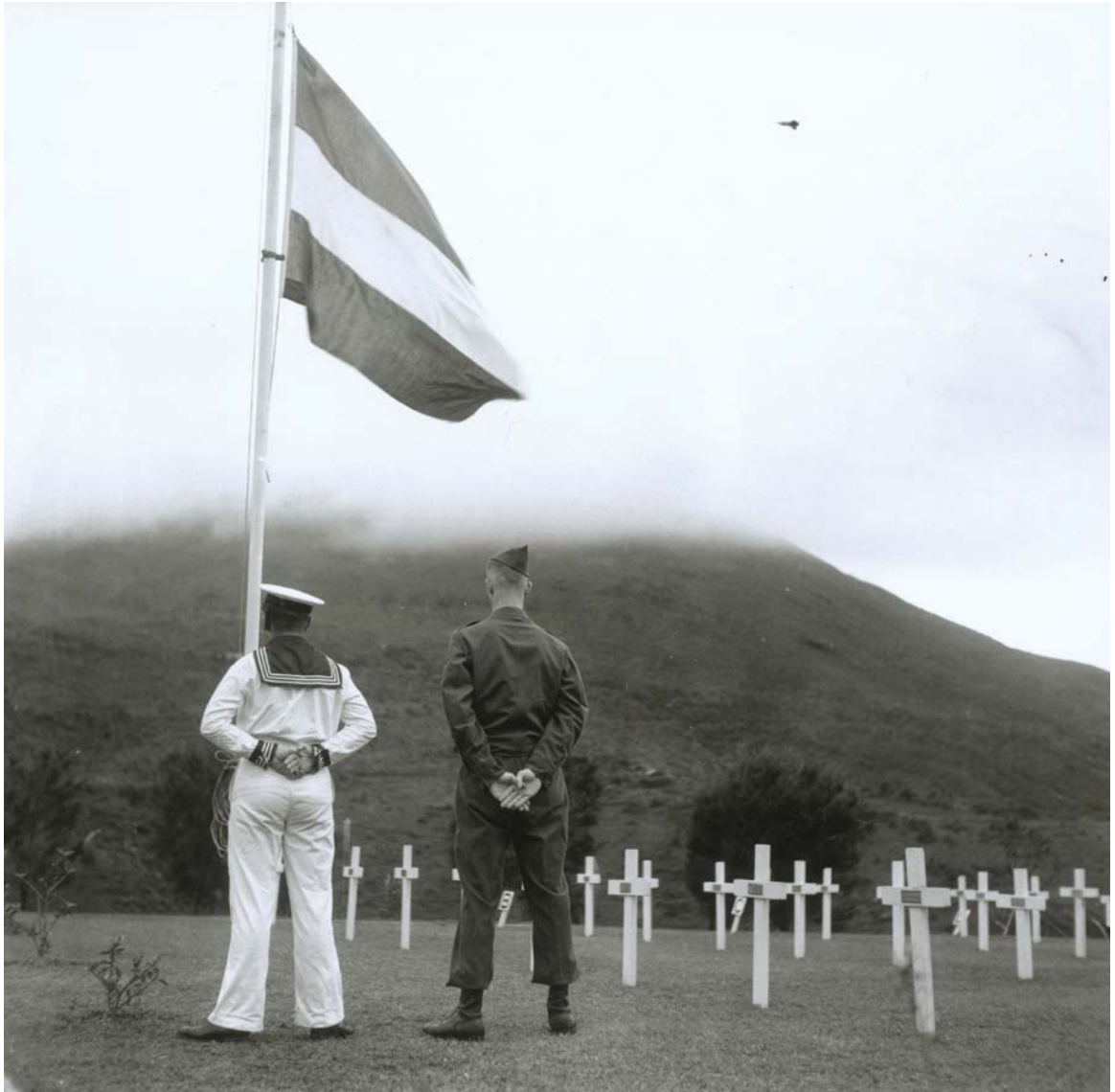
Nederlandse oorlogsgraven op het ereveld Tanggok bij Pusan, Zuid-Korea

ministerie van Buitenlandse Zaken die met deelname aan VN-missies weer kans zag Nederland als speler op het wereldtoneel te positioneren. Het duurde tot 1979 tot de VN van Nederlandse VN-eenheid gebruikmaakte. In de nasleep van de Libanese burgeroorlog in 1975 was de missie UNIFIL opgezet. Pas nadat Frankrijk en Iran zich terugtrokken uit de vredesmacht, werd Nederland gevraagd troepen te leveren. Na vier jaar wilde de regering de Nederlandse inzet terugtrekken, omdat de missie ineffectief bleek. Wederom onder druk van de Verenigde Staten werd besloten de missie, in afgeslankte vorm, nog twee jaar door te laten gaan. In totaal lieten negen Nederlandse militairen er het leven.