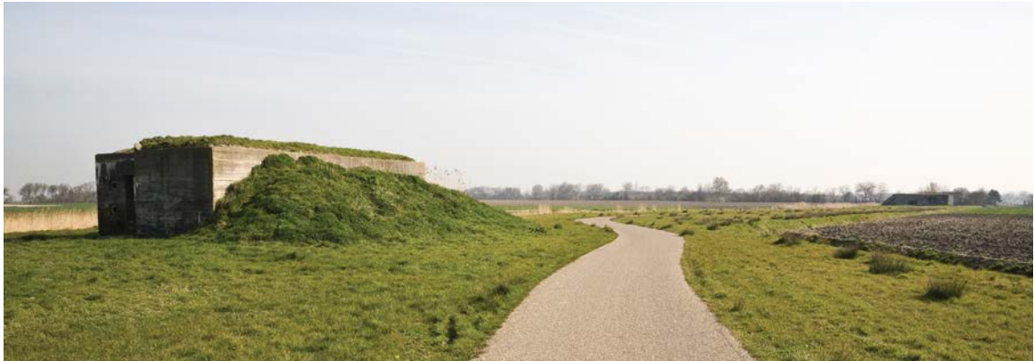
Atlantikwall-bunker langs Vlissingse Watergang