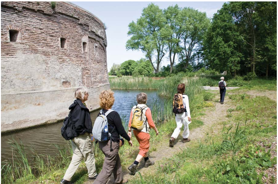
Wandelaars bij het torenfort Uitermeer in Weesp, onderdeel van de Nieuwe Hollandse Waterlinie

De krijgsmacht mobiliseerde en met de net voor de oorlog geïntroduceerde nieuwe Legerwet werd de mogelijkheid geboden tot vrijwillige toetreding tot de Landstorm. De grote toestroom van vrijwilligers leidde tot de oprichting van de Vrijwillige Landstorm, een reservistenmacht. De oorlogsdreiging leidde tot een militairtechnologische groei van de krijgsmacht. In Soesterberg werd een luchtvaartafdeling opgericht welke tijdens de oorlog werd aangevuld met vliegtuigen van de strijdende mogendheden die in Nederland waren geland. Ervaringen in bijvoorbeeld België leerden dat de vestingen en versterkingen slecht opgewassen waren tegen de moderne artilleriegranaten.