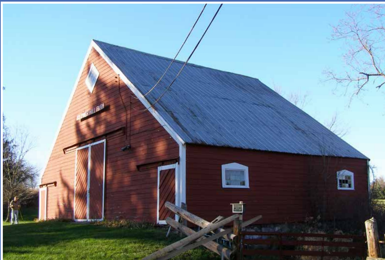
CLOVERHILL FARM, DUTCHESS COUNTY, NEW YORK.