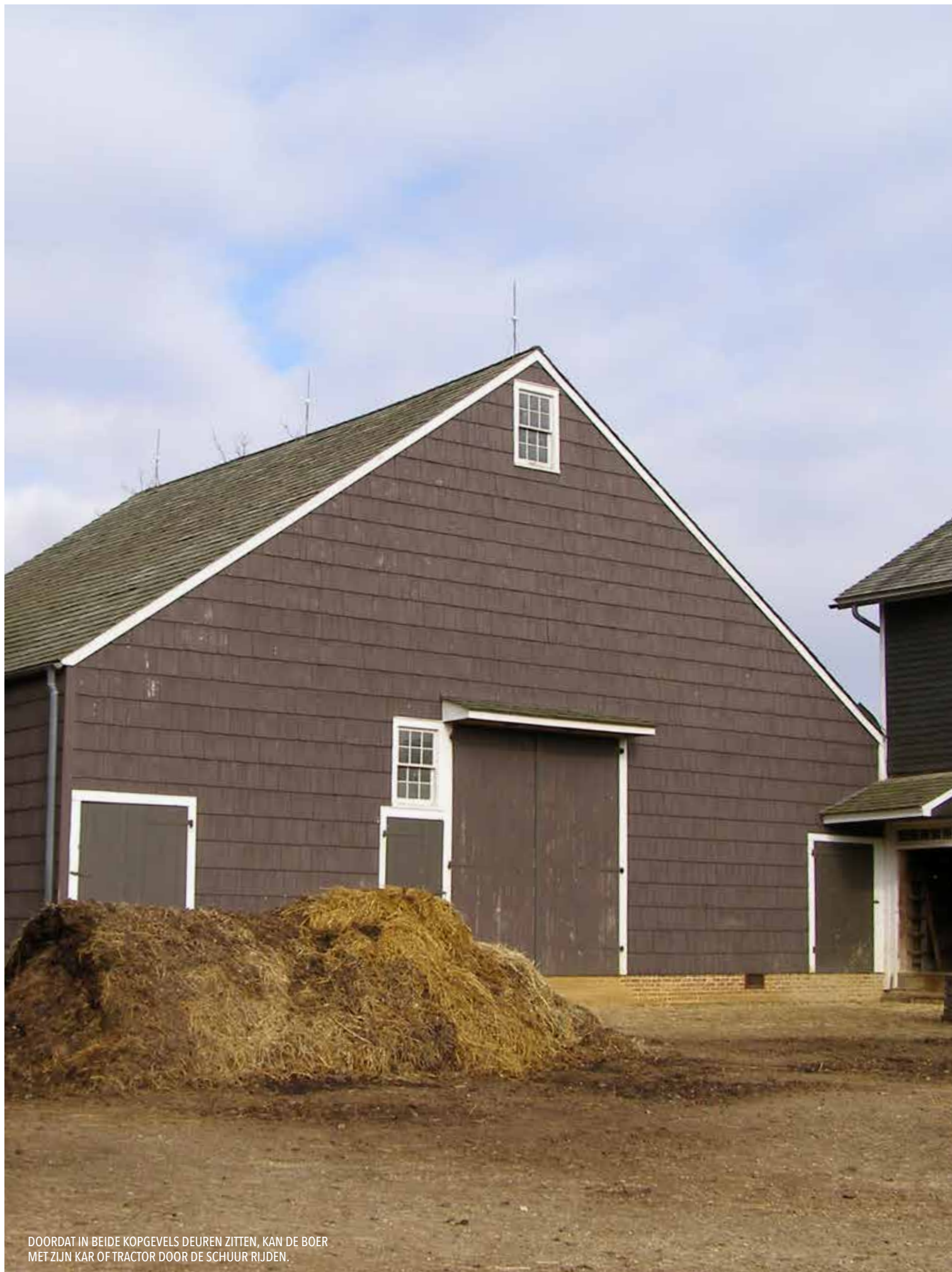
DOORDAT IN BEIDE KOPGEVELS DEUREN ZITTEN, KAN DE BOER MET ZIJN KAR OF TRACTOR DOOR DE SCHUUR RIJDEN.