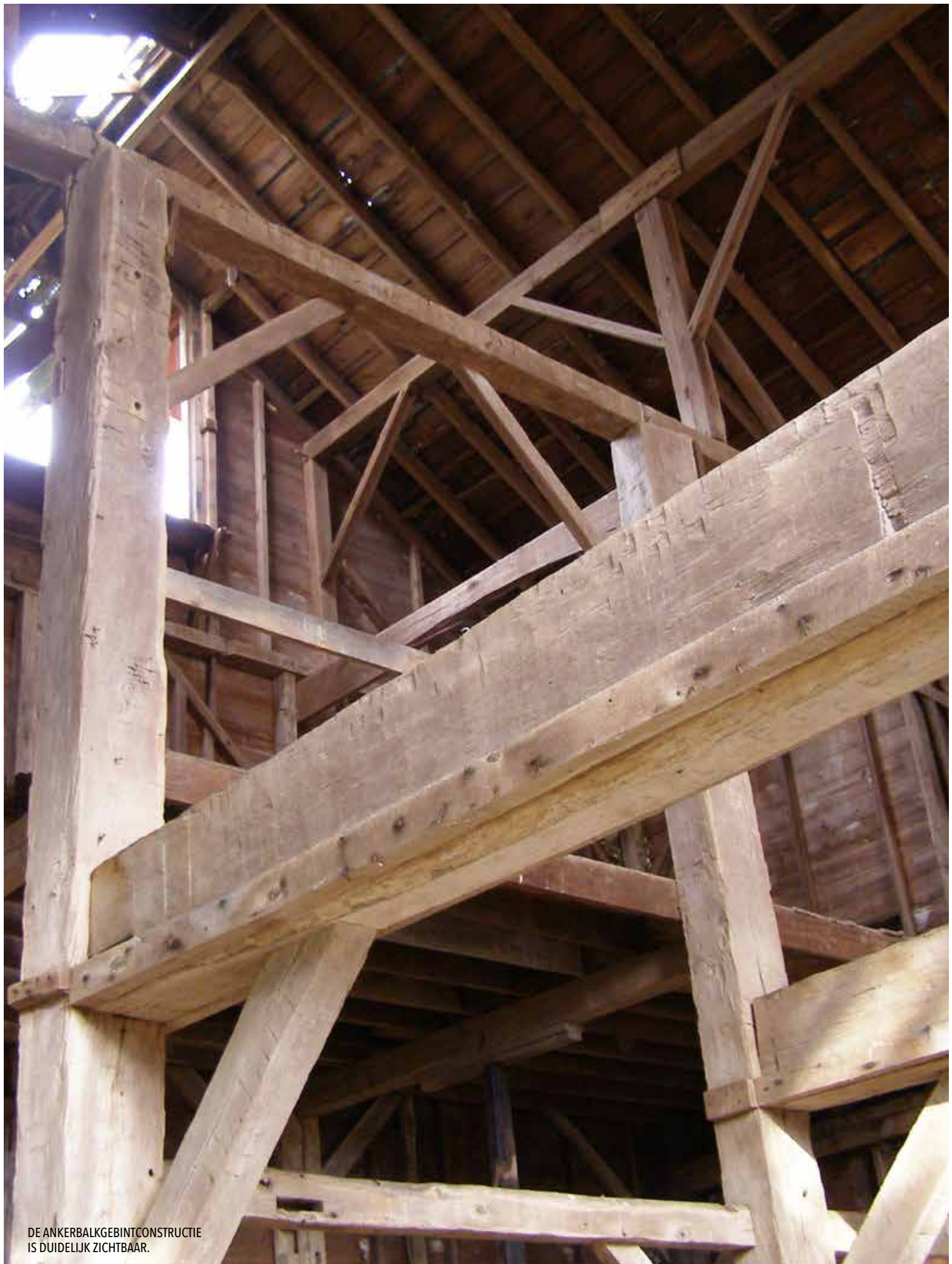
DE ANKERBALKGEBINTCONSTRUCTIE IS DUIDELIJK ZICHTBAAR.