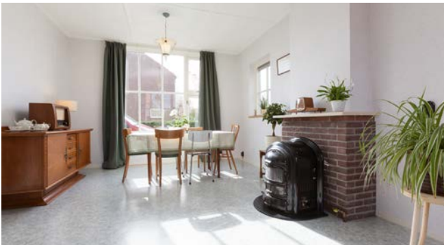
De doorzonkamer van een hoekwoning uit 1951