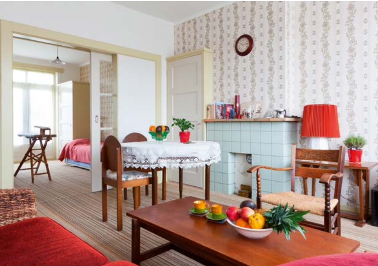
Een woonkamer van een flat uit 1950

raadhuizen komt door de gemeentelijke herindeling nog leeg te staan. Een ander deel heeft al een nieuwe functie als bed and breakfast , appartementengebouw of kantoor. De vaste kunstwerken kunnen meestal gehandhaafd blijven, maar het speciaal ontworpen meubilair moet het veld ruimen. Voor het raadhuis in Weerselo, in 1955 opgetrokken, diende zich een supermarkketen aan. De jaren-vijftig-materialen en -elementen, zoals travertijn, Solnhofener tegels, leisteen en stalen kozijnen kunnen behouden blijven, maar wat moet een supermarkt met de meer dan twintig stoelen en de tafel uit de trouwzaal? Meubilair vindt regelmatig zijn weg naar de tweedehands-meubelhandel of veilingssites. Het behouden van het oorspronkelijke ensemble heeft dan aardig wat voeten in de aarde.