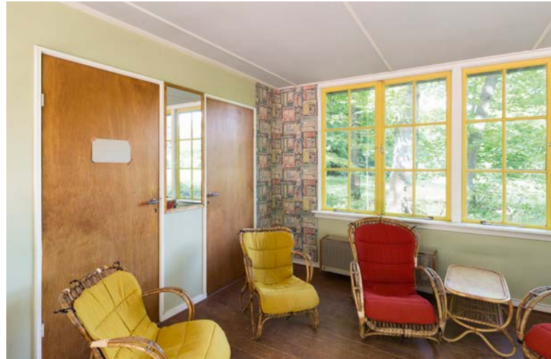
In reactie op de beoogde steriele omgeving kochten veel Nederlanders meubels van 'eerlijke' materialen, zoals rotan

In 1964 liet Fokker een polyester huis ontwikkelen. Dit zogenaamde Fokkerhuis was een bungalow waarin met scheidingswanden kamers konden worden aangebracht. Het huis was voorzien van hete-luchtverwarming en andere moderne snufjes. Het bedrijf verwachtte dat er een lange weg moest worden afgelegd voordat het huis in de handel kon worden gebracht. Als groot struikelblok golden de gemeentelijke verordeningen voor woningbouw, waarin voorschriften over buitenmuren van baksteen of beton waren opgenomen.