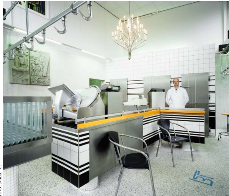
Slagerij Tol in Rotterdam oogt nog zoals deze in 1954 is ingericht

De inrichting van huizen verandert doorgaans al naar gelang de heersende mode. Nieuwe inzichten doen hun intrede en nieuwe uitvindingen worden betaalbaar. Bij renovaties van woningen uit de eerste jaren na de Tweede Wereldoorlog verdwijnt allereerst het lavet ten faveure van een badkamer. Daarna zijn keukens, kastjes, wanden, indelingen en de vloerafwerking meestal de eerstvolgende veranderde zaken. Vaak wordt de waarde ervan niet gezien en geven uitspraken als 'het is niet mijn smaak' of 'ouderwets' de doorslag om vrijwel het hele interieur te verwijderen en met een schone lei te beginnen volgens de nieuwste woonopvattingen. Niet altijd ligt daar een nieuwe smaak aan ten grondslag. Vaak zijn praktische overwegingen doorslaggevend. Aanrechten uit de jaren veertig en vijftig zijn voor de hedendaagse, langere mensen bijvoorbeeld veel te laag. Soms spelen emoties de boventoon en wil een eigenaar door een bepaald interieurelement niet langer geconfronteerd worden met de herinneringen die eraan kleven. Vaak zijn interieurs uit die tijd tegenwoordig al meerdere keren aangepast. Dit gegeven is niet specifiek voor de wederopbouwperiode. Het levert soms ook verrassende voorbeelden op van wederopbouwrichtingen van een veel ouder gebouw. In Kasteel Heeze bijvoorbeeld heeft weliswaar een oudere keuken moeten