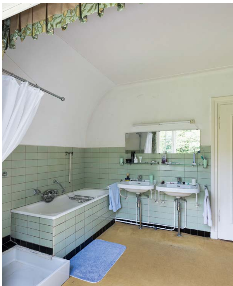
Een badkamer uit 1951

De waardering voor een voorgaande periode komt vaak wat later op gang. Schuifdeuren en glas in lood uit de jaren dertig werden lang gesloopt of weggetimmerd, maar behoren nu tot wat de makelaar 'authentieke elementen' noemt. De aandacht voor de jaren veertig, vijftig en zestig groeit inmiddels ook. Onder invloed van televisieseries als Mad men wordt de mode uit die tijd opnieuw omarmd en mogen de meubels van Eames, Gispens en Pastoe op groeiende belangstelling rekenen. Toch is het van belang om originele inrichtingen uit de periode 1940-1965 onder onze hoede te nemen, anders blijven ze in rap tempo verdwijnen.