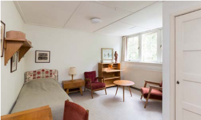
Een slaapkamer uit 1951