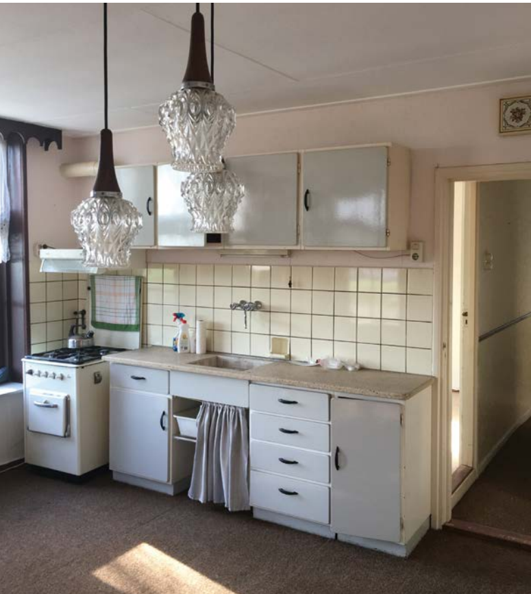
Aanrechten uit de jaren veertig en vijftig zijn te laag voor de hedendaagse, langere mensen