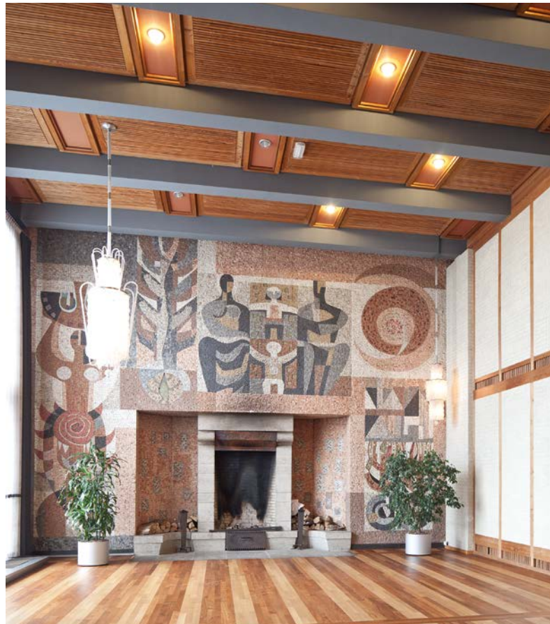
De haard en het mozaïek in de burgerzaal van het raadhuis van Hengelo uit 1963 zijn symbolisch