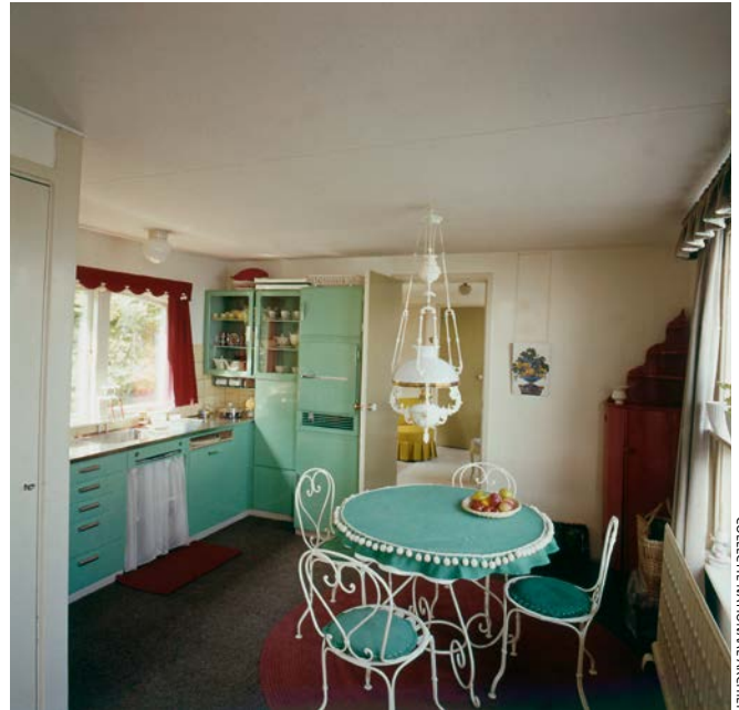
Een woonkeuken op een woonboot in 1965