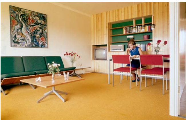
De woonkamer van het Fokkerhuis uit 1964

Het uit 1908 stammende zwarte bakeliet van schakelaars, deurlinken en radio's kreeg concurrentie van een uitgebreid assortiment plastics in de vrolijkste kleuren. Tupperware werd in 1945 ontwikkeld in de Verenigde Staten. De firma breidde in de jaren zestig haar activiteiten uit naar Europa en vervolgens over de rest van de wereld. Van de nieuwe, onderhoudsarme kunststoffen werden niet alleen opbergbakjes voor het luchtdicht bewaren van voedsel vervaardigd, maar het werd ook toegepast in meubels, toestellen, kunst en decoratie. Door dit makkelijk te vervormen en bewerken materiaal konden ontwerpers hun fantasie de vrije loop laten. In 1960 ontwierp de Deen Verner Panton het eerste, volledig uit plastic vervaardigde meubel. Deze Panton-stoel of S-chair bestaat uit een vloeiend gebogen stuk plastic.