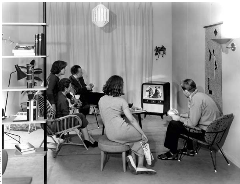
In de jaren vijftig keken steeds meer mensen televisie