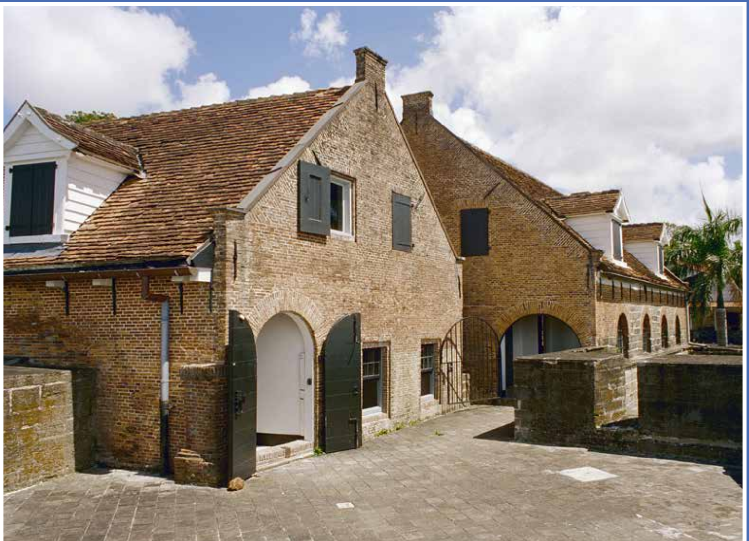
ACHTERGEVELS VAN GEBOUWEN IN FORT ZEELANDIA, PARAMARIBO.