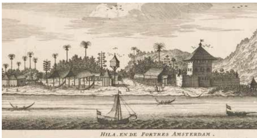
FORT AMSTERDAM, HILA. DETAIL UIT PRENT IN VALENTIJN, OUD EN NIEUW INDIEN, 1724.

Op het eiland Ambon, in de Molukken, liepen in de jaren dertig van de 17e eeuw de spanningen op. Als gevolg van de vaak gewelddadige Nederlandse pogingen de kruidnagelteelt en -handel onder controle te krijgen, dreven de Verenigde Oost-Indische Compagnie (VOC) en haar oude bondgenoot Hitu (het noordelijke deel van het eiland) uit elkaar. In 1633 besloot de VOC daarom enkele van haar handelsposten langs de kust van Hitu te versterken en zo verrees in het dorpje Hila Fort Amsterdam. Uiteindelijk brak zo'n tien jaar later oorlog uit met Hitu en in dit conflict verloor het gebied zijn onafhankelijkheid.