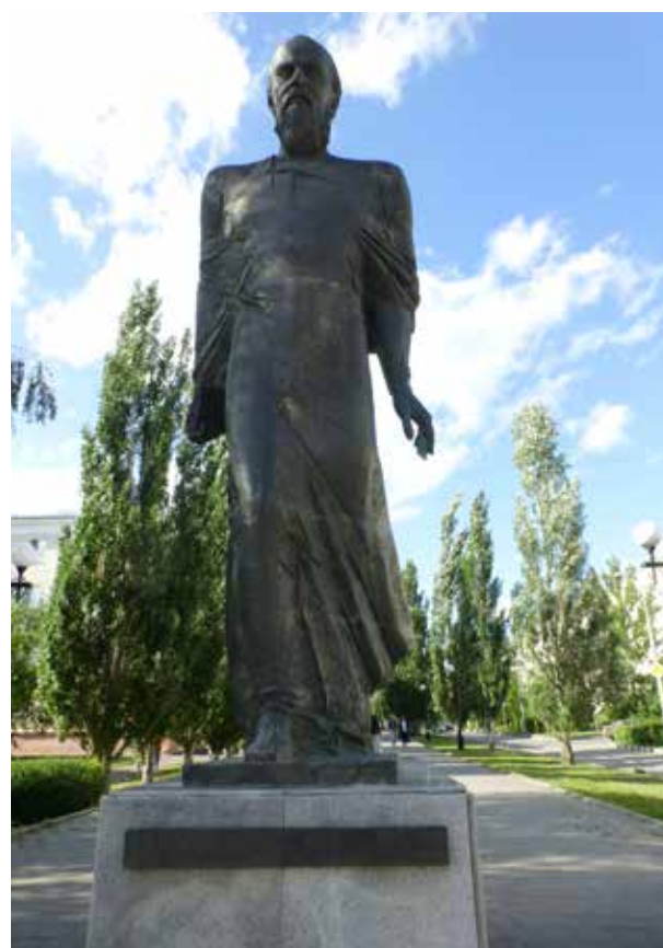
HET M.A. VRUBEL MUSEUM. STANDBEELD VAN DOSTOYEVSKI.

De masterclasses richten zich op beheer en behoud in de breedste zin: ook de restauratie van schilderijen op paneel of canvas en de inrichting van een depot komen aan bod. Zelfs archiefonderzoek