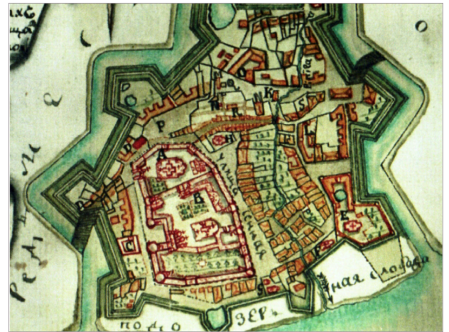
KAART 1779 STADSUITBREIDING VAN ROSTOV (COLLECTIE STAATSMUSEUM ROSTOV). HET GEBIED ROND DE VESTING WERD VRIJGEHOUDEN. DIT GEBIED IS NU NOG VRIJWEL ONBEOUWD.