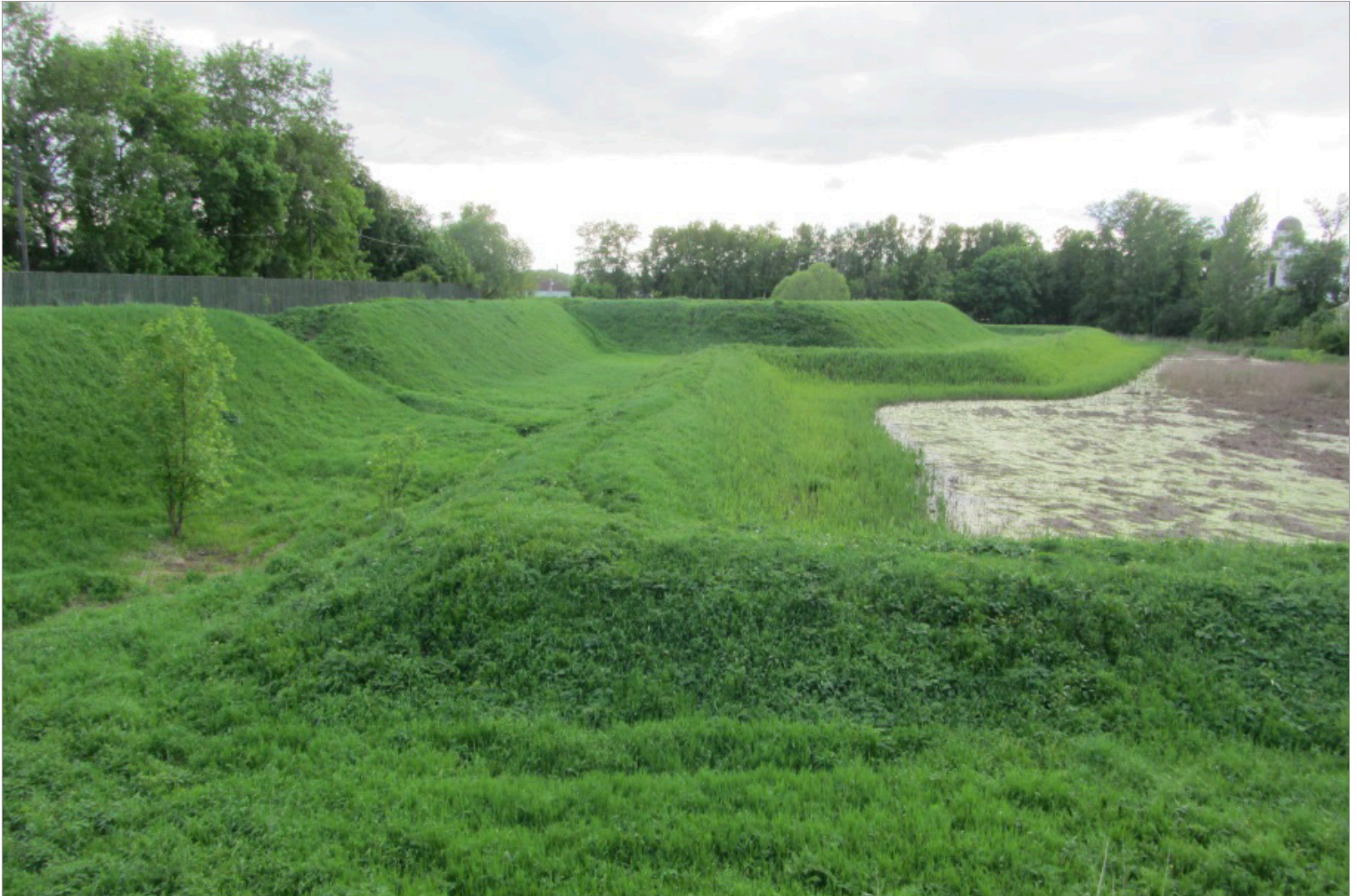
DE VESTINGWERKEN VAN ROSTOV VELIKI (BOVEN) VERGELEKEN MET DE GERECONSTRUEERDE VESTINGWERKEN VAN HEUSDEN (RECHTERPAGINA) (FOTO'S DAAN LAVIES).