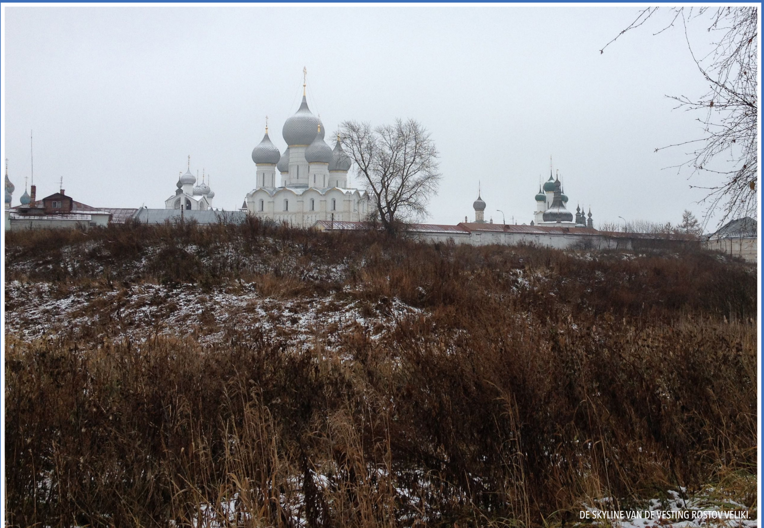
DE SKYLINE VAN DE VESTING ROSTOV VELIKI.