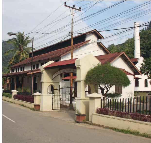
Linksboven: Mijnschat Sawahlunto