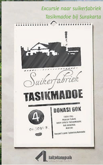
Excursie naar suikerfabriek Tasikmadoe bij Surakarta