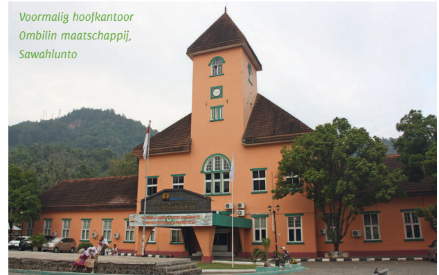
Voormalig hoofkantoor Ombilin maatschappij, Sawahlunto