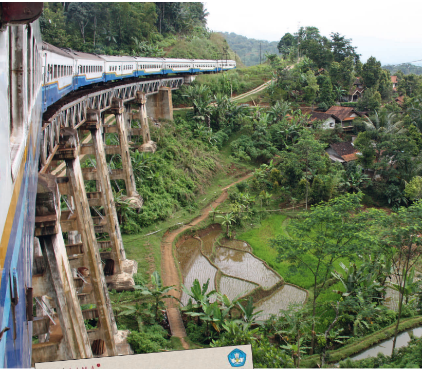
Spoortraject op Java