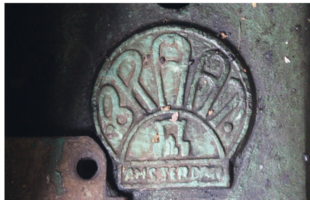
Links: Rubberfabriek Sukamade