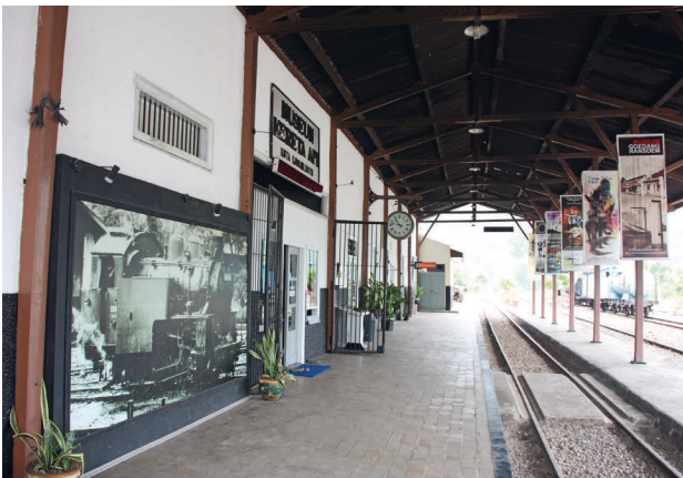
Linksonder: Treinstation Sawahlunto

ernaartoe en op het laatst moesten we drie keer een rivier door om het dorpje Sukamade te bereiken. We verbleven hier om zeeschildpadden te observeren die 's nachts eieren op het strand leggen. Maar tot mijn verrassing kwam ik terecht in een plantage-dorpje waar de tijd leek stil te staan. Rond een oud fabriekje stond op een heuvel het stenen huis van de opzichter en aan de voet hiervan drie rijen gammele bamboehuisjes van plantage-arbeiders. In de fabriek werd nog steeds rubber, cacao, koffie en kopra verwerkt; op de machines stond de koloniale merknaam Braat vermeld. Dorpjes zoals deze werden tussen 1870 en 1930 over heel Java door westerse planters opgericht. Lees de roman 'Heren van de thee' van Hella Haasse er maar op na.