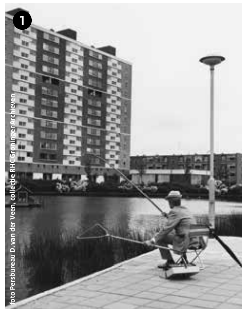
foto Peitsbureau D. van der Veen, collectie RHC Groninger Archieven

Tekst Rijksdienst voor het Cultureel Erfgoed / Grafisch ontwerp En-publique.nl / Kaarten Must / Foto cover Gemeentepolitie, collectie RHC Groninger Archieven