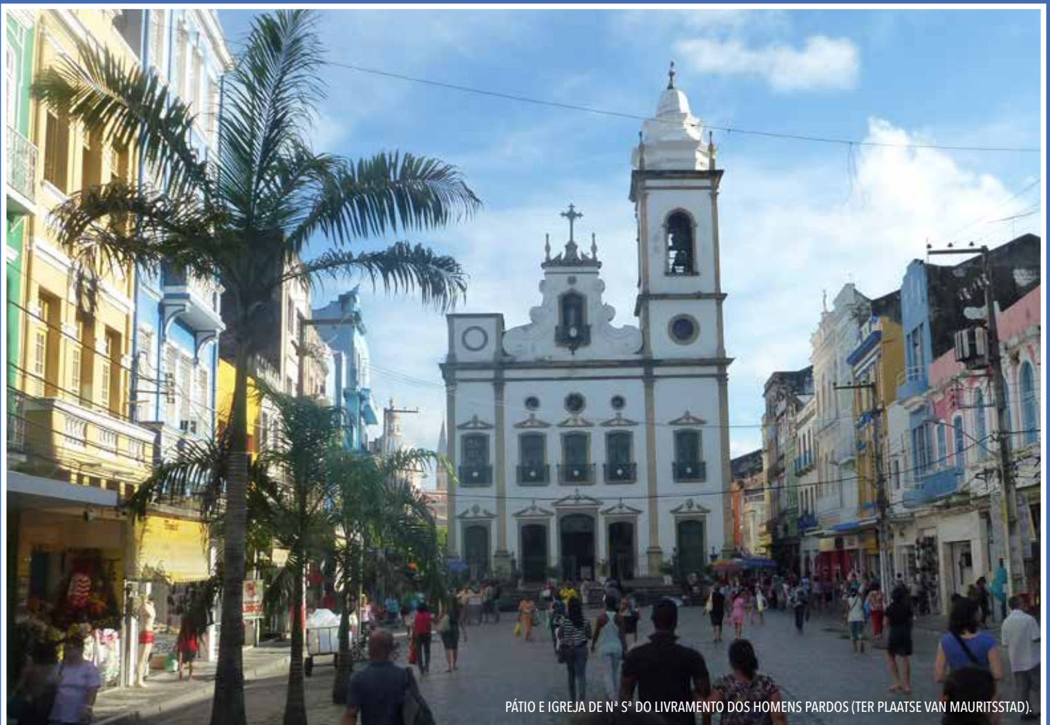
PÁTIO E IGREJA DE N o S a DO LIVRAMENTO DOS HOMENS PARDOS (TER PLAATSE VAN MAURITSSTAD).

TEKST: PAUL MEURS EN ANNA LAMBERTS