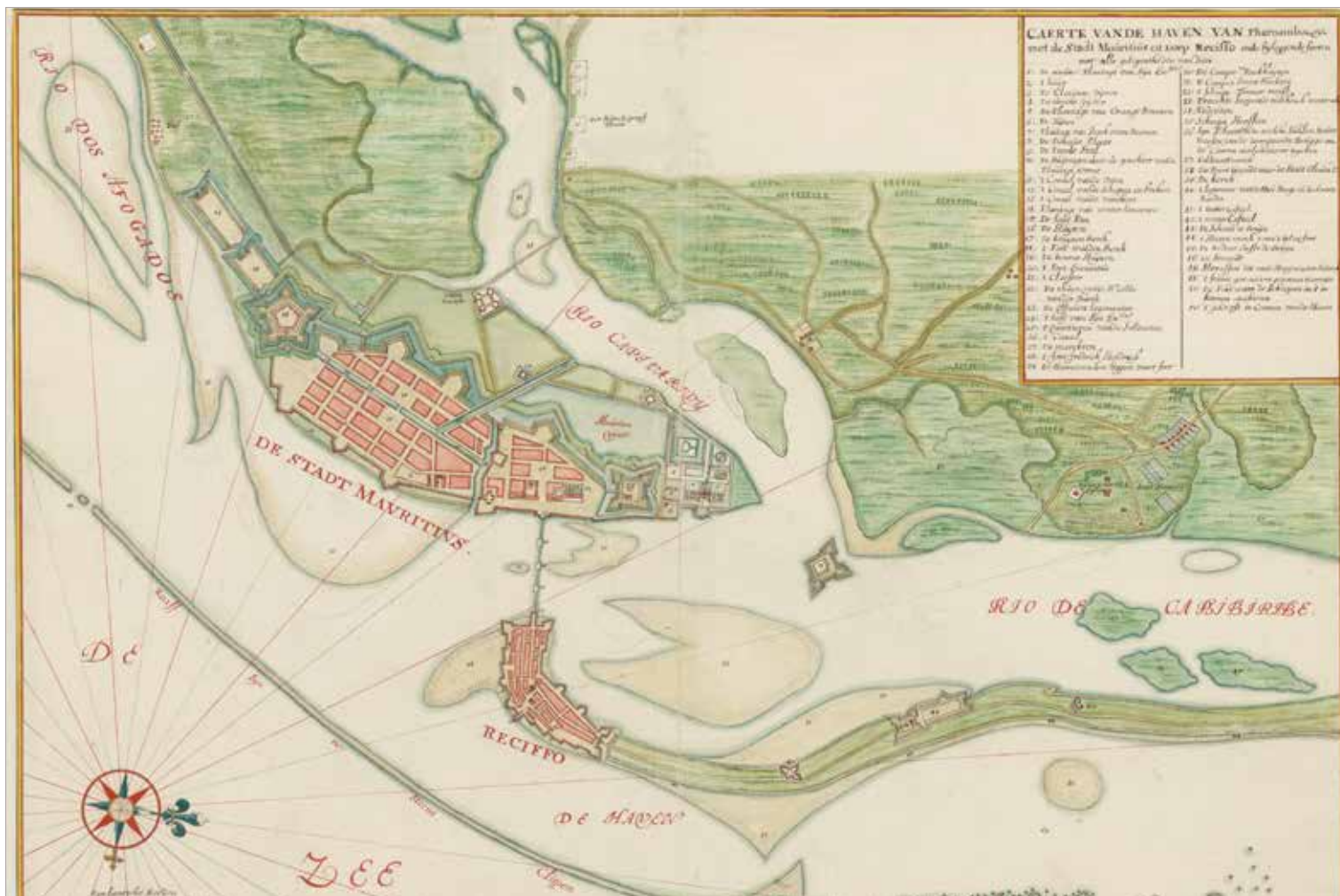
KAART VAN DE HAVEN VAN PERNAMBUCO (JOHANNES VINGBOONS, 1665, NATIONAAL ARCHIEF DEN HAAG, INV.NR: 619.74).

De Hollandse aanwezigheid in Brazilië duurde maar kort, van 1630 tot 1654. De West-Indische Compagnie (WIC) veroverde in 1624 de hoofdstad Salvador op de Portugezen, om haar een jaar later weer op te moeten geven. In Recife, de huidige hoofdstad van de staat Pernambuco, hield de compagnie langer stand. De natte delta waar het dorpje Recife lag, vormde een vertrouwde omgeving voor de Nederlanders en was goed te verdedigen met een stelsel van forten en versterkingen. Recife werd het centrum van de Hollandse suikerproductie in de nieuwe wereld.