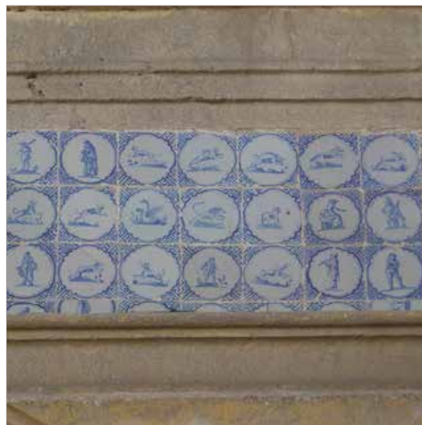
HOLLANDSE TEGELS IN HET CONVENTO SANTO ANTÔNIO, RECIFE.

Bijna vier eeuwen na Maurits is er nog maar weinig zichtbaar van de Nederlandse periode in Recife. Er zijn geen Hollandse gebouwen meer en oud Recife ziet er nu uit als een modern