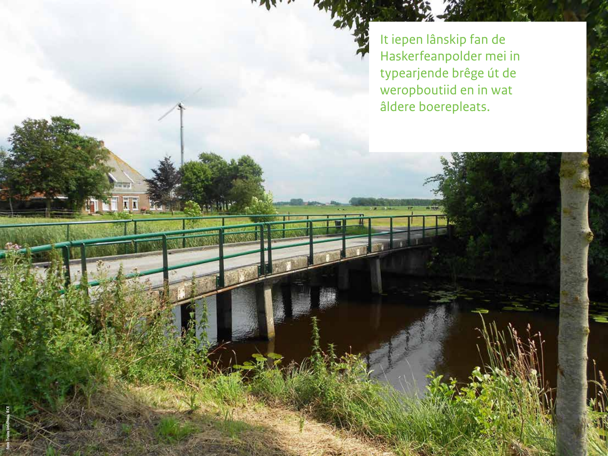
It iepen lânskip fan de Haskerfeanpolder mei in typearjende brêge út de weropboutiid en in wat âldere boerepleats.