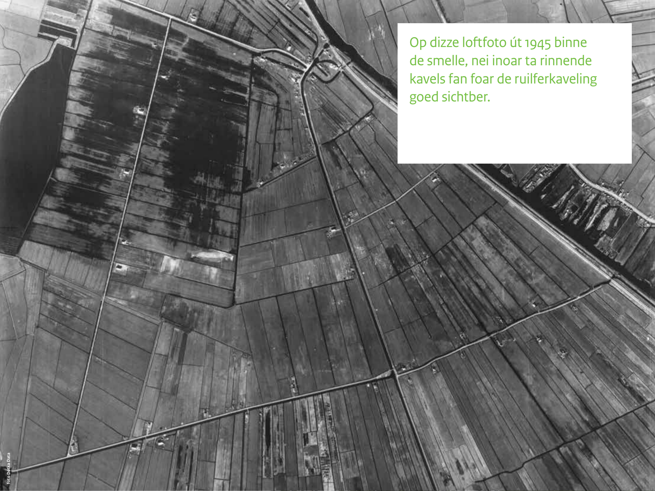
Op dizze loftfoto út 1945 binne de smelle, nei inoar ta rinnende kavels fan foar de ruilferkaveling goed sichtber.