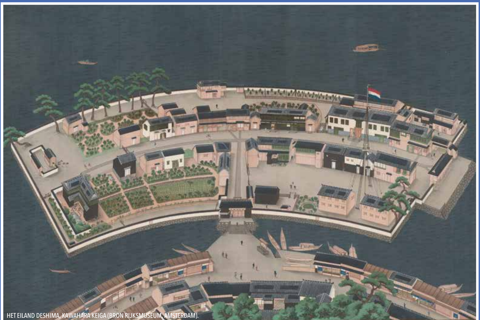
HET EILAND DESHIMA, KAWAHARA KEIGA.