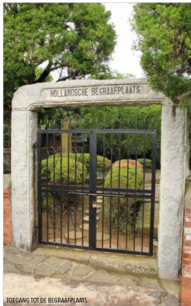
TOEGANG TOT DE BEGRAAFPLAATS.

De stichting zet zich in voor behoud van funerair erfgoed in Nederland en daaraan door de geschiedenis verbonden locaties. De website dodenakkers.nl bevat ruim 700 artikelen over funeraire onderwerpen.