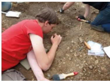
Een jonge archeologische onderzoeker aan het werk

De jury van de W.A. van Es-prijs roept jonge archeologische onderzoekers op voor 1 oktober hun master-scriptie in te zenden. Aan deze aanmoedigingsprijs van de Rijksdienst voor het Cultureel Erfgoed zijn een bedrag van € 2000 en een oorkonde verbonden. De scriptie dient voltooid te zijn tussen 1 september 2012 en 31 augustus 2015. Op 27 november wordt de archeologieprijs uitgereikt, tijdens de Reuvensdagen in Zwolle. De Rijksdienst kent de W.A. van Es-prijs bij toerbeurt toe aan een proefschrift, een master-scriptie en een andere prijzenswaardige publicatie. Nadere informatie: www.cultureelerfgoed.nl .