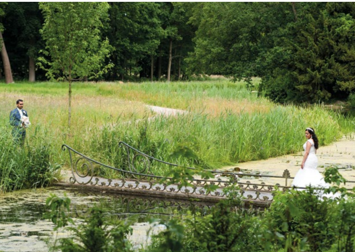
Bij de restauratie is het landschappelijke park uit de negentiende eeuw de boventoon blijven voeren