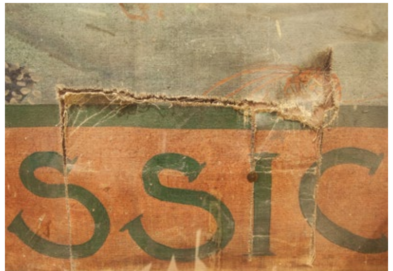
De oertijd is aan herstel toe

'De gemeente dacht met ons mee en verleende 33.000 euro subsidie. Dat was genoeg voor een proef. Zo is het eerste doek, Devoon , prachtig gerestaureerd. Nu zoeken we financiering voor de volgende bespanning, Perm . Omdat de school geen ervaring had met fondsenwerving huurden we iemand in om te onderzoeken wie onze mogelijke subsidiegevers zijn. Het bleek voor sommige fondsen een nadeel te zijn dat onze oertijd niet publiekelijk toegankelijk is. Daar