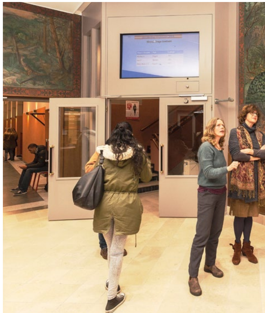
Tussen de schilderijen van de oertijd in de hal van het voormalige Lyceum voor Meisjes in Amsterdam is tekenleraar