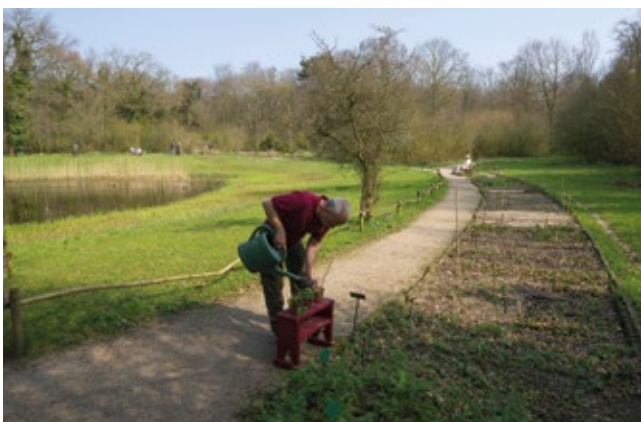
Links de vijver en rechts planten voor scholieren

Vanaf de opening in 1925 is de toegang vrij. Vanzelfsprekend was Thijsse zelf de eerste die met rondleidingen begon. Dat deed hij onder andere voor de leerlingen van de scholen in Overveen en Bloemendaal waaraan hij als biologieleraar verbonden was. Ook veel andere scholen in Bloemendaal en Haarlem maakten en maken gebruik van de Hof, net als studenten uit Amsterdam en Leiden. Een goede indruk van de onnavolgbare wijze waarop Thijsse zijn rondleidingen verzorgde, bieden zijn boekjes Een jaar in Thijsse's Hof en Een tweede jaar in Thijsse's Hof , uit 1940 en 1942. Zo schreef hij over mieren als zaaiers: 'Begin Mei kunt ge het wel treffen, dat ze bij bank tien rondlopen met glinsterende zwarte bolletjes in hun bek met een wit randje er aan. [...] Dit laatste is een vettig weefsel en daar is het de mieren om te doen. De eigenlijke zaden zelf, de zwarte bolletjes, daar hebben ze niets aan en die laten ze wel verslingeren, als het lekkers verorberd is. Zodoende wordt de Helmbloem gaandeweg verspreid naar alle plekken, waar de kiemplantjes het hebben kunnen uithouden.'