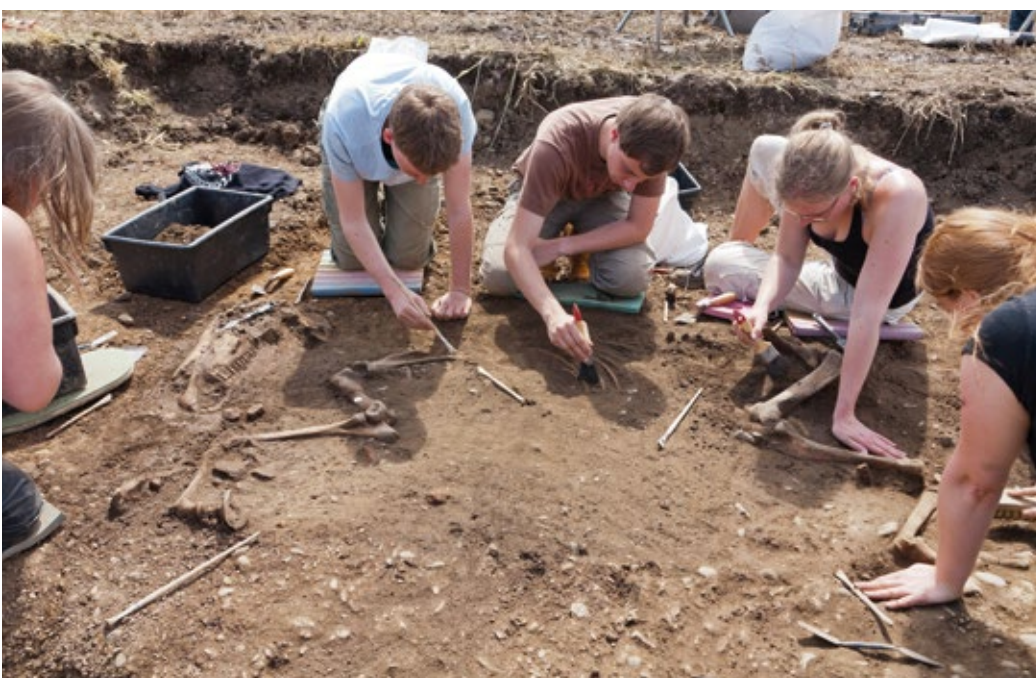
Studenten van de Universiteit Leiden hielpen een van de begraven paarden vrijleggen

Jan-Willem de Kort is specialist veldarcheologie en Roel Lauwerier en Inge van der Jagt zijn specialist archeozoölogie, alle drie bij de Rijksdienst voor het Cultureel Erfgoed, j.de.kort@cultureelerfgoed.nl, r.lauwerier@cultureelerfgoed.nl & i.van.der.jagt@cultureelerfgoed.nl. Het onderzoeksrapport 'Merovingers in een villa 2', Rapportage Archeologische Monumentenzorg 222, is gratis te downloaden via www.cultureelerfgoed.nl .