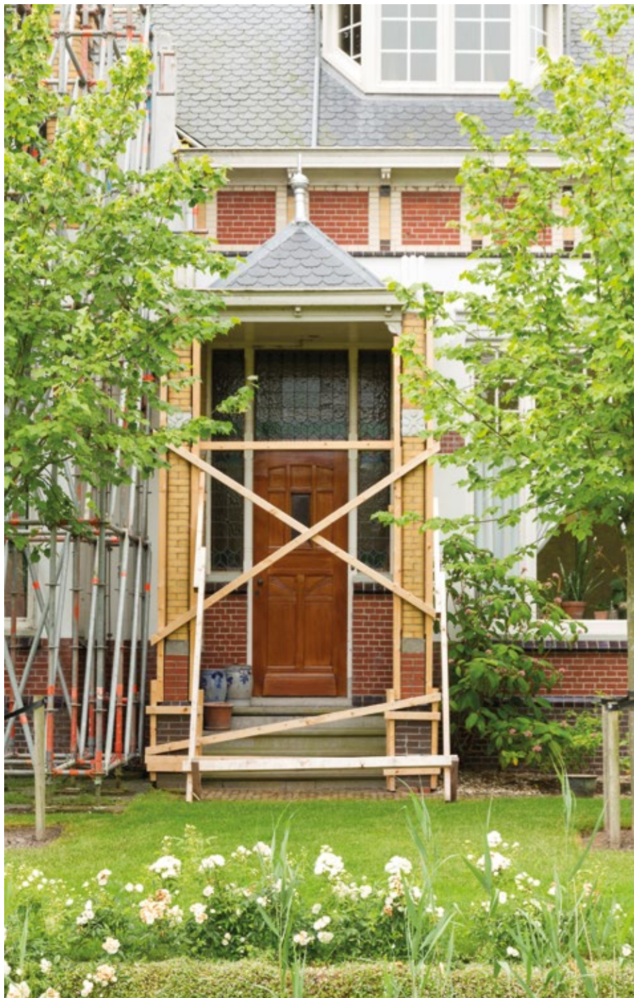
Veel gebouwen in Groningen worden tijdelijk gestut, zoals deze rijksmonumentale burgemeestersvilla uit 1916 in het gehucht Doodstil

Elk historisch gebouw vraagt zorg en aandacht. Maar met de versterking van deze gebouwen moet tempo gemaakt worden. En als versterking niet loont, dan wordt er gesloopt en nieuw gebouwd. Met als mogelijk gevolg dat er in een dorp straks een of twee monumentale gebouwen overblijven te midden van uniforme