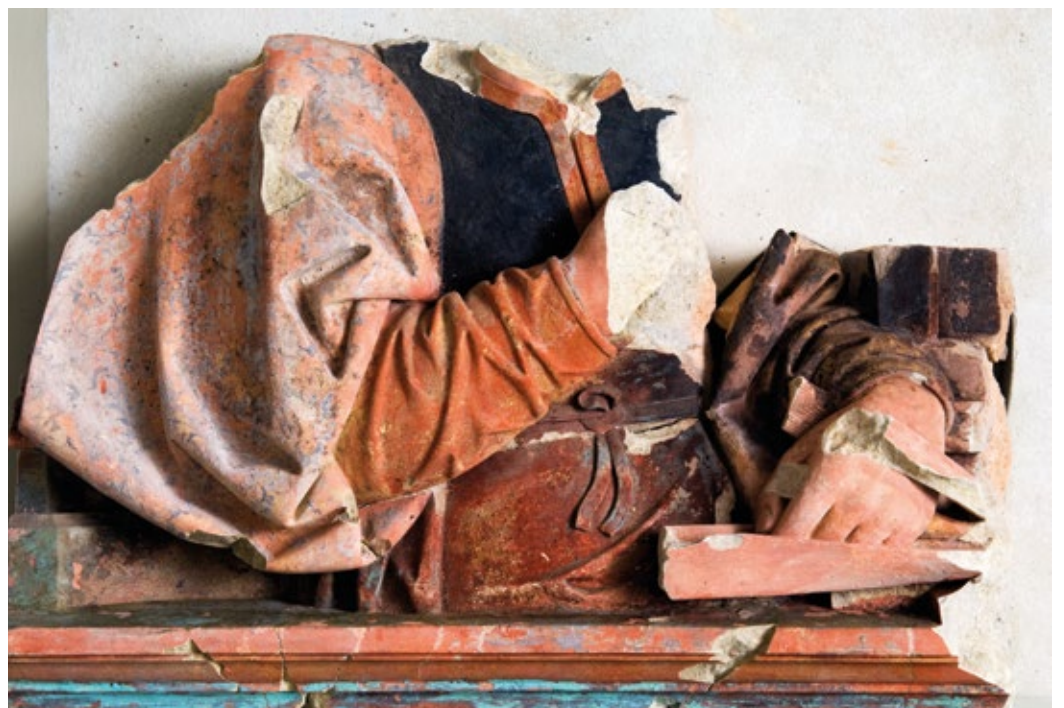
Een overgebleven deel van de achterwand, de retabel, van het altaar uit Doorn