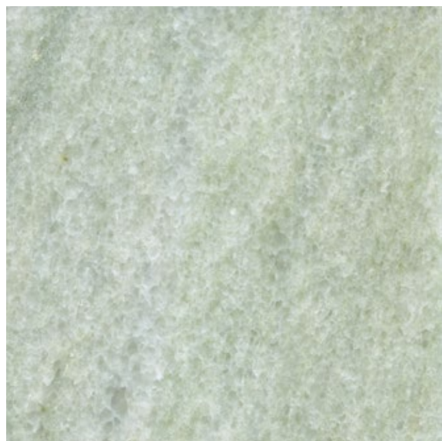
Boven gepolijst Crystallino Ilios-marmer en onder gepolijst Crystallino Scandia-marmer

volle erfgoed van Nederland. Dat doet de dienst onder andere door praktijk, beleid en wetenschap met elkaar te verbinden.