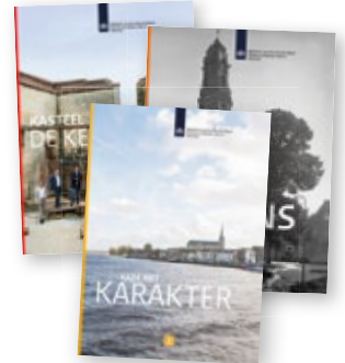
Doet u mee aan de enquête?

Over welk onderwerp leest u het liefst in het Tijdschrift van de Rijksdienst voor het Cultureel Erfgoed? Vindt u het interessant om vaker een themanummer te ontvangen? Wat vindt u van de vormgeving, de afbeeldingen, het formaat, de frequentie? De redactie van het Tijdschrift van de Rijksdienst voor het Cultureel Erfgoed is benieuwd naar haar lezers en vooral naar uw mening. Wij willen uw ervaring met het Tijdschrift zo goed mogelijk maken en daar hebben wij uw hulp voor nodig. Als u zo vriendelijk zou willen zijn een kleine enquête in te vullen, helpt u ons daar zeer mee. Uw antwoorden worden anoniem verwerkt. Zie voor de enquête www.cultureelerfgoed.nl/enquetetijdschrift . Alvast hartelijk bedankt!