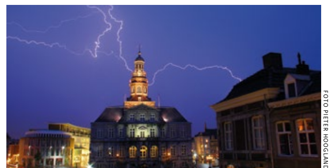
Het stadhuis van Maastricht, gefotografeerd door Pieter Hoogland, een van de vorige winnaars

Van veel Nederlandse monumenten staat nog geen foto op Wikipedia. Daar komt verandering in nu voor de vijfde keer de grootste fotowedstrijd ter wereld loopt, Wiki Loves Monuments. Duizenden deelnemers plaatsen momenteel foto's van monumenten in de internet-encyclopedie. Daarmee zijn deze vrij beschikbaar voor iedereen. Het Nederlandse initiatief is sinds 2010 uitgegroeid tot een wedstrijd in steeds meer landen. De Rijksdienst voor het Cultureel Erfgoed heeft zitting in de jury. Foto's van monumenten die in september via het wedstrijdformulier worden geplaatst maken kans op een prijs. Dit jaar zijn er speciale prijzen voor de mooiste foto van een Dudok-monument en van een ornament. ✕