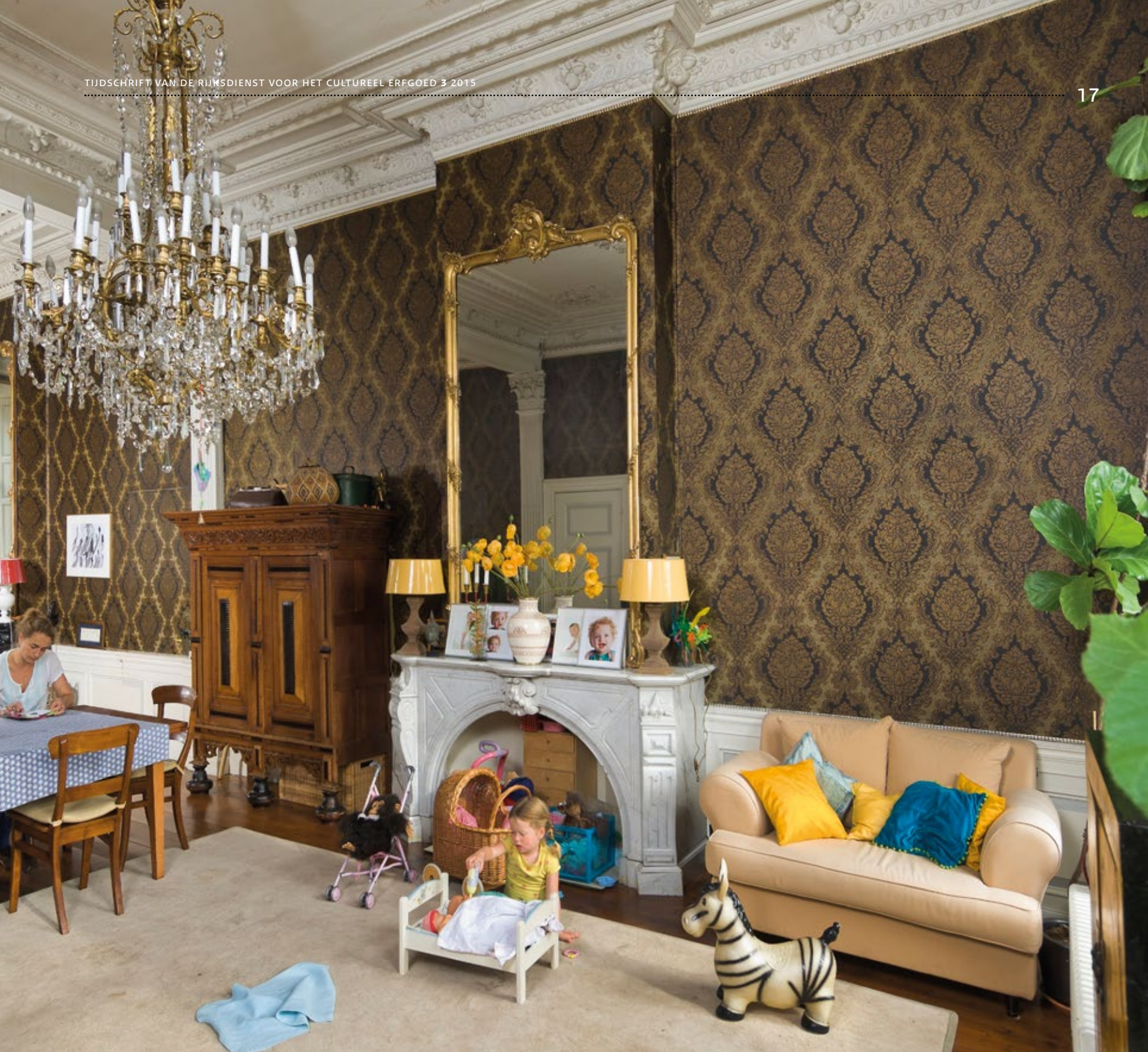
De woonkamer van de rijksmonumentale buitenplaats Vroenhof uit 1865 in het Zuid-Hollandse dorp Warmond

delen. Denk aan jachthuis Sint Hubertus op de Hoge Veluwe of de Portugese Synagoge in Amsterdam. Via een amendement hebben de Kamerleden erop aangedrongen dat de minister ook interieur-ensembles als rijksmonument aan kan wijzen. Er zal daarom extra worden geïnvesteerd in kennis over interieurensembles. Beter zicht op hun waarde en betekenis zal bijdragen aan de instandhouding van dit belangrijke erfgoed.