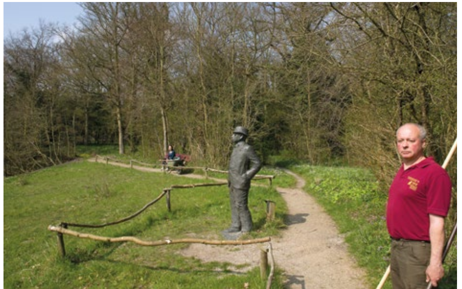
Sinds 1995 kijkt Jac. P. Thijsse in brons toe of alles in zijn tuin nog naar zijn zin verloopt

Vanzelfsprekend was Thijsse zelf de eerste die met rondleidingen begon