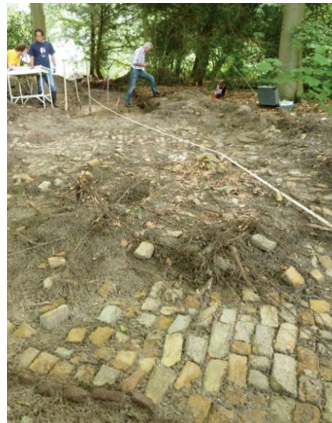
Bij het archeologische onderzoek kwamen er direct onder de graszoden paden uit de negentiende eeuw tevoorschijn

de plaats van de nieuw aan te leggen paden, sloten en vijvers. De delen van de buitenplaats die met de herinrichting niet verstoord werden, zijn niet onderzocht. Overigens is er niet alleen gegraven. Ook zijn er grondboringen en zogeheten sonderingen gezet, met boren en stangen. Dat genereerde ook waardevolle gegevens. Voor het bepalen van de meest kansrijke onderzoekslocaties projecteerden de archeologen de werktekening van de aannemer op de kaart uit 1717. Vervolgens keken zij waar de