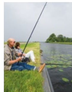
De trekvaart tussen Leiden en Haarlem is een 350 jaar oud kanaal

Hoe kunnen oude kanalen de duurzaamheid bevorderen? Wat heeft de toverlantaarn bijgedragen aan het onderwijs? En hoe kun je olieverfschilderijen uit de twintigste eeuw goed schoonmaken? Zestien groepen Europese onderzoekers gaan deze en andere vragen beantwoorden dankzij financiering via het zogeheten Joint Programming Initiative Cultural Heritage and Global Change. Aan acht onderzoeken werken Nederlanders mee. De Nederlandse onderzoekers ontvangen voor hun aandeel ruim een miljoen euro van de Nederlandse Organisatie voor Wetenschappelijk Onderzoek en de Rijksdienst voor het Cultureel Erfgoed. De Europese Commissie voegt daar 900.000 euro aan toe. Op deze manier stemmen vijftien landen hun onderzoek naar cultureel erfgoed op elkaar af.