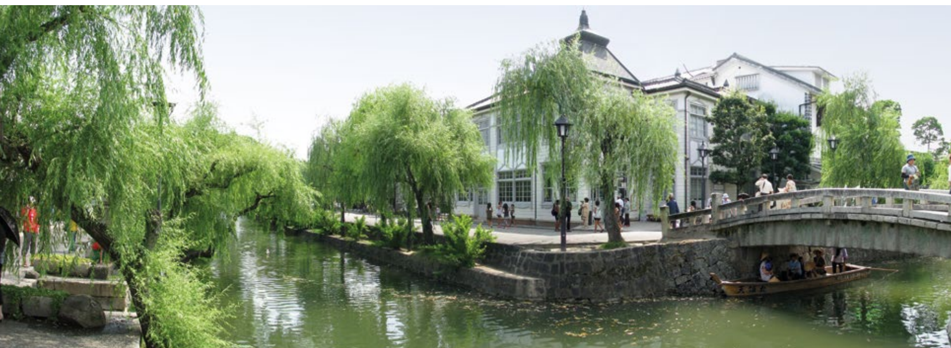
Het centrum is prachtig, maar je kunt er als inwoner geen boodschappen meer doen