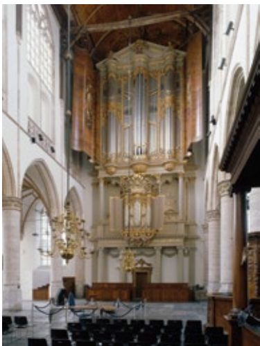
Het grote orgel van de Laurenskerk in Alkmaar

Wat is de toekomst van veel orgels, luidklokken, carillons en torenuurwerken nu kerken sluiten of een andere bestemming krijgen? Dit is het hoofdthema van het symposium Klinkend erfgoed , dat op vrijdag 11 september in de Sint-Laurenskerk in Alkmaar plaatsvindt. Iedereen met interesse in het onderwerp is welkom. De lezingen worden afgewisseld met muzikale intermezzo's. En tijdens de lunch kunnen de deelnemers een rondwandeling door 'klinkend' Alkmaar maken. De dag wordt georganiseerd door de Vereniging van Beheerders van Monumentale Kerkgebouwen in Nederland, het Platform Klinkend Erfgoed, de Stichting Erkende Restauratiekwaliteit Monumenten- en de Rijksdienst voor het Cultureel Erfgoed. Deelname: € 45,-. Nadere informatie en aanmelden: www.vbmk.nl .