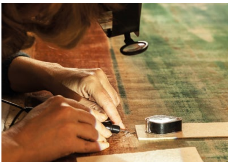
Een restaurator repareert een scheur in het doek 'Devoon'