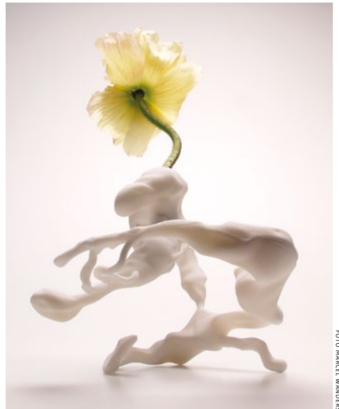
Hoe waardevol is een hedendaagse Airborne Snotty Vase van Marcel Wanders, die massaal uit een 3D-printer kan komen?

De kwetsbaarheid van jong erfgoed zit hem vaak in onderwaardering, zoals eerder bleek bij architectuur uit de wederopbouwperiode. Veel mensen vinden gebouwen uit de eerste twintig jaar na de Tweede Wereldoorlog te lelijk om te laten staan. De periode na 1965 is nog onvoldoende in kaart gebracht en een waarderingskader ontbreekt. Neem de beruchte Haagse flat de Zwarte Madonna van Carel Weeber, gebouwd in 1985. Die is in 2007