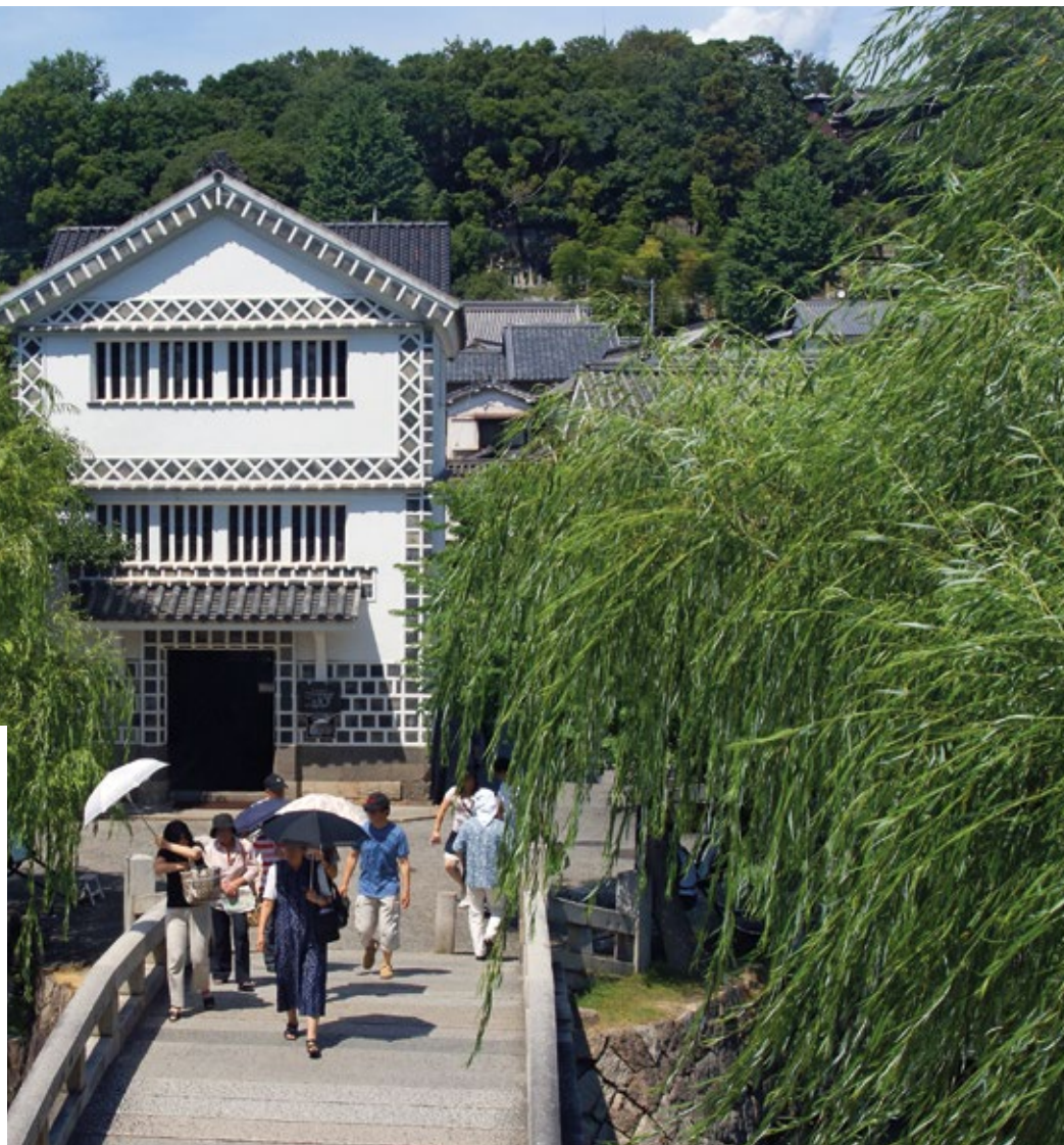
Jaarlijks overspoelen maar liefst drie miljoen bezoekers de oude binnenstad van Kurashiki

Als je er struikelt over de toeristen, is een historische stad dan nog wel leefbaar? Kurashiki in Japan worstelt ermee. Met een training inspireert Nederland de Japanners om dit op te lossen. ISJAH KOPPEJAN & JEAN-PAUL CORTEN