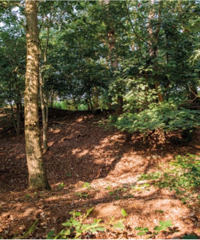
Overblijfselen van de gracht en de wal van de Franse Schans zijn nog herkenbaar in het landschap

» oorspronkelijk uit Groenlo, Grol. Ook in de naam van het stadion van FC Twente, de Grolsch Veste, klinkt het beleg na. In en rond Groenlo zijn er allerlei verwijzingen naar te vinden en er zijn fiets- en wandelroutes langs de linie uitgezet. Op een nog steeds leeg stuk schootsveld wordt de belegering elke twee jaar nagespeeld. Dit spektakel trekt duizenden bezoekers uit binnen- en buitenland. De linie leeft! Sinds de jaren zestig van de vorige eeuw bestuurden lokale onderzoekers de linie aan de hand van oude topografische kaarten, lucht- en satellietfoto's en historische teksten. Dit leidde in 2008 tot het boek Kijk op de linie . Bovendien zijn er kleine opgravingen uitgevoerd, meestal vlak voor er iets gebouwd ging worden. Ook is er opgegraven om meer informatie te verzamelen over specifieke delen en om de exacte begrenzingen daarvan vast te stellen. Verder zijn er opgravingen verricht voorafgaand aan de reconstructie van de Engelse Schans.