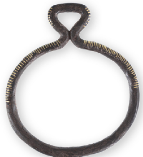
Met messing ingelegde ijzeren stijgbeugel uit het graf van een ongeveer 22-jarige man