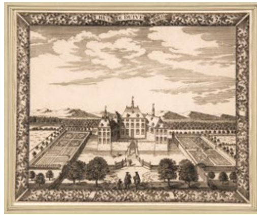
Op deze ets van Cornelis Elandt uit 1667 valt de classicistische tuin rond Duivenvoorde goed te zien

De landschapsarchitect koos ervoor om de rechthoekige hoofdvorm van de formele tuin uit de achttiende eeuw te herstellen. Hij liet daartoe oude watergangen uitgraven en opnieuw rechte lanen planten. Het landschappelijke park uit de negentiende eeuw is de boventoon blijven voeren, met veel aandacht