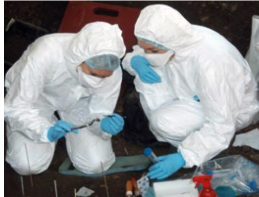
Onder steriele omstandigheden verzamelden universitaire specialisten tijdens de opgraving botmonsters voor DNA-onderzoek

Op het grafveld lagen niet alleen mensen, maar ook twee paarden, elk in een eigen kuil. Het waren twee jonge hengsten, die met hun leeftijd van rond de vier jaar nog niet of nauwelijks als rijdier zullen zijn gebruikt. Ze waren ongeveer even groot, met een schofthoogte van anderhalve meter. De dieren zijn niet gevild, zoals gebruikelijk was. Ze zijn zorgvuldig in dezelfde houding in hun graf neergelegd, op hun