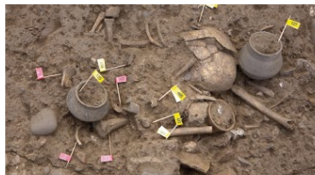
De botten van de twee jonge kinderen aan het voeteneind van hun moeder, met kleine potjes als grafgift

Deze zeldzame combinatie van villa en grafveld was reden voor Rijkswaterstaat om de plannen aan te passen. De verbreding is verderop gegraven. Zo konden de ondergrondse resten ter plaatse