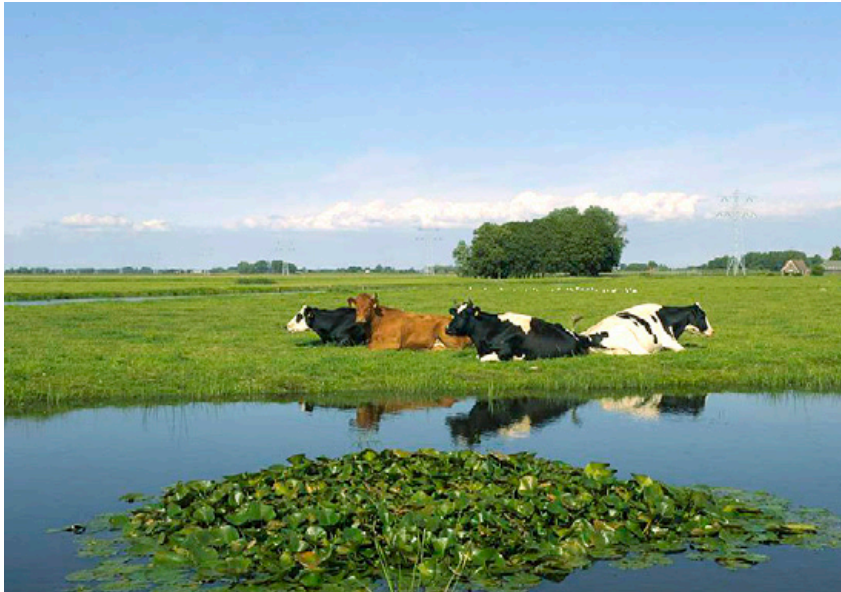
Open landschap met sloot in de Schermer

Reliëfverschillen in het landschap hebben altijd een bijzondere achtergrond. In het geval van Grevenbicht aan de Maas in Limburg is dat de voortdurende verlegging van de loop van de rivier in het verleden.