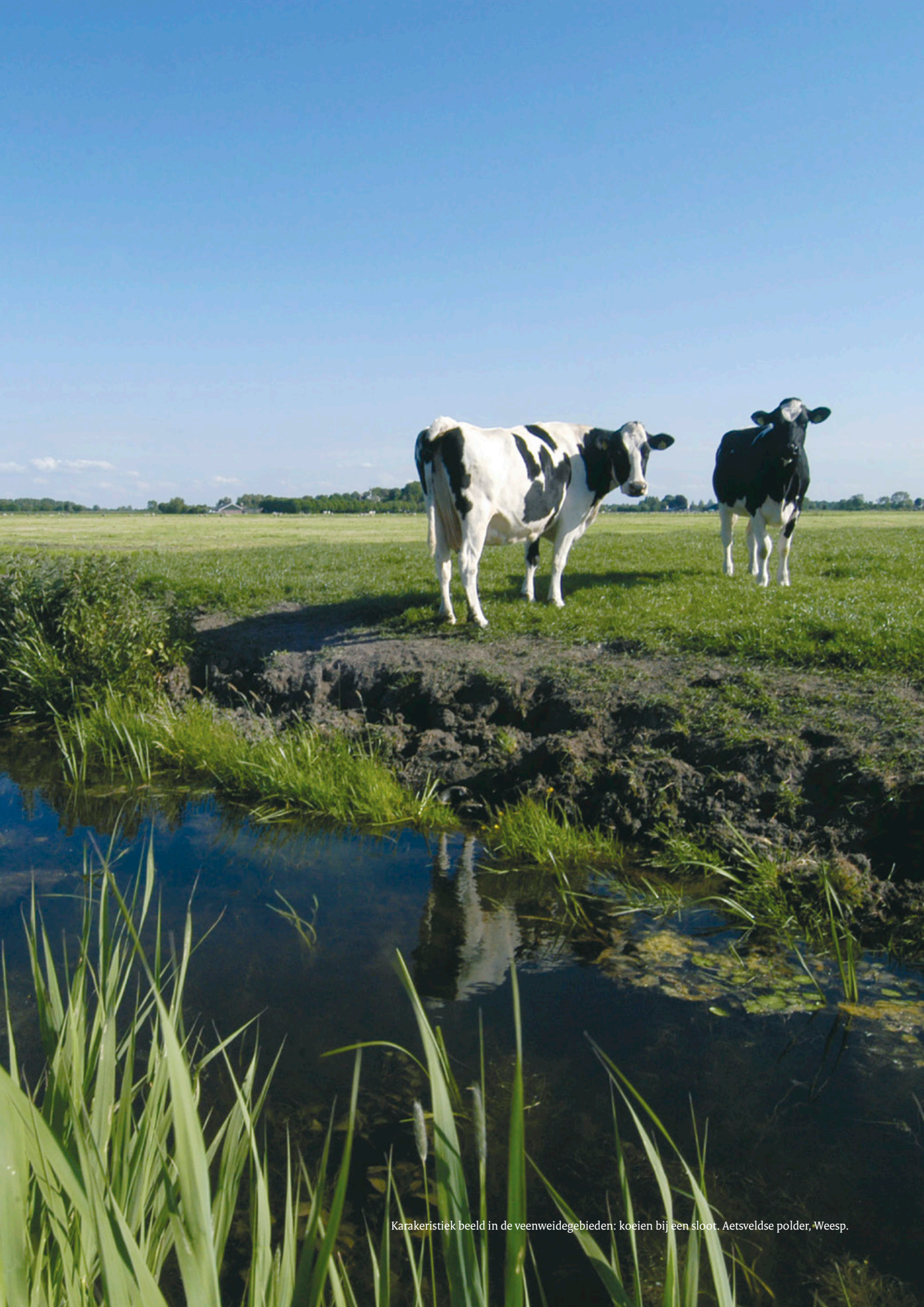
Karakteristiek beeld in de veenweidegebieden: koeien bij een sloot. Aetsveldse polder, Weesp.