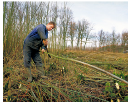
Werken in grienden is arbeidsintensief en levert naar verhouding weinig op. Het komt steeds minder voor. Griendwerker in Linschoten (Utrecht).

Deze thema's bieden alle drie aanknopingspunten voor erfgoed. Door in het gebied op onderzoek uit te gaan, ideeën te verzamelen bij