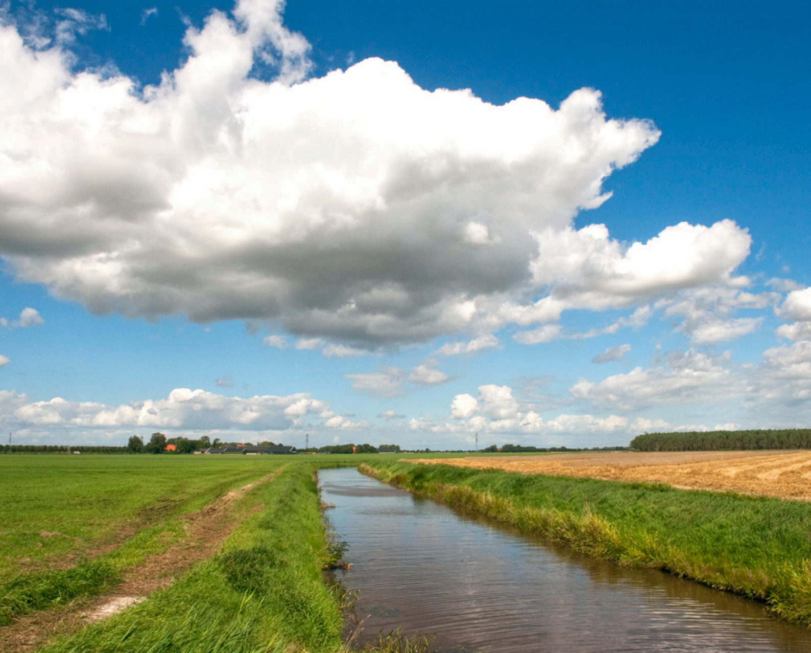
Kleine diepliggende weilanden bij Vlist (ZH). Te klein voor de eigentijdse agrarische bedrijfsvoering. Toch wordt er gras geoogst en heeft dit een plek in de moderne rationele bedrijfsvoering.