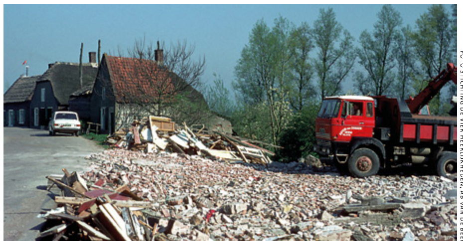
Tegen 1976 moest een belangrijk deel van het oude dorp Brakel wijken voor de verstevigde Waaldijk

De conferentie 'Protecting deltas: Heritage helps!' vindt van 23 tot en met 28 september plaats in Amsterdam. Nadere informatie: www.icomosconference.nl .