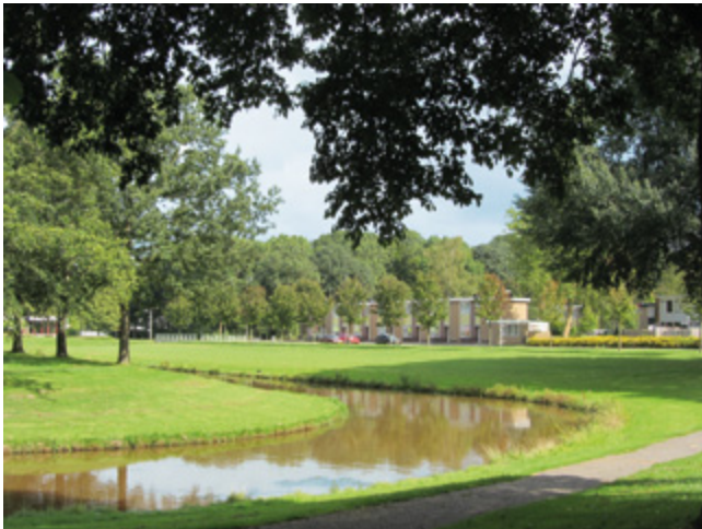
Het groene middenterrein vormt het hart van Nagele

Woensdag 18 september is een belangrijke dag voor Nagele. Dan ondertekenen de gemeente Noordoostpolder, de provincie Flevoland en de Rijksdienst voor het Cultureel Erfgoed een uitvoeringsovereenkomst die het dorp een impuls moet geven. Nagele is in de nota Visie erfgoed en ruimte van het Rijk aangemerkt als nationaal wederopbouwgebied. Ontworpen volgens de principes van het Nieuwe Bouwen is het stedenbouwkundig en architectonisch een van de meest bijzondere dorpen uit de jaren vijftig van de twintigste eeuw. Er gaat veel gebeuren in Nagele. Gebouwen worden opgeknapt, er komt nieuwbouw in het centrum en het groen wordt aangepakt.