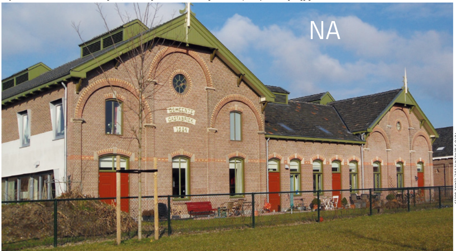
2013: het herstelde schone siermetselwerk en het groene, rode en lichtgele houtwerk hebben het gebouw de oorspronkelijke uitstraling teruggegeven