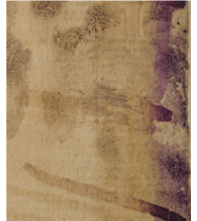
Onder de lijst heeft het licht 'De ruïne van de abdij op de Montmajour' niet bereikt, en is de originele kleur van de paarse inkt nog te zien

De expositie 'Van Gogh aan het werk' is tot en met 12 januari in het Van Gogh Museum in Amsterdam te zien. Nadere informatie: www.vangoghmuseum.nl .