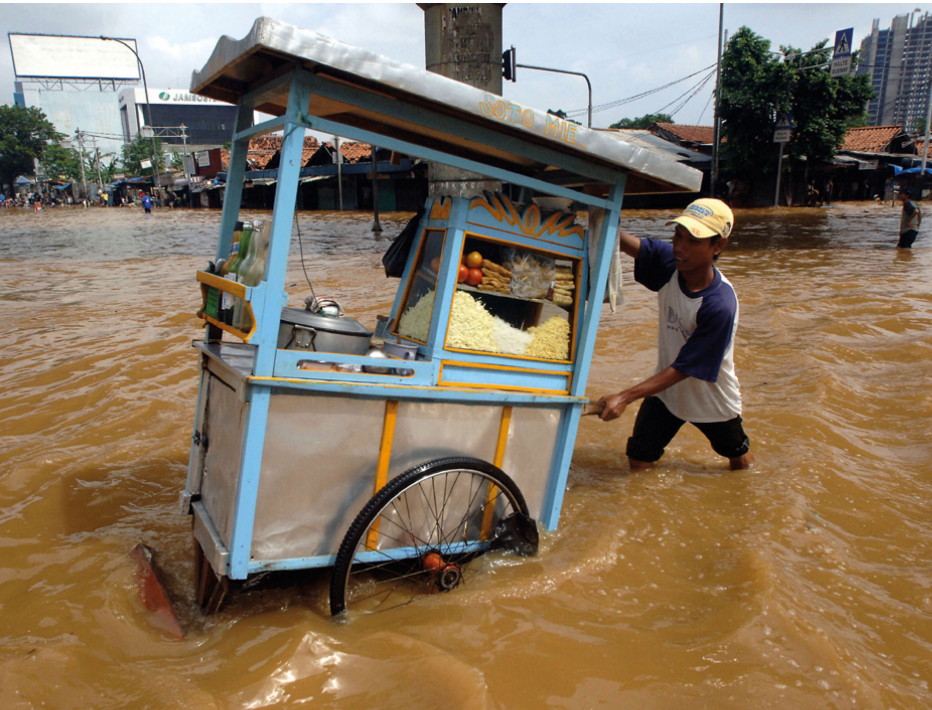
De historische benedenstad van Jakarta tijdens een van de periodieke overstromingen

Conferentie over cultureel erfgoed en water