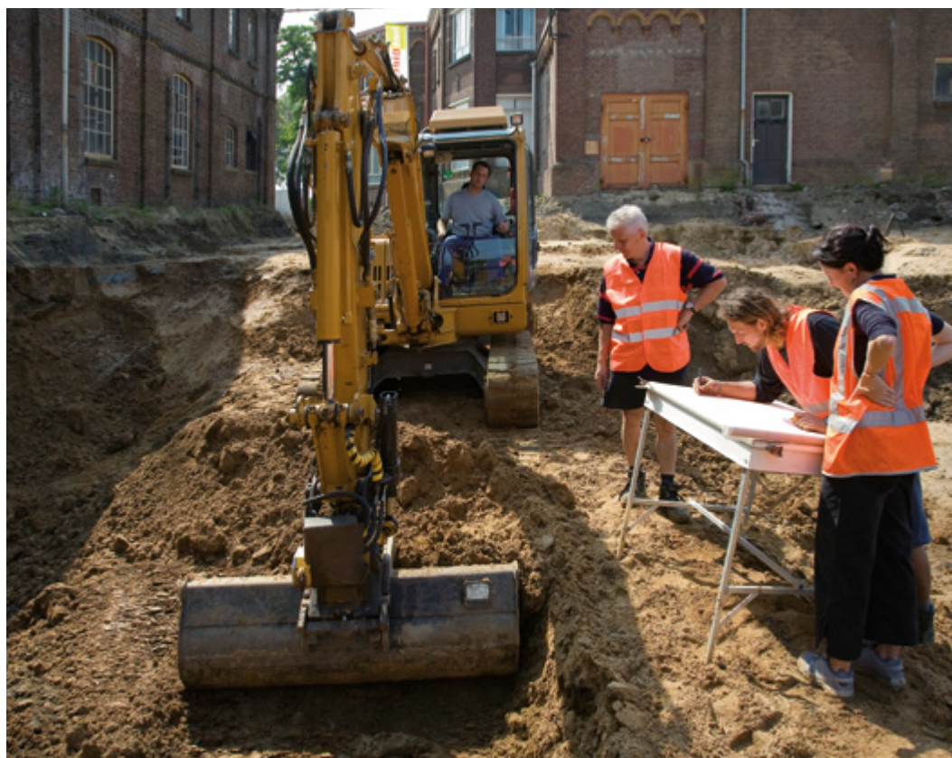
Een opgraving in Ulft