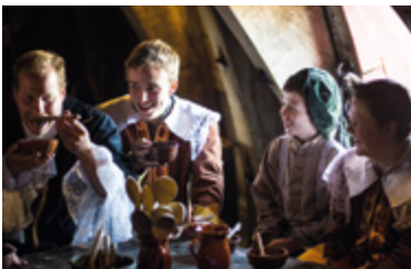
Eten aan boord van de Batavia

Op zondag 6 oktober vindt aan de Lelystadse kust het Archeologiefestival plaats, georganiseerd door de Bataviawerf, Nieuw Land en de Rijksdienst voor het Cultureel Erfgoed. Samen presenteren zij de volle breedte van de archeologie in de jongste provincie van Nederland. Want ook een jonge provincie als Flevoland heeft een oude geschiedenis. Er zijn vondsten gedaan uit prehistorie en middeleeuwen, en er zijn vliegtuigwrakken uit de Tweede Wereldoorlog gevonden. Bij de herbouw van het VOC-schip Batavia wordt experimentele archeologie bedreven. Bovendien is Flevoland het grootste scheepswrakkenkerkhof ter wereld. Nadere informatie: www.nieuwlanderfgoed.nl.