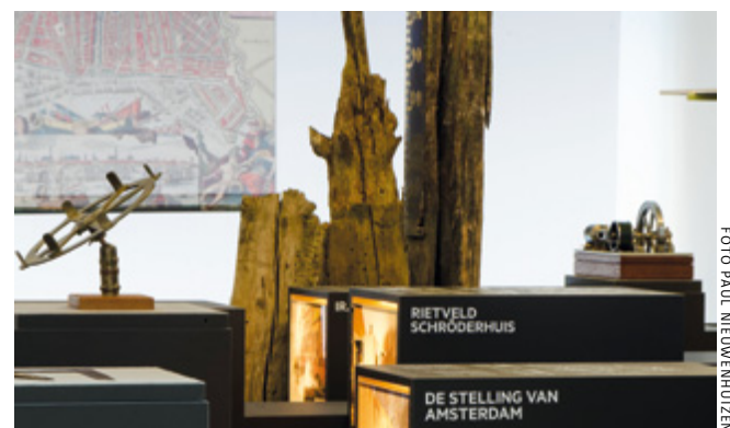
De permanente tentoonstelling in het Werelderfgoedpodium

Op 4 september heeft Jet Bussemaker, minister van Onderwijs, Cultuur en Wetenschap, het Werelderfgoedpodium geopend. Dit bezoekerscentrum is gevestigd in gebouw De Bazel in Amsterdam. Via een permanente tentoonstelling kan hier kennisgemaakt worden met de negen Nederlandse werelderfgoederen. Een wereldprimeur, want er bestaat nergens anders een nationaal bezoekerscentrum voor werelderfgoed. De gemeente Amsterdam, de UNESCO, de Stichting Werelderfgoed en de Rijksdienst voor het Cultureel Erfgoed zijn de initiatiefnemers van het Werelderfgoedpodium. Er worden regelmatig rondleidingen en lezingen gegeven. Nadere informatie: www.werelderfgoed.nl/podium .