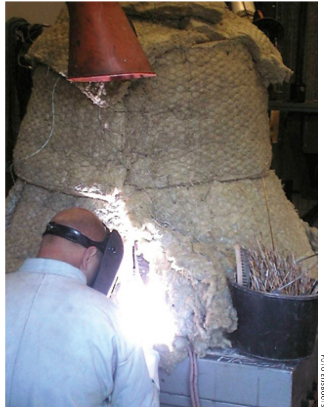
De gescheurde Van Wou-klok uit de Sint-Catharinakerk in Doetinchem wordt op zo'n manier gelast dat hij zijn oorspronkelijke klank terugkrijgt

Voordat Eijsbouts zijn reparatietechniek zo heeft kunnen perfectioneren, heeft het bedrijf samen met de Rijksdienst voor