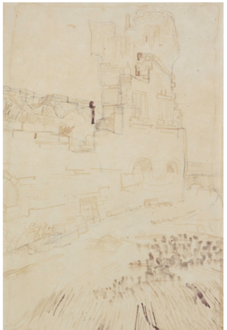
De paarse aniline-inkt van 'De ruïne van de abdij op de Montmajour' uit 1888 is verkleurd tot een lichtbruine schim