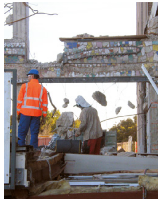
Bij de afbraak van het hotelgedeelte van Hotel Britannia in 2010 werden er per ongeluk toch delen van het mozaïek gesloopt