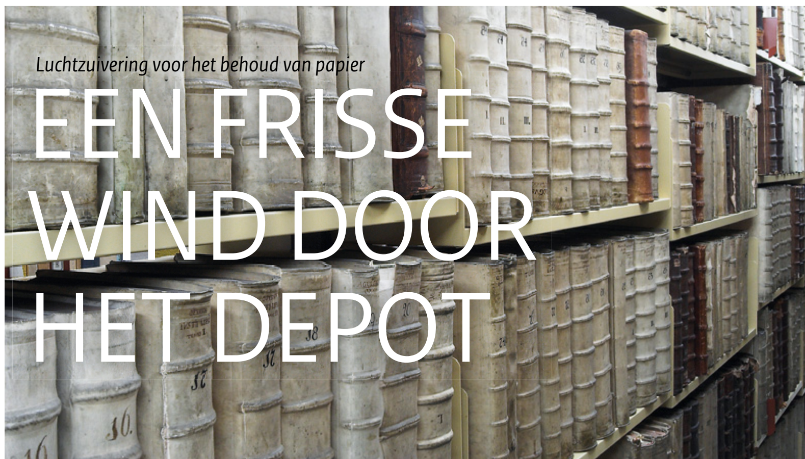
De Koninklijke Bibliotheek plaatst geen chemische filters in te renoveren klimaatinstallaties