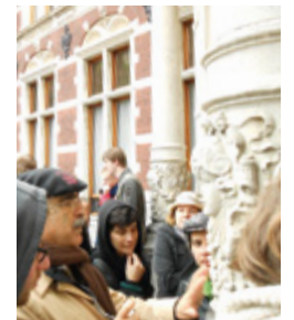
Enkele deelnemers tijdens een excursie in Amsterdam

Aan het eind van het voorjaar was de Rijksdienst voor het Cultureel Erfgoed gedurende twee weken gastheer van een internationale Charisma-cursus over het in stand houden van steen. Door middel van lezingen en excursies kregen 29 deelnemers uit 15 landen een overzicht van de nieuwste ontwikkelingen. Iedere deelnemer bracht een praktijkgeval in, dat uitgebreid werd besproken. Dit gaf een goed beeld van de variëteit aan kwesties die opduiken bij het in stand houden van steen.