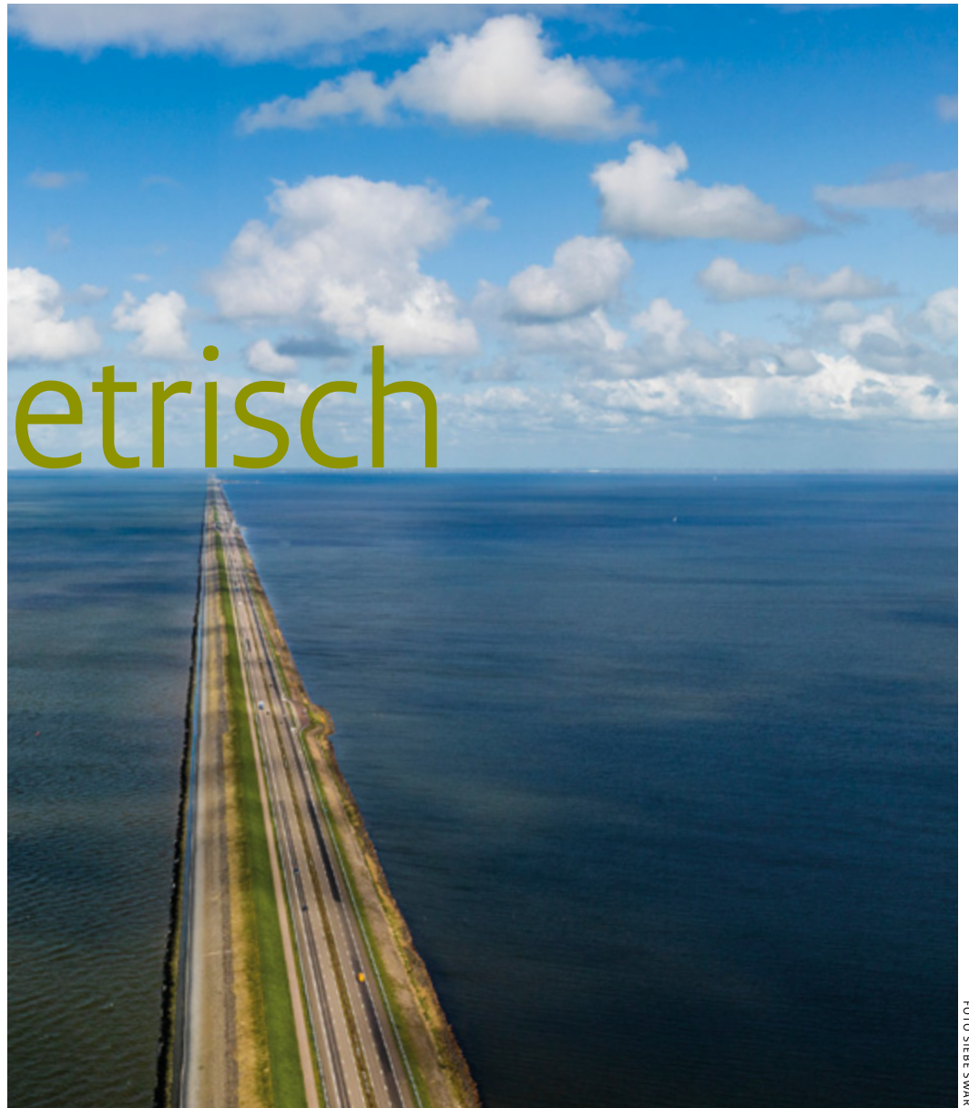
Links en rechts zal de Afsluitdijk versterkt worden, op zo'n manier dat het strakke profiel gehandhaafd blijft

De manier waarop de Rijksdienst en Rijkswaterstaat hierin samen optrekken, representeert een nieuwe werkwijze. Deze aanpak heeft het Rijk in 2011 beschreven in de nota Kiezen voor karakter: Visie erfgoed en ruimte . Het is zaak dat bij veranderingen in de omgeving de cultuurhistorische waarde daarvan vanaf het begin vanzelfsprekend meetelt. Bij aanpassingen en nieuwe ontwerpen wordt het culturele karakter van het gebied, met de identiteit, de kwaliteit en de eigenheid van die locatie stan-