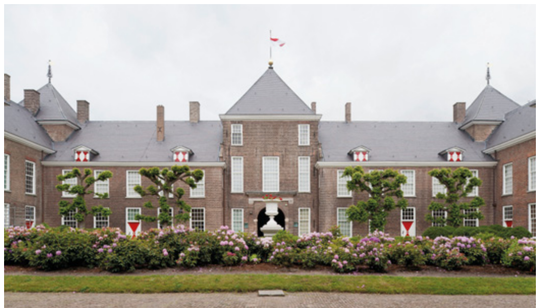
Kasteel Heeze is een statig landhuis uit 1675

Zestien sprekers maken op woensdag 9 oktober hun opwachting in de rijke art deco van Theater Tuschinski in Amsterdam. Op het symposium Behoud van binnen , dat de Rijksdienst voor het Cultureel Erfgoed dan houdt, vertellen zij hoe interieurs voor schade behoed kunnen worden. Met bijvoorbeeld een planmatige aanpak en inspecties. Door met kennis van zaken ambachtslieden, schoonmakers en vrijwilligers aan te sturen. En wat dat financieel oplevert. Op dezelfde dag verschijnt hier ook een boek over, en wordt de website www.behoudvanbinnen.nl gelanceerd. Nadere informatie en inschrijving: www.cultureelerfgoed.nl .