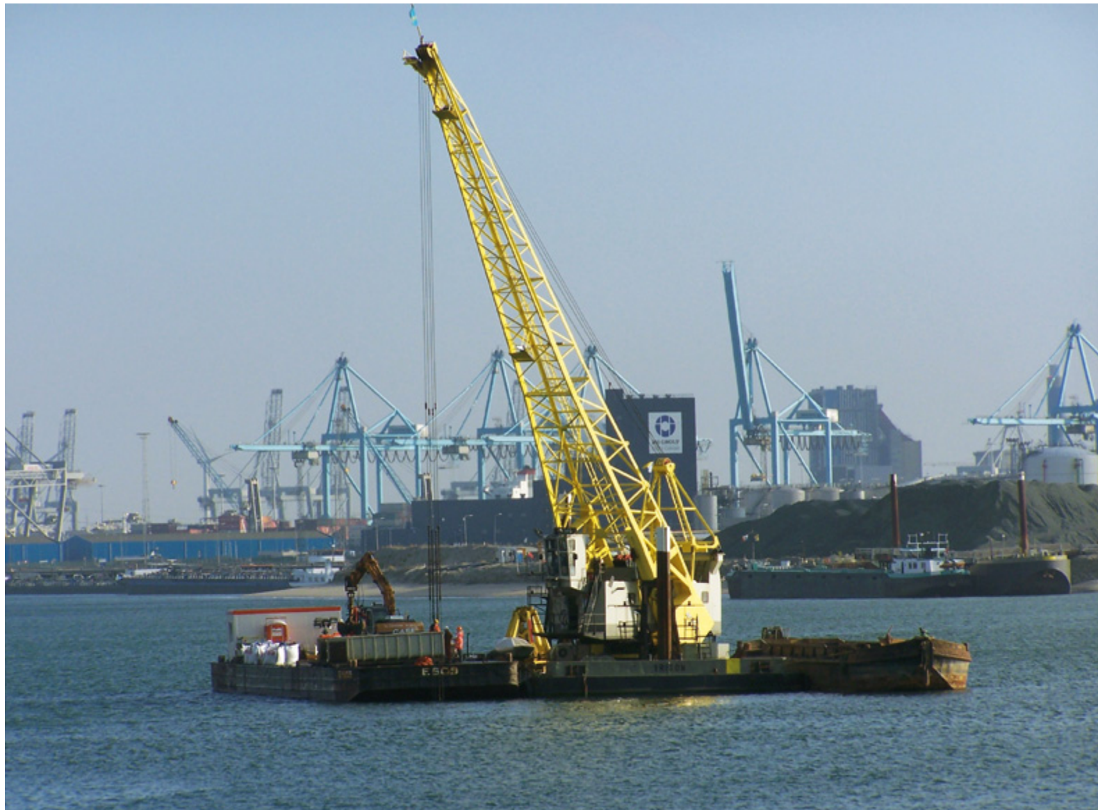
In de Yangtzehaven haalde een kraan op een ponton sediment naar boven