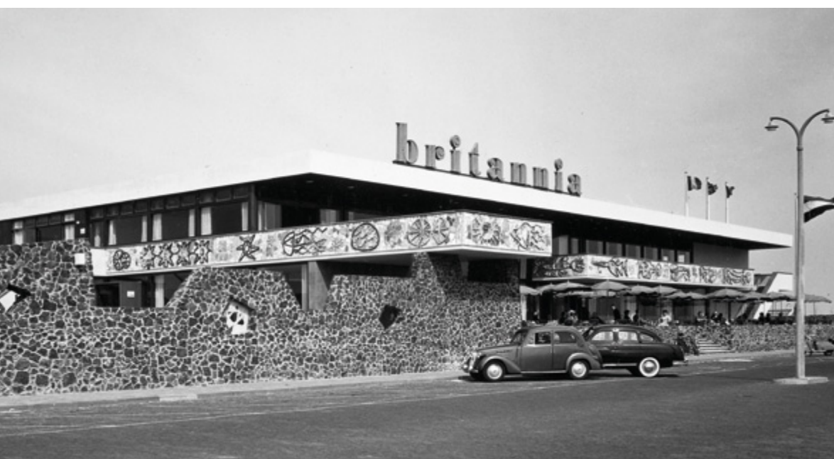
Paviljoen Britannia aan de boulevard van Vlissingen kort na de oplevering in 1955, met een mozaïekfries van Louis van Roode

Ook zonder gebruik te maken van de percentage-regeling werden er nieuwe gebouwen toegerust met kunstwerken. De stichting Kunst en Bedrijf bemiddelde tussen bedrijven en kunstenaars. Zo werden ook veel bankgebouwen, warenhuizen en andere bedrijfspanden voorzien van kunst. De Eerste Nederlandse Cement Industrie in Maastricht bijvoorbeeld gaf Frans Slijpen de opdracht een kunstwerk te maken voor het bedrijfsrestaurant van het nieuwe hoofdkantoor, dat gebouwd is tussen 1961 en 1964. Slijpen maakte een abstract inlegwerk van marmer, »