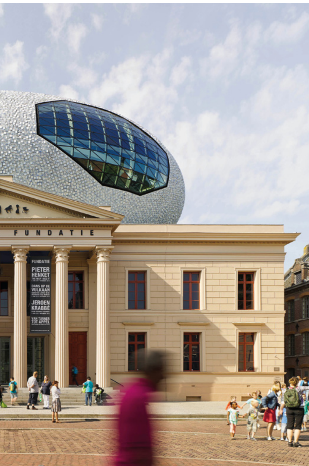
Het alzijdige gebouw, zo fraai gelegen tussen park en plein, verdraagt geen aanbouw aan de gevels

In Zwolle is iets opvallends gebeurd, boven op het dak van het paleis van justitie uit de negentiende eeuw. Museum de Fundatie heeft hiermee fors meer ruimte gekregen. Kan dat eigenlijk wel, zo'n uitgesproken uitbreiding van een rijksmonument? MARIËL KOK