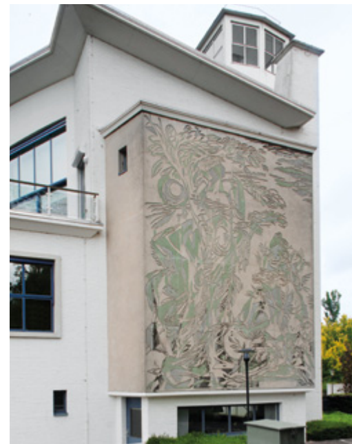
Een sgraffito van Jeroen Voskuyl op het Laboratorium voor Landmeetkunde uit 1953 van de Landbouwhogeschool Wageningen