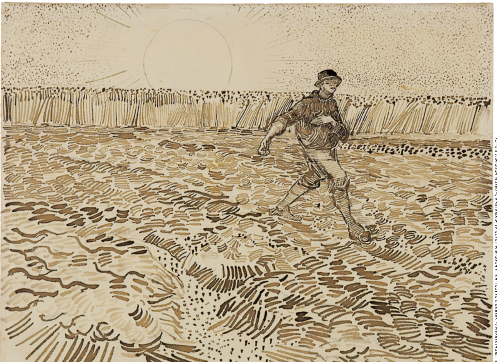
'De Zaaier' tekende Vincent van Gogh in augustus 1888 met chroomblauwhoutinkt in de stad Arles in Zuid-Frankrijk

Het lijkt erop dat hij alleen in zijn Nederlandse periode, van 1881 tot en met 1885, ijzergallusinkt heeft gebruikt. Deze zwartbruine schrijfinkt is gemaakt van een looizuurhoudend extract van galnoten, ijzervulfaat en Arabische gom. Gezien de onderzochte tekeningen en brieven heeft Van Gogh in zijn Franse periode, van 1886 tot en met 1890, waarschijnlijk niet of weinig met ijzergallusinkt gewerkt. In Antwerpen, waar hij in 1885 en 1886 verbleef, tekende en schreef hij met blauwhoutinkt, net als eerder in Etten en Den Haag.