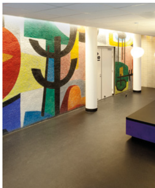
Een abstracte wandschildering van Willem Hussem in de Zuiderpark-hubs uit 1957 in de Haagse uitbreidingswijk Morgenstond