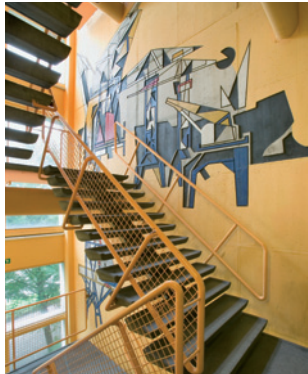
Amsterdam, Christelijke technische school Patrimonium, betonreliëf, Harry op de Laak, 1956