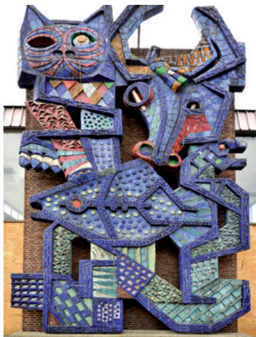
Pernis, Rubberkantoor Shell, herplaatst in Ons Huis, Hoogvliet, geglaazuurd reliëf, Dick Elffers, 1960

De Rijksdienst voor het Cultureel Erfgoed heeft de site helpwandkunststopsporen.nl ontwikkeld om monumentale kunst uit de wederopbouwperiode (1940-1965) in kaart te brengen en zo een landelijk overzicht te maken. Daar hebben wij uw hulp bij nodig!