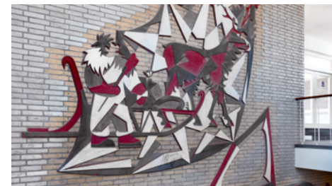
Rotterdam, Stationspostgebouw, nu Central Post, sgraffito, Bas van der Smit, 1959

Wilt u meer weten over het erfgoed van de wederopbouw? Kijk dan op monumenten.nl/wederopbouw.nl