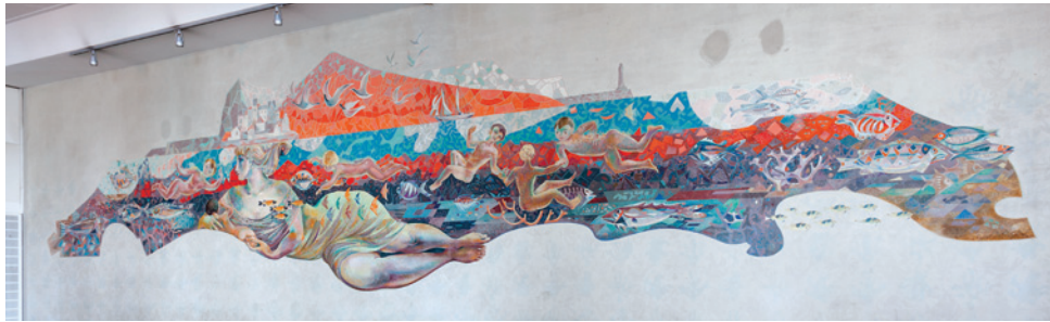
Amsterdam, Kompashal, wandschildering, Cuno van der Steene, 1956