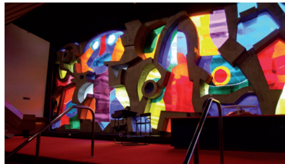
Rotterdam, Technikon, glas-in-betonpaneel, Karel Appel, 1964