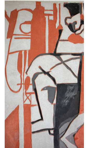
Amsterdam, Academisch Medisch Centrum, sgraffito, Lex Horn, 1965