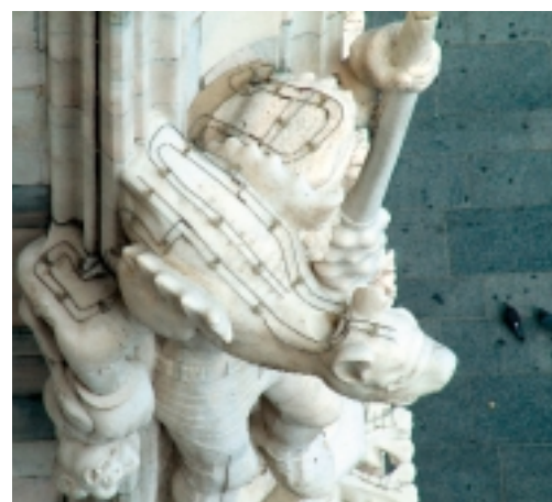
Een elektrostatisch systeem, aangebracht op beeldhouwwerk van een kerk. De duiven raken met beide pootjes de draden en krijgen daardoor onschadelijke stroomstootjes. Zie pagina 5