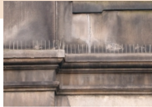
Een waterlijst voorzien van kunststof pennen

Kleefpasta Kleefpasta, ook contactafweerstof genoemd, veroorzaakt irritatie aan de poten en onzekerheid bij startende en landende duiven. Ervaring leert dat duiven na verloop van tijd