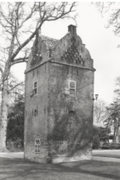
De duiventoren uit 1539 op de buitenplaats Te Werve in het Zuid-Hollandse Rijswijk