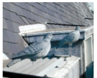
Plastic duiven als afweermiddel. De boodschap moet duidelijk zijn: hier is geen plaats meer!