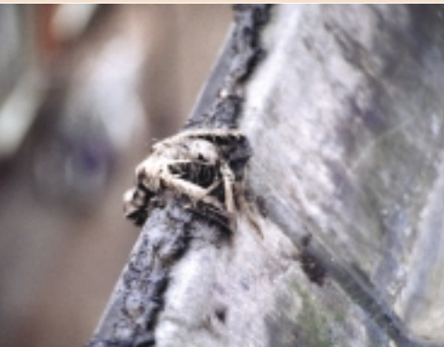
Negatief effect van kleefpasta: vogels kleven vast, kunnen niet meer loskomen en verhongeren