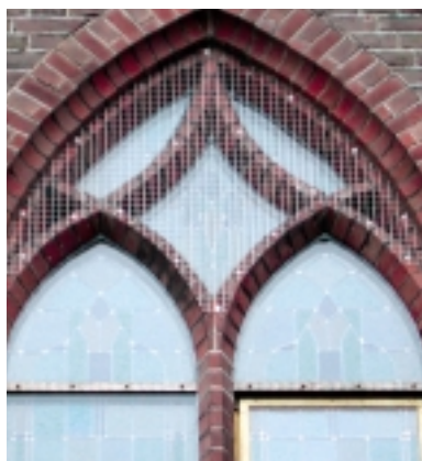
De raamkop van dit venster is voorzien van roestvast gaas om nestelen van vogels te voorkomen