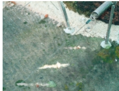
Resultaat van in het verleden aanbrengen van pennen in natuursteen. De pennen zijn recent verwijderd met een slijpschijf. Daardoor is er schade aan de natuursteen ontstaan. Bovendien zitten de pen-restanten nog vast in de steen. De pennen zijn vervangen door afgeveerde draden, waarvoor weer nieuwe gaatjes in de steen zijn geboord