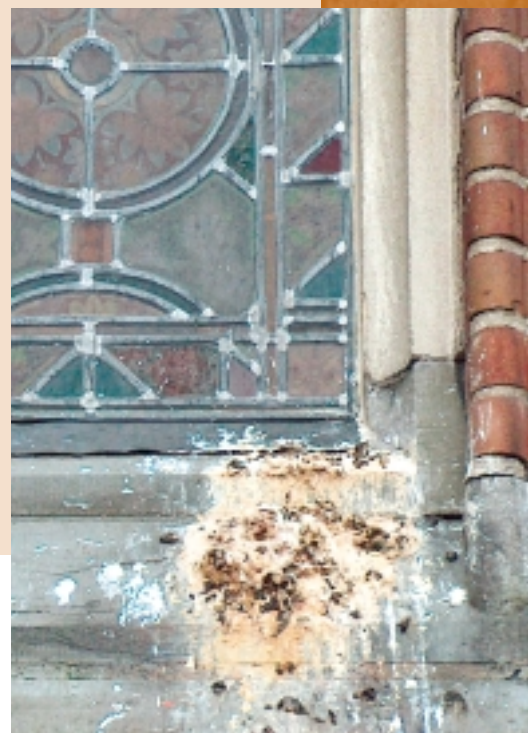
Duivenpoep op een monument: niet alleen vervuילend, maar ook schadelijk

Daar waar duiven rusten, 'roesten' in duiventermen, deponeren zij hun uitwerpselen. De vervuiling die door de vaak massale aanwezigheid van duiven optreedt, leidt in combinatie met nesten en kadavers tot soms ernstige directe en indirecte schade aan monumenten. Monumenteigenaren kunnen maatregelen nemen om duiven van hun gebouw te weren. De overheid kan maatregelen nemen om de duivenpopulatie terug te dringen en alternatieve roestplaatsen te creëren. Via deze brochure gaat de Rijksdienst voor de Monumentenzorg in op beide manieren van overlastbestrijding.