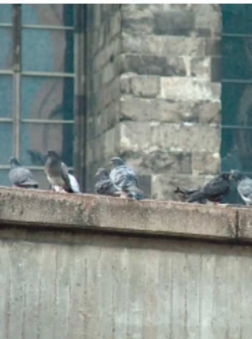
Het beton en de (natuur)steen in de steden lijken sterk op de rotsen in de natuurlijke omgeving van duiven. Reden waarom ze zich er zo thuis voelen

delijke status kreeg. In de Oudheid waren de Perzen, de Grieken, de Romeinse keizers en de Egyptenaren allemaal hartstochtelijke duivenliefhebbers. Ze hielden er fokkerijen op na met duizenden vogels, vaak voor consumptie.