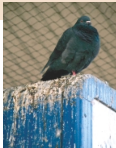
Daar waar duiven rusten, 'roesten' in duiven- termen, deponeren zij hun uitwerpselen

Wetenschappelijk onderzoek heeft uitgewezen dat verwilderde duiven nagenoeg geen risico vormen voor de volksgezondheid. Ziekten als paratyfus, tuberculose en papegaaienziekte worden niet door duiven overgebracht en een vorm van vogeltuberculose die bij duiven kan voorkomen, is voor de mens niet schadelijk. Door inademen van organisch materiaal uit veren en opgedroogde ontlasting, kan echter een zogenaamde duivenmelkerslong ontstaan (extrinsieke allergische alveolitis). Met name monumentenwachters en onderhoudswerkers lopen risico, bijvoorbeeld in voor duiven toegankelijke kappen van kerken. Voor de behandeling van deze aandoening is het van belang dat de blootstelling aan duiven vermeden wordt. Duivennesten stinken en zijn een broedplaats voor 'ongedierte', zoals duizendpoten, oorwormen, mijten, motten en kevers. Ook na vertrek van de duiven kunnen de nesten door de verendeeltjes en ontlasting die erin aanwezig zijn nog een duivenmelkerslong veroorzaken.