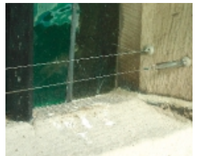
Afgeveerde draden die te hoog zijn aangebracht. De duiven kunnen er, gelet op de uitwerpselen, onder roesten