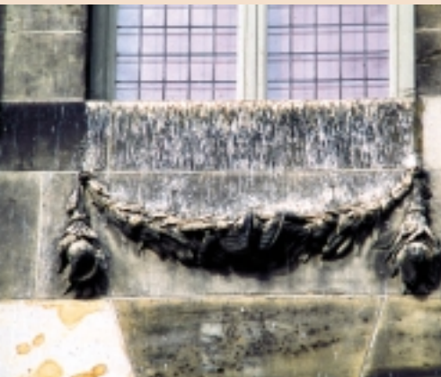
Detail van het Paleis op de Dam: het resultaat van het voeren van de duiven tekende zich voorheen af op de onderdorpels van de ramen. Inmiddels zijn er maatregelen getroffen, waardoor dit beeld tot het verleden behoort

Het beeldhouwwerk van deze kerk is beschermd met netten. Wellicht niet de mooiste oplossing, maar voor deze bewerkte gevel wel de meest optimale