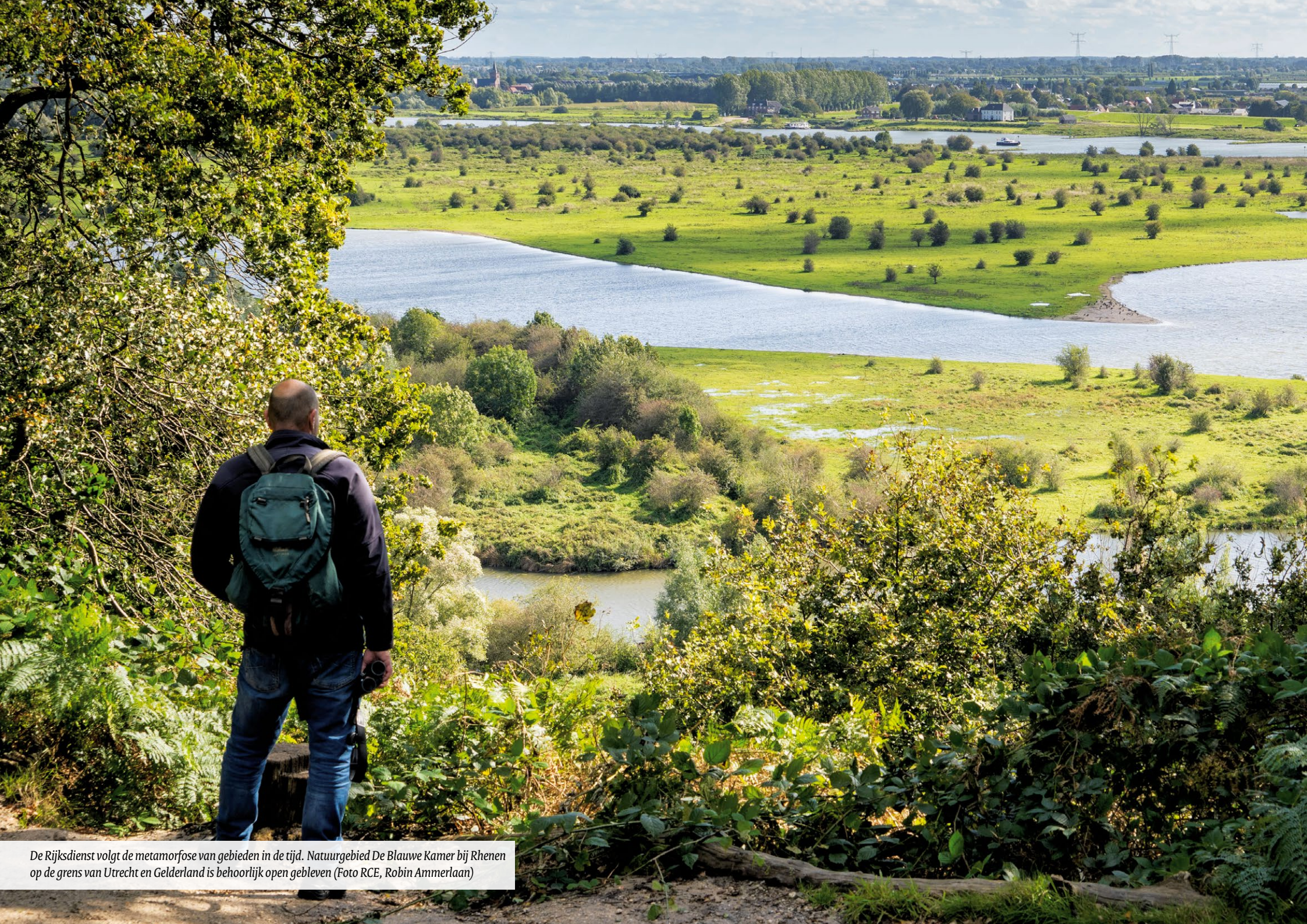
De Rijksdienst volgt de metamorfose van gebieden in de tijd. Natuurgebied De Blauwe Kamer bij Rhenen op de grens van Utrecht en Gelderland is behoorlijk open gebleven