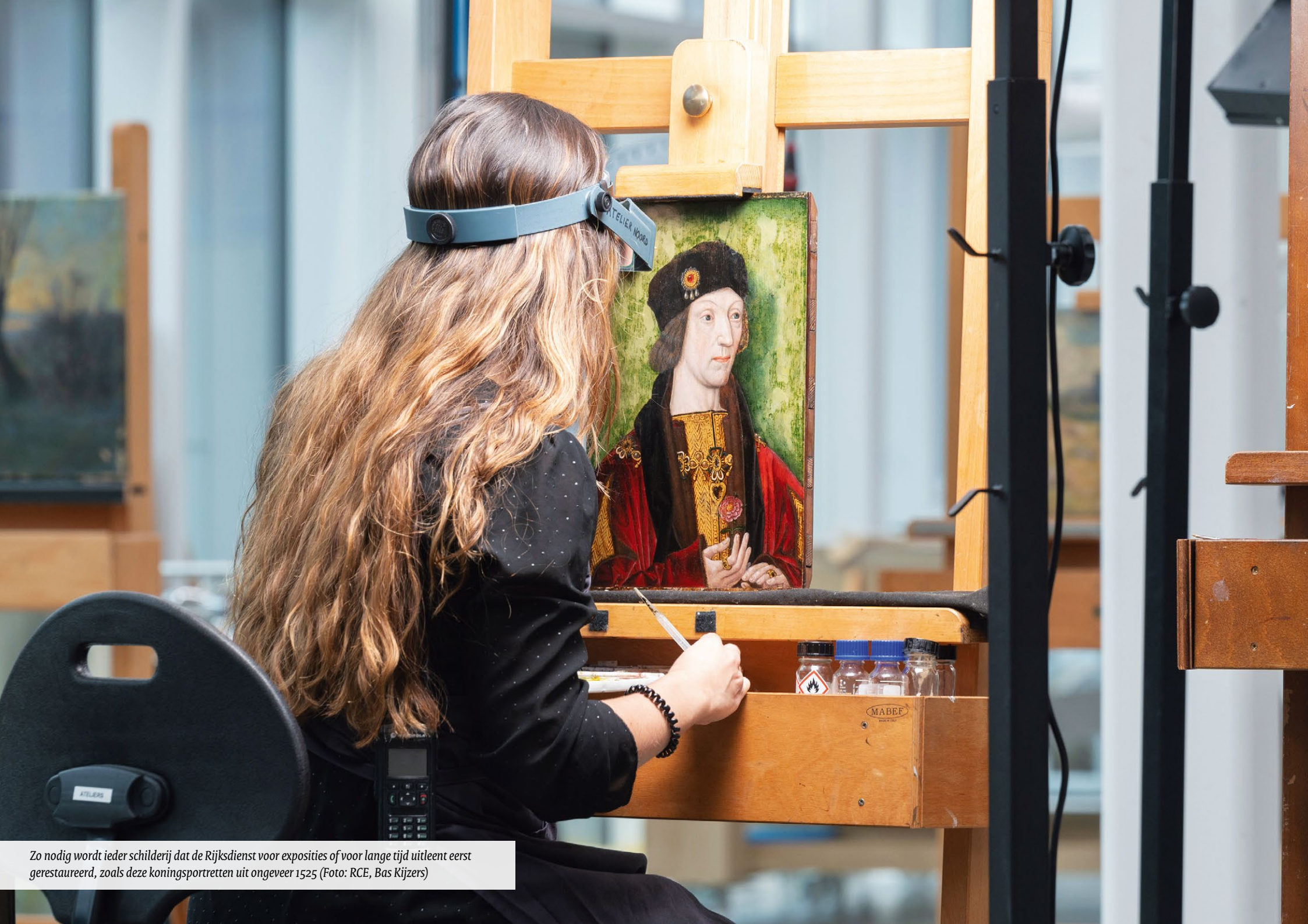
Zo nodig wordt ieder schilderij dat de Rijksdienst voor exposities of voor lange tijd uitleent eerst gerestaureerd, zoals deze koningsportretten uit ongeveer 1525