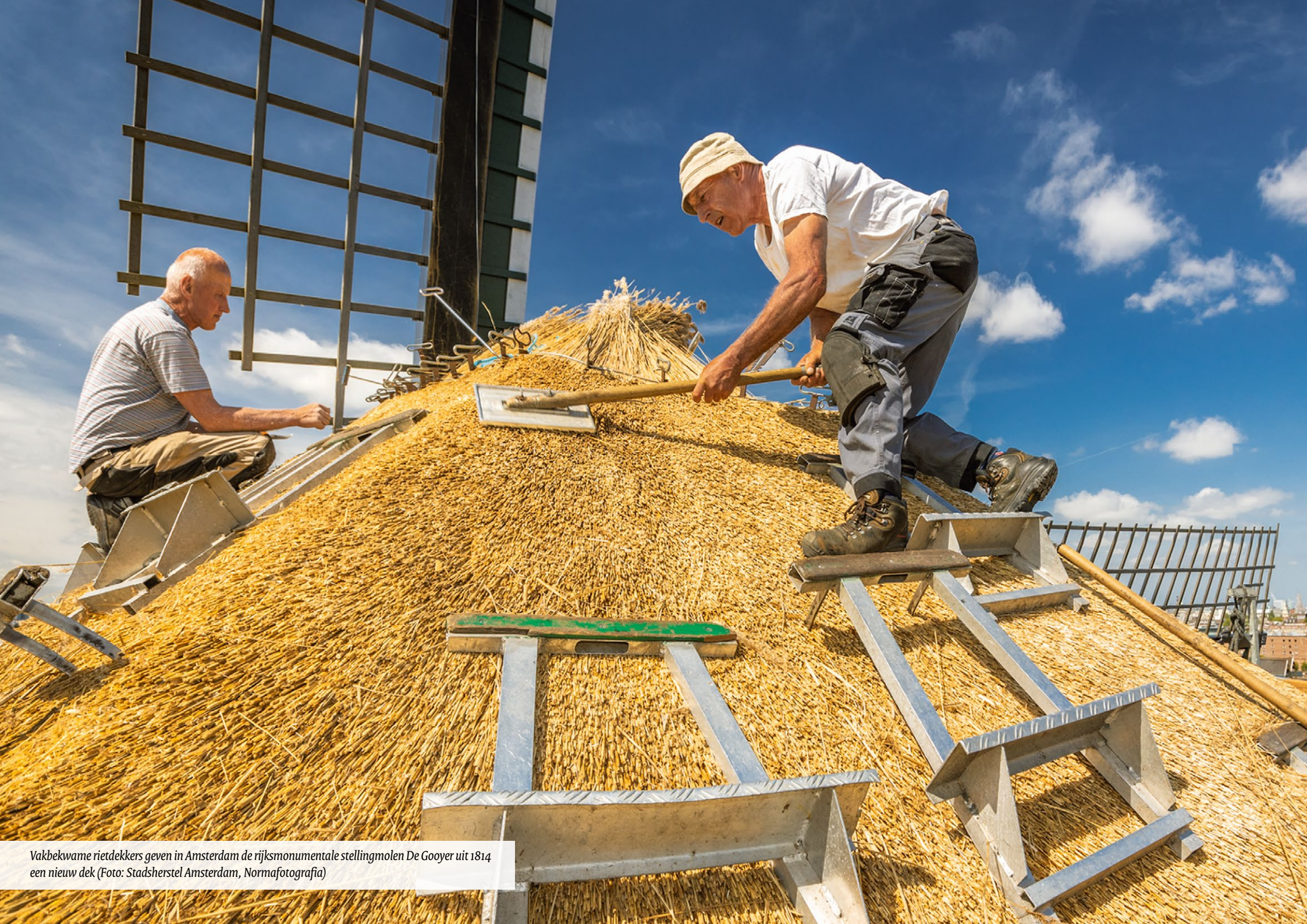
Vakbekwame rietdekkers geven in Amsterdam de rijksmonumentale stellingmolen De Gooyer uit 1814 een nieuw dek