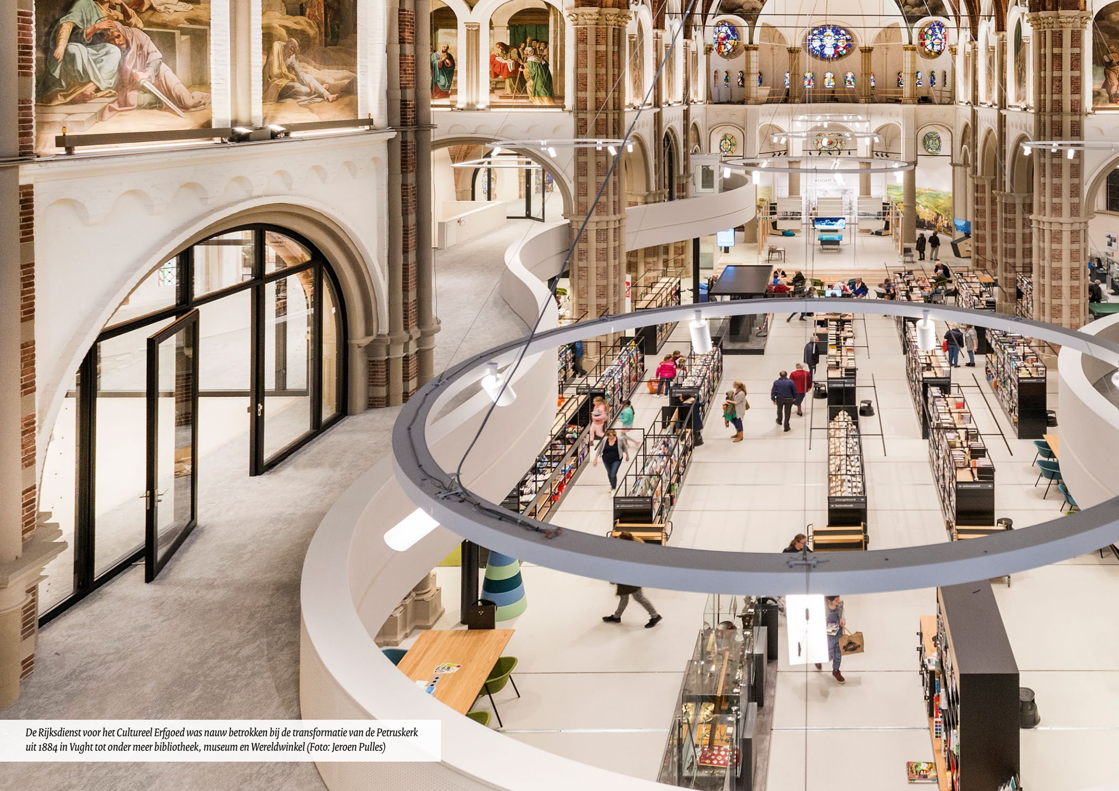
De Rijksdienst voor het Cultureel Erfgoed was nauw betrokken bij de transformatie van de Petruskerk uit 1884 in Vught tot onder meer bibliotheek, museum en Wereldwinkel